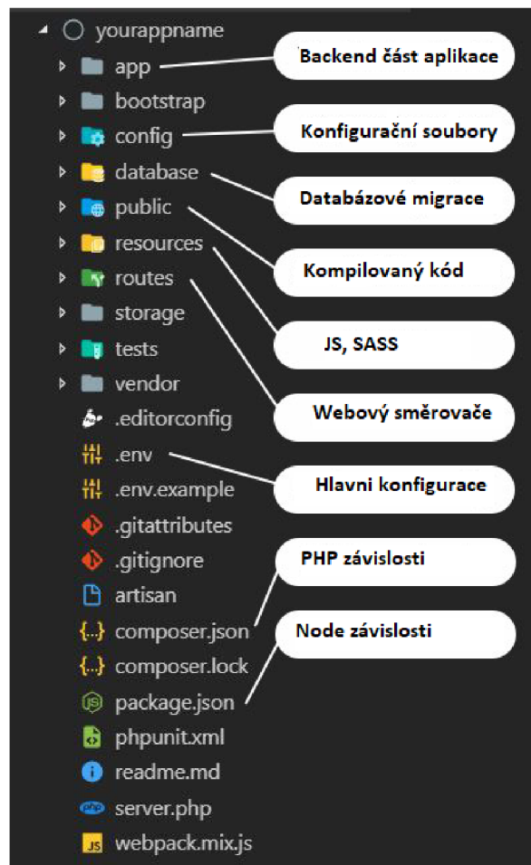
Obrázek 2 - Struktura Laravel

Pro provedení veškerých příkazů je generovaná struktura projektu, která je vyobrazena na obrázku níže: