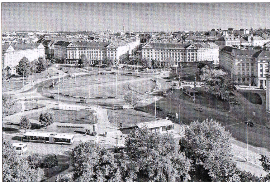
Vítězné náměstí se dočká proměny, byla vypsaná architektonická soutěž.

Budoucnost má být jiná a zřejmě nepatří jen autům. „Obyvatelé Prahy by se měli zkrátka na Vítězném náměstí cítit dobře. Zkušenosti ze západní Evropy ukazují, že je možné