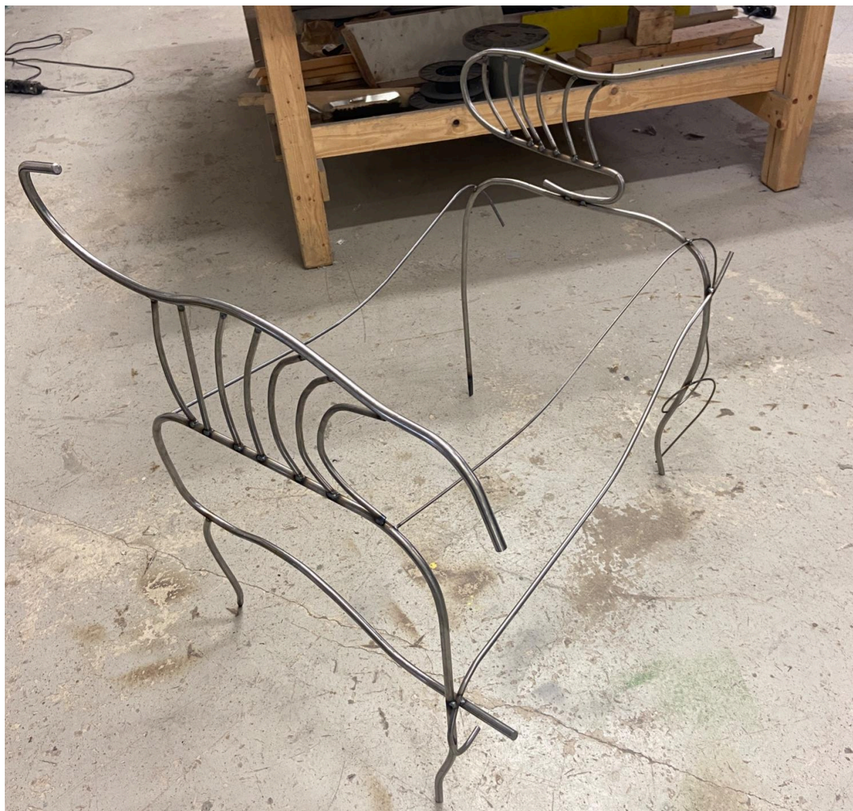
Hostile Land, Stalk Must Forestand, kovová instalace, 95 x 70 cm x 60 cm, 2024