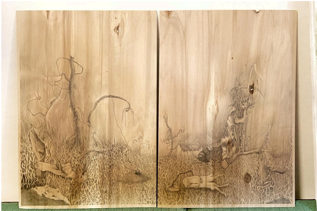
Creeping in The Destruction , dyptych, kresba tužkou na dřevě, 70 x 40 cm x 70 cm x 40 cm, 2024