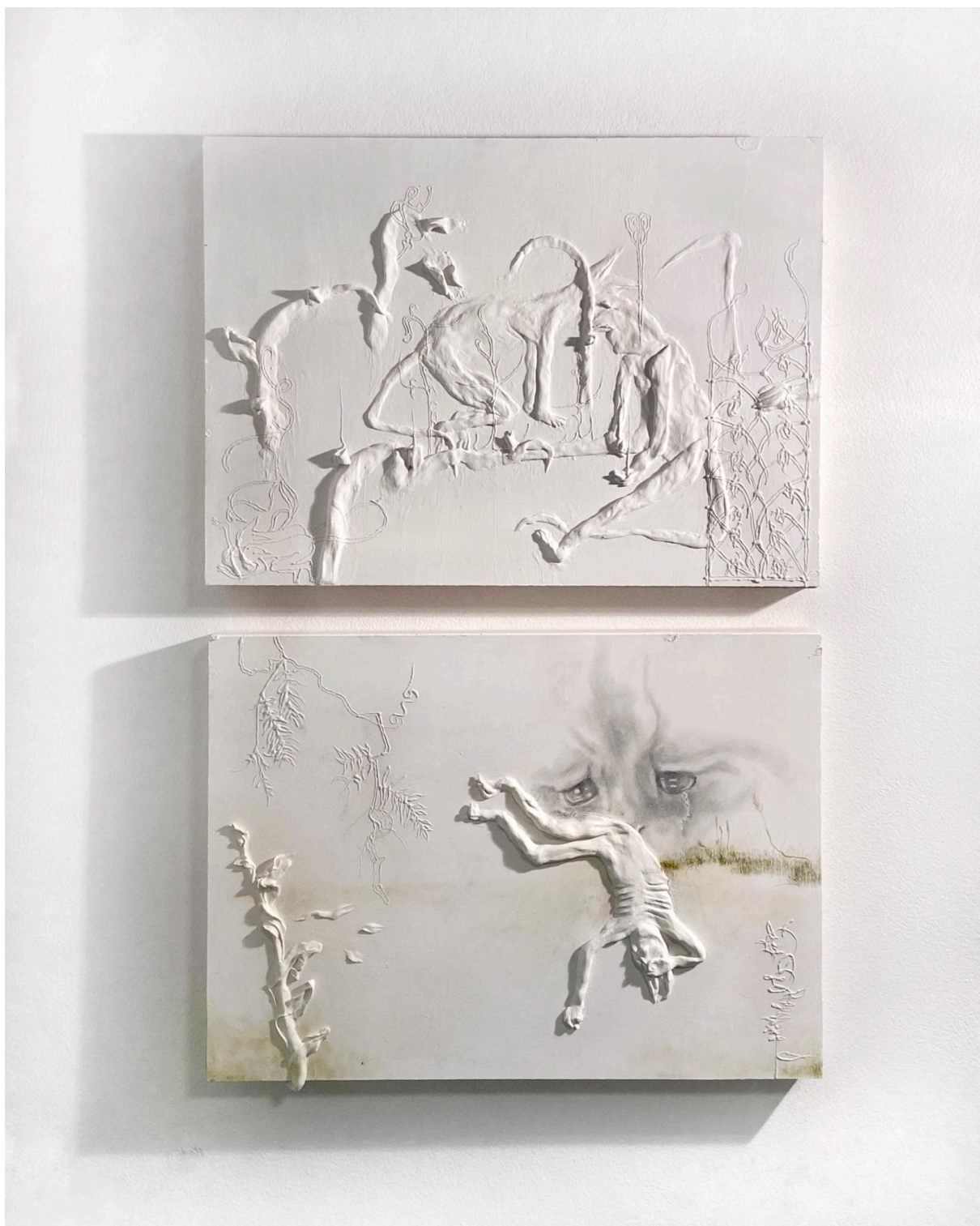
The Noticable Absence of Love Implies The Very Existence Of It , reliéf, kombinovaná technika a kresba tužkou na dřevě, 70 x 40 cm x 70 cm x 40 cm, 2024