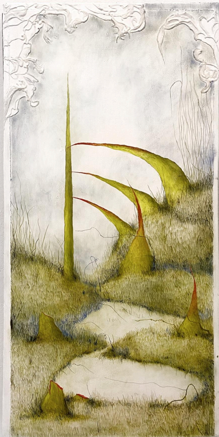
Sides Encounter , olejomalba na dřevě, 35 x 85 cm, 2024