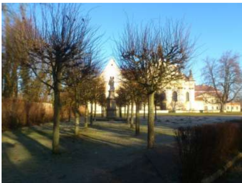
Obrázek č. 5: Socha svaté Anny