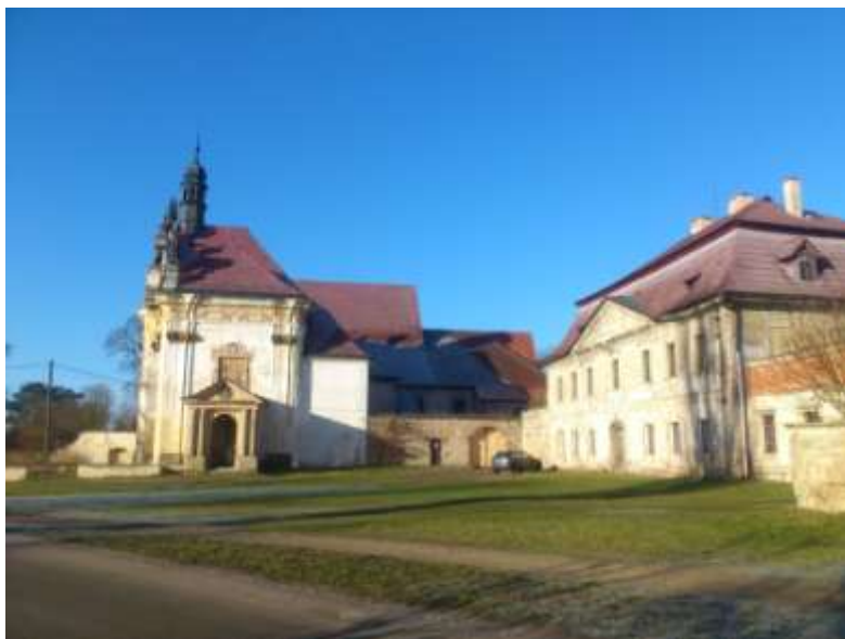
Obrázek č. 7: Boční pohled na Kapucínský klášter