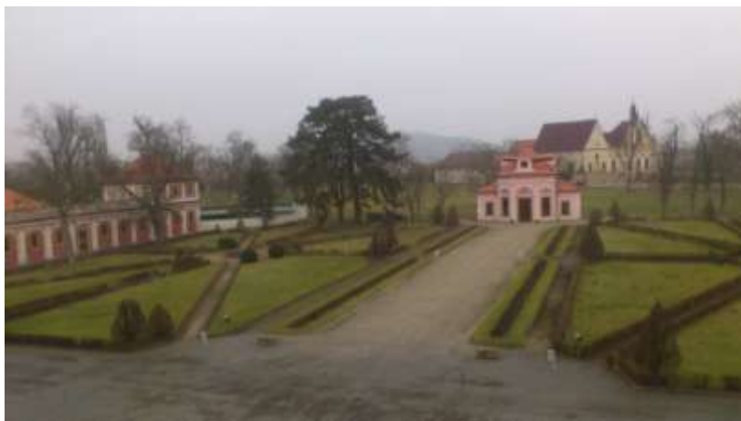
Obrázek č. 4: Pohled z 1. patra zámku do zámecké zahrady