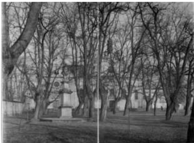
Obrázek č. 1: Prostranství před kapucínským klášteřem, historický snímek