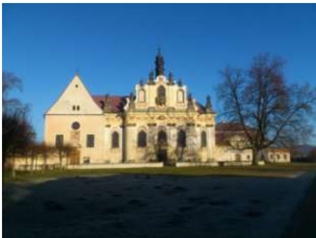
Obrázek č. 6: Kapucínský klášter