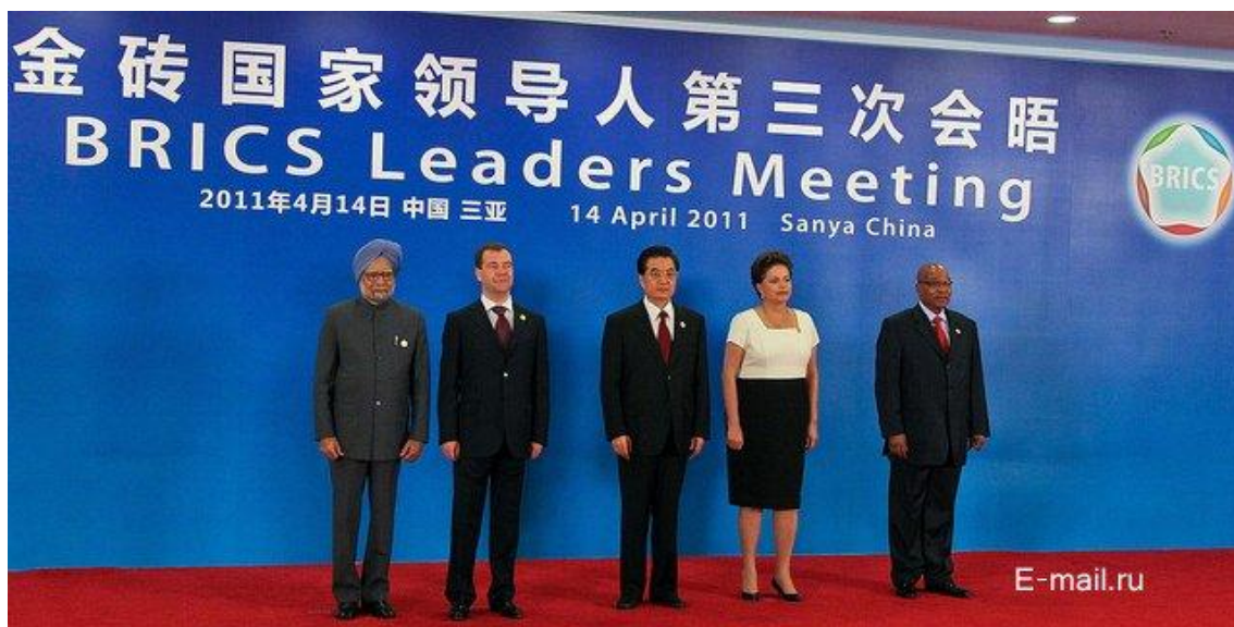
Příloha 12: Poslední summit zemí BRICS v Sanye 2011

( http://e-mail.ru/ekonomika/1568-ministr-finansov-rf-rasskazal-ob-itogah-vstrechi-stran-brics.htm )