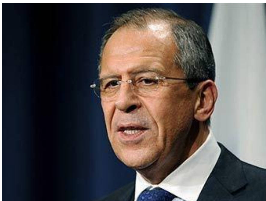
Příloha 6: Sergej Viktorovič Lavrov – ministr zahraničí Ruské federace

( http://lenta.ru/news/2011/05/23/fatahamas/ )