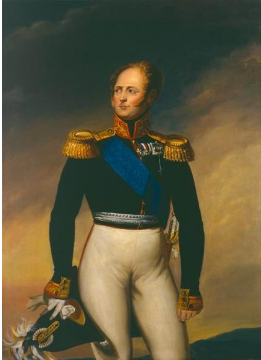
Příloha 2: Car Alexandr I.

( http://www.museum.ru/alb/image.asp?19317 )