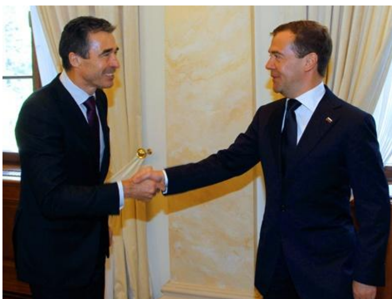
Příloha 17: Generální tajemník NATO Aders Rasmussen a ruský prezident Dmitrij Medveděv na summitu Rady Rusko-NATO v Lisabonu 2010

( http://vlajky-statu.luksoft.cz/ostatni/vlajka_nato.php )