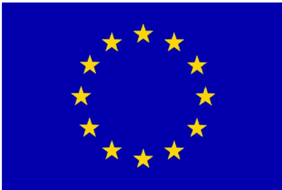
Příloha 18: Vlajka EU

( http://www.vlajkyatisk.cz/vlajky/eshop/14-1-Zeme-EU )