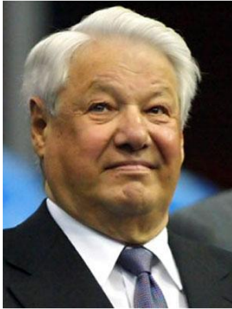
Příloha 3: Boris Nikolajevič Jelcin – první prezident Ruské federace (1991-1999)