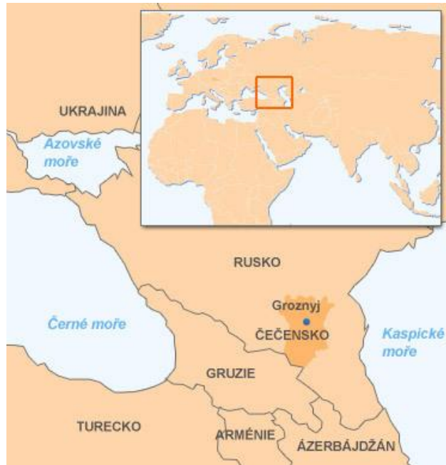
Příloha 14: Poloha Čččenka

( http://aktualne.centrum.cz/zahranici/evropa/clanek.phtml?id=635216 )