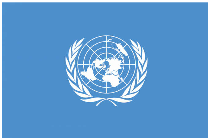
Пříloha 7: Vlajka OSN

( http://www.vlajky-statu.cz/vlajka_nahled.php?id_vlajka=274&rozmer=1100 )