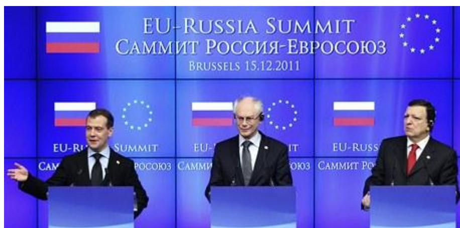
Příloha 19: 28. summit EU-Ruska (Dmitrij Anatoljevič Medveděv, Herman Van Rompuy, José Manuel Barroso)

( http://www.vlajkyatisk.cz/vlajky/eshop/14-1-Zeme-EU )