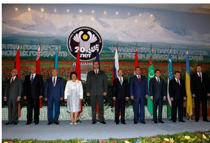
Příloha 10: Setkání představitelů států SNS při oslavě 20. založení SNS v Dušanbě 2011

( http://www.mfgs-sng.org/mfgs/smi/417.html )