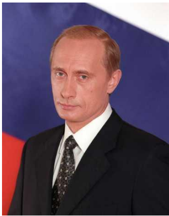
Příloha 4: Vladimir Vladimirovič Putin – prezident Ruské federace (2000-2008, 2012-?)