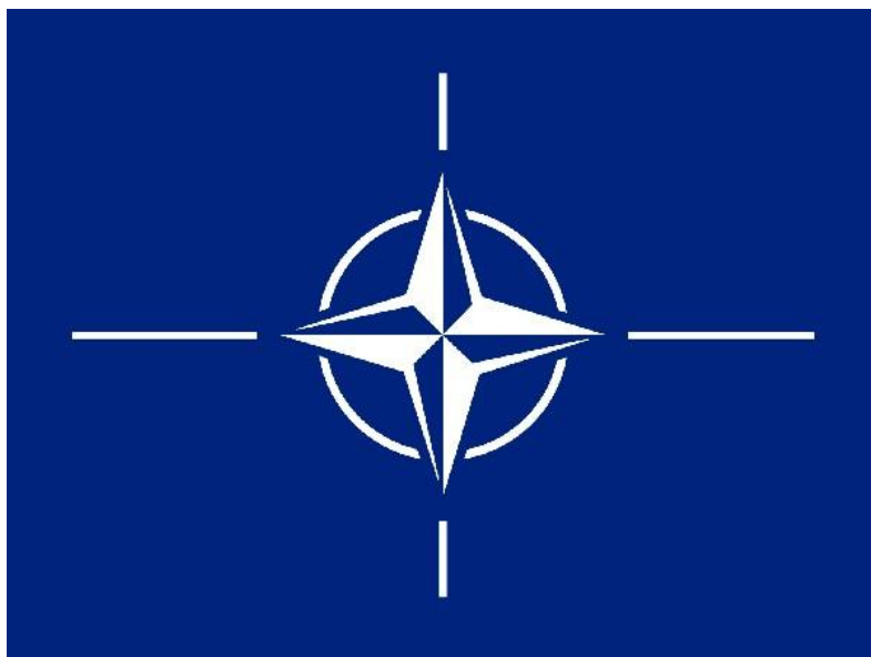
Příloha 16: Vlajka NATO

( http://vlajky-statu.luksoft.cz/ostatni/vlajka_nato.php )