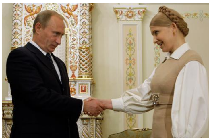
Příloha 11: Uzavření dohody o dodávkách plynu do Ukrajiny v roce 2009

( http://www.e-cis.info/page.php?id=19688 )