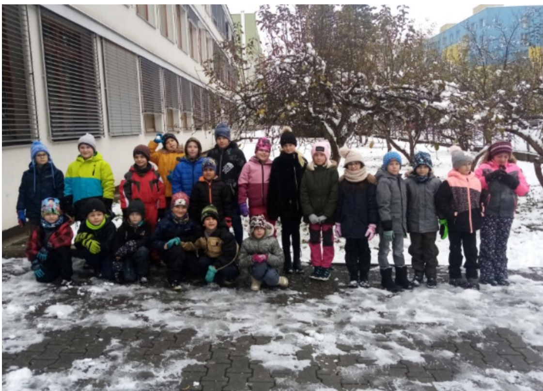
Obr. 16. Všichni účastníci

na otázky, některé měly horší výhled na jednotlivé suroviny, které jsem zde nachystala, a také nemohly všechny vykonat veškeré aktivity, jako je míchání, odměřování surovin nebo nakonec i úklid. Koule si ale zvládly vyzkoušet všechny, neboť hmoty bylo opravdu dost. Děti tvořily více koulí, jejichž kvalita byla různá, přesto bylo jejich nadšení veliké. Všechny také tvrdily, že tuto práci nikdy nedělaly. Některým dětem se nelíbil pach loje, ale i tak do hmoty sáhly a tvořily. Nevýhodou byla výška pracovního stolu, takže měly horší přístup k materiálu. Z tohoto důvodu byla více znečištěna pracovní plocha i podlaha.