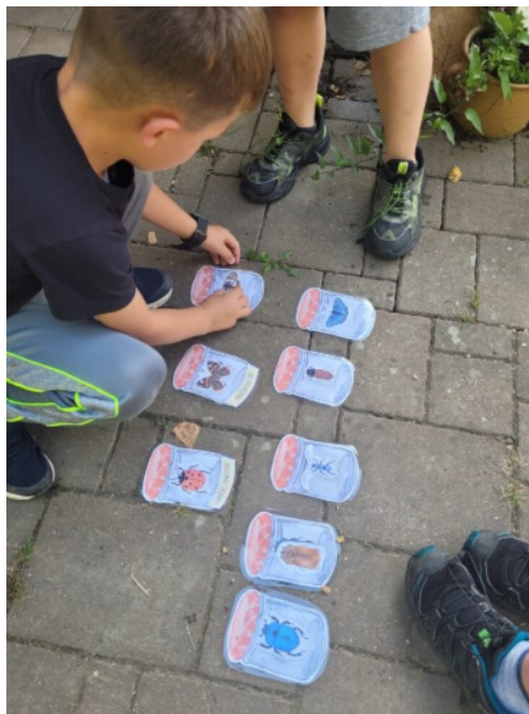
Obr. 10. Hra o hmyzu

Děti byly rozděleny do tří družstev, každá skupina dostala stejný počet „lahví“ se stínem hmyzu. Z hromádky měli za úkol vybrat si svůj hmyz a název. K tomu jim pomáhaly plakátky, které byly umístěny o kousek dále, kam si měly doběhnout a zhodnotit správnost svého odhadu (obr. 11).