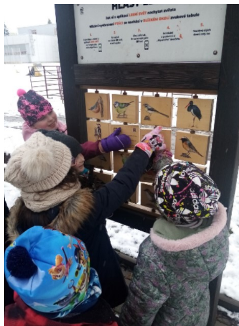
Obr. 15. Zastávka u naučné tabule

Po příchodu do družiny dostaly děti poslední úkol. K předkresleným „smajlíkům“ měly dokreslit usměvavé nebo mračící se pusinky. Před touto aktivitou jsem je upozornila, že obličejík dokreslí dle toho, zda aktivita splnila cíl našeho programu, a to vyrobí lojové koule a zda se dozvěděly něco nového o ptácích.