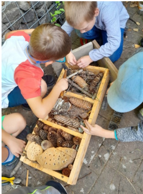
Obr. 8. Tvoření hmyzího hotelu

Před domem byly nachystány tři kostry hmyzích hotelů, dále přírodniny, pletivo, dvě kladívka a kleštičky, hřebíčky. Děti se rozdělily do tří skupin dle vlastní volby. Zde nastal trošku problém, protože se nemohly dohodnout. Nakonec jsme udělaly dvě skupiny chlapců (obr. 9) a jednu dívek. Každá skupina dostala za úkol vytvořit svůj hotel pro hmyz. Dívky to pojaly velmi esteticky, a tak jsme jim musely vysvětlit, že hmyzu by se květiny líbily, ale asi potřebují více vyplnit prostor dřívky, šiškami a mechem. Adélka se rozčilovala, že jí se to takto nelíbí.