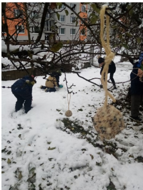
Obr. 14. Instalace koulí v zahradě

V další části programu jsme šli na procházku, nejprve jsme zavěsili v zahradě několik semínkových koulí a plněných květníků (obr. 15) tak, aby na ně děti viděly z oken družiny. V další části procházky jsme si prošli naučnou stezku kolem Jizery, kde je na jedné ze zastávek tabule s různými druhy ptáků. Zde jsme se ještě zastavili a ukázali si ty nejnámější druhy (obr. 16).