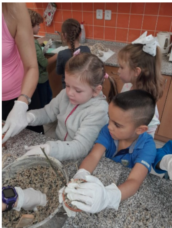
Obr. 13. Tvoření lojových koulí

V další části se děti rozdělily do dvou skupin, poté společně promíchaly teplý lůj s částí směsi. Vysvětlila jsem jim postup tvorby koulí z loje, které budou buď s provázkem na zavěšení, nebo bez provázku na položení do krmítka a také jakým způsobem naplníme květníky (obr. 14).