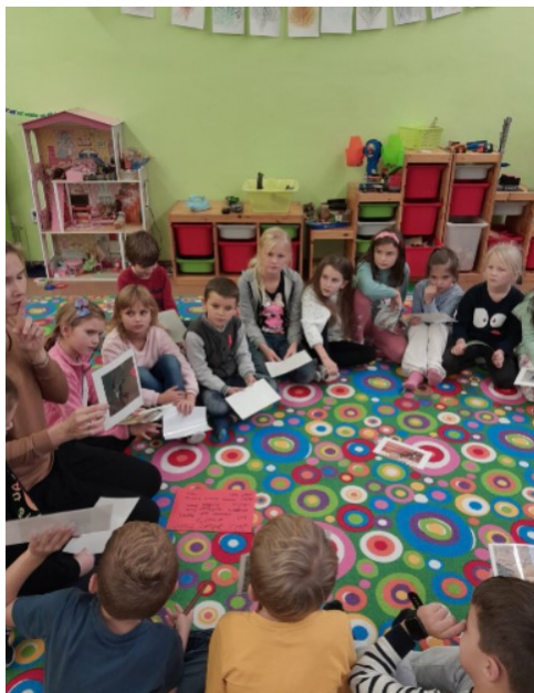
Obr. 11. Povídání o ptácích

Následně jsem do kruhu dala obrázky nejznámějších druhů ptáků, děti si vybraly obrázek. O některých druzích jsme si opět pověděli jeho název a zajímavost (obr. 12). Rozdělili jsme ptáky na ty, kteří nežijí na našem území (kolibřík, tučňák, pštros), na tažné ptáky a na ty, kteří zde zůstávají přes zimu. Děti poznaly ty nejznámější druhy, jako jsou kos, vrabec, datel, čáp, pštros, tučňák, vlaštovka. Například žlunu děti znaly z pozorování, ale neuměly ji pojmenovat.