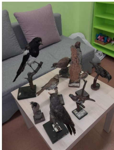
Obr. 12. Výstava ptáků