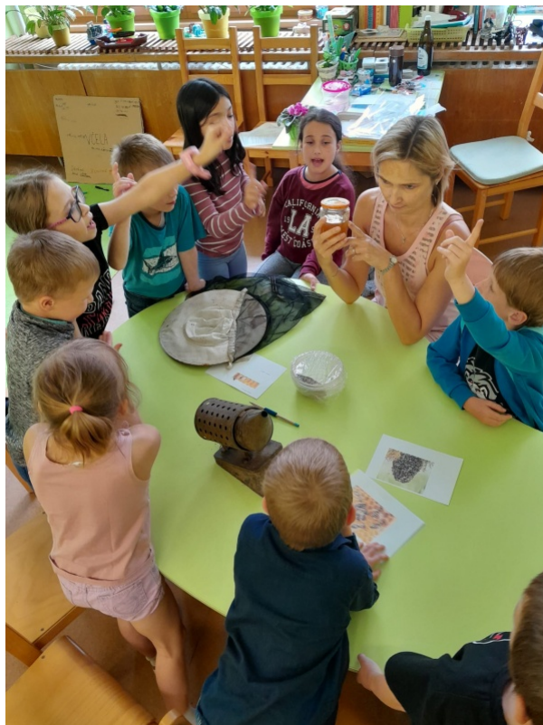
Obr. 1. Prohlídka reálných předmětů

dala přivonět, ohmatat a děti opět hádaly, z jakého je materiálu (vosk) a co z tohoto materiálu lze ještě vyrobit (svíčka).