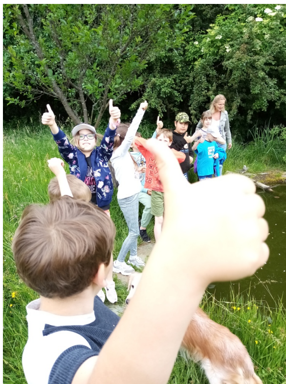
Obr. 5. Hodnocení od dětí

Vyhodnocení cílů: Projekt splnil všechny mnou zadané výchovné cíle, děti dokázaly samy dle ukázky vytvořit další včelí napajedla, samy se při práci domlouvaly, hledaly v zahradě materiál na zdobení a výrobu, také znají několik informací o včele, kterou bez problémů rozeznají od jiného hmyzu. Cíle byly stanoveny správně. Nové informace byly opakovány tak, aby si děti získané znalosti zvládly zapamatovat. Příjemné bylo ocenění od dětí (obr. 5).