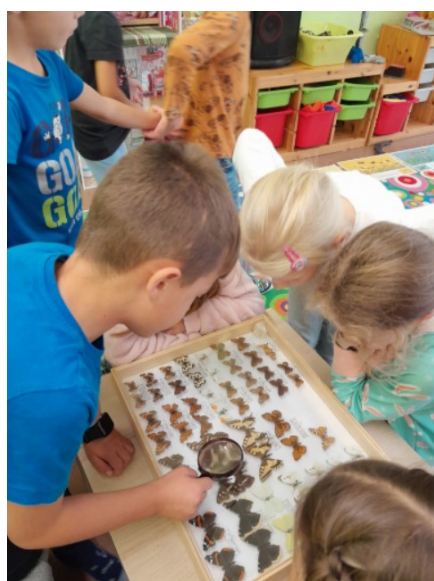
Obr. 8. Prohlížení exponátů

Po skončení prohlídky jsme ještě na připravené desky doplnili některé vlastnosti hmyzu – je malý, velký, špičatý.