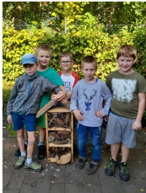
Obr. 9. Hotel vytvořený chlapci

Děti postupně vyplnily hotely přírodninami a každá skupina si ustříhla svoji část pletiva a na přední stranu ji přitloukla hřebíčky. Všem dětem se líbilo pracovat s kladívky, některé pracovaly pěkně, některým se úplně nedařilo, ale všichni si měli možnost vyzkoušet