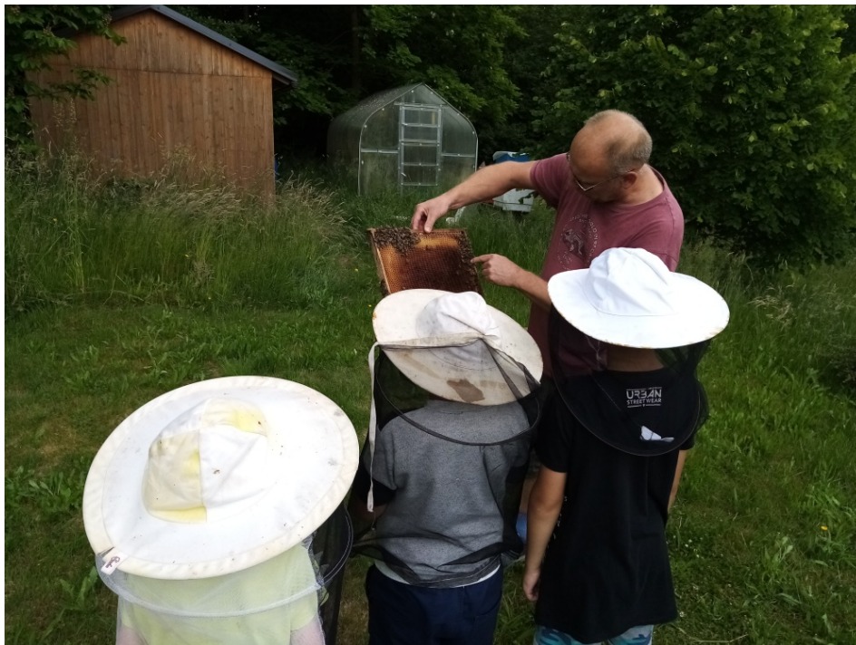
Obr. 3. Včelař ukazuje plástve