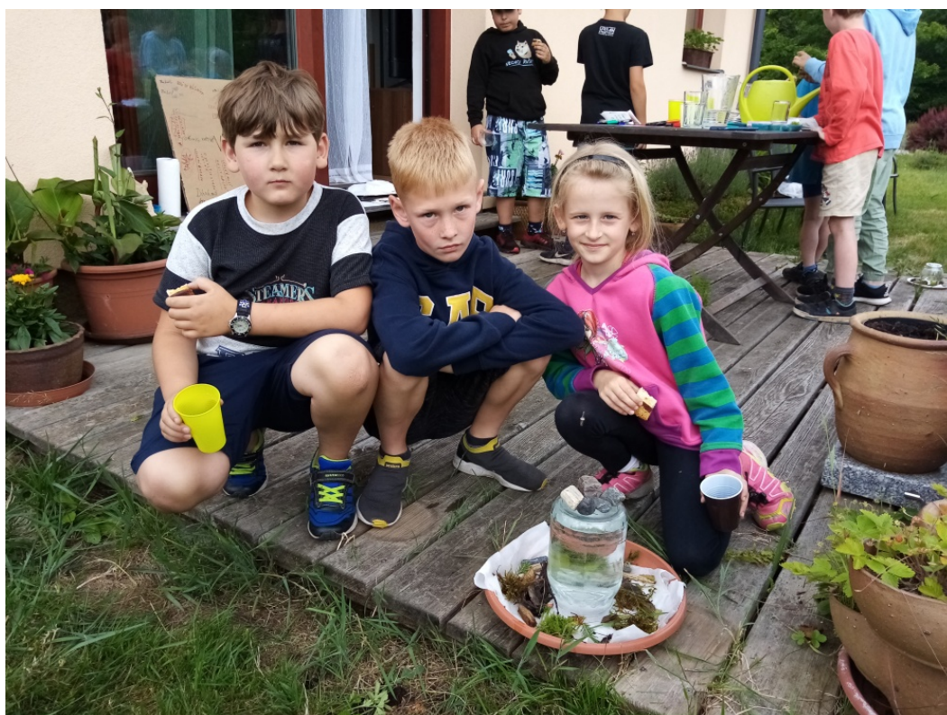
Obr. 4. Včelí pítko

Další aktivitou bylo vyrábění píttek. Dětem jsem ukázala, jak vypadá hotové pítko, velké sklenice jsem naplnila vodou a „otočila“. S menšími sklenicemi děti pracovaly samy. Pítka byla rychle hotová, a tak jsme s paní vychovatelkou děti pochválily. Děti na zdobení použily mnou přichystaný materiál, ale také to, co v zahradě našly (obr. 4). Poté jsem dětem rozdala tabulky, kde doplnily druhý sloupek dle zadání. Nabídla jsem jim malé občerstvení, které mělo úspěch.