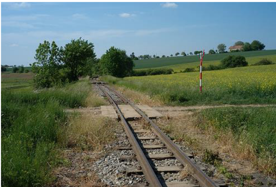
OBR. 4 MUZEJNÍ UZKOKOLEJNÍ TRATĚ