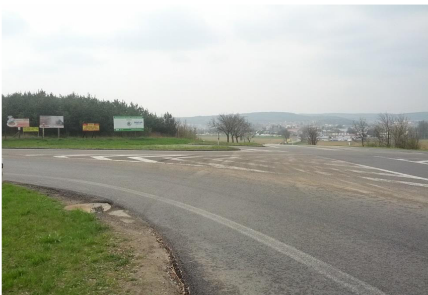
OBR. 2 STYKOVÁ KŘÍŽOVATKA SMĚR ROSICE, TETČICE,