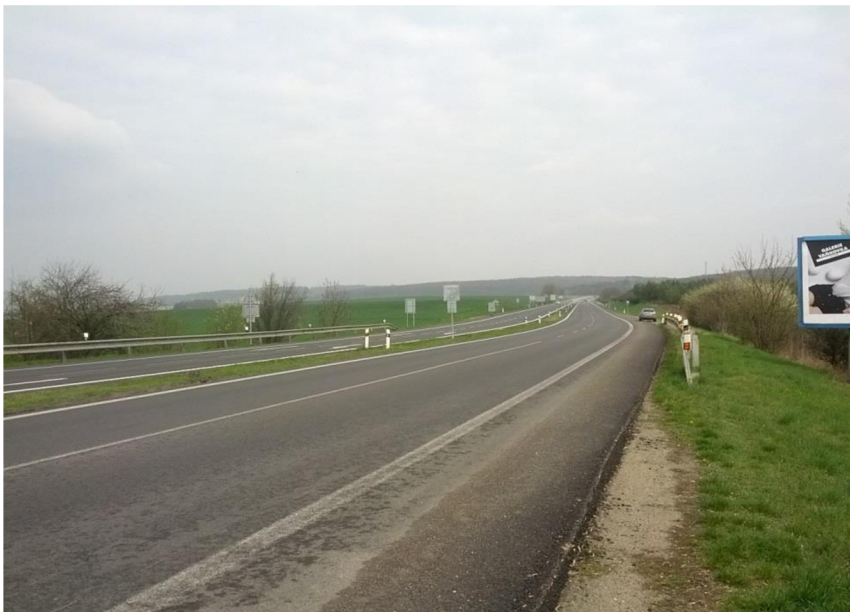
OBR. 1 - PŘÍJEZD PO S I/23 DO ROSIC, POHLED SMĚREM NA BRNO