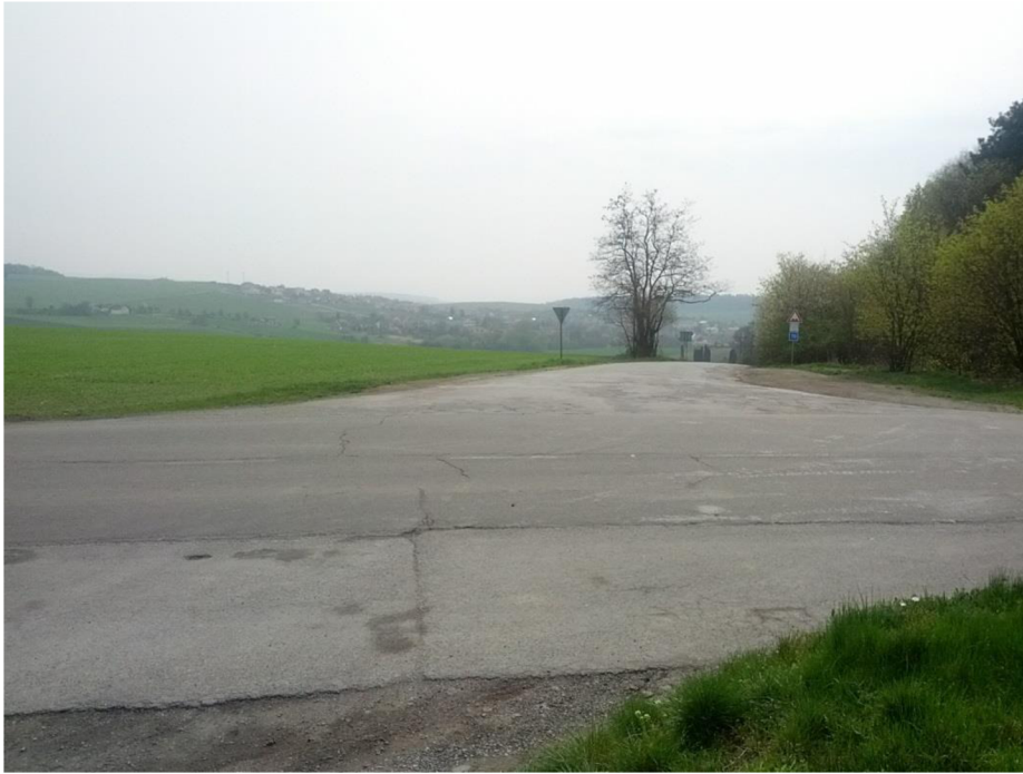
OBR. 3 MÍSTO NAPOJENÍ NA STÁVAJÍCÍ KOMUNIKACI I/23 KÚ