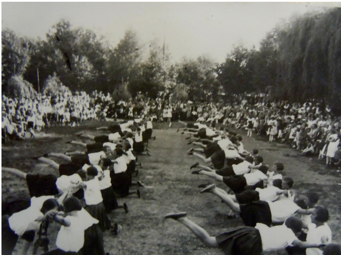
SOKA Přerov, fond Základní škola Tovačov. Inventární číslo: 2.