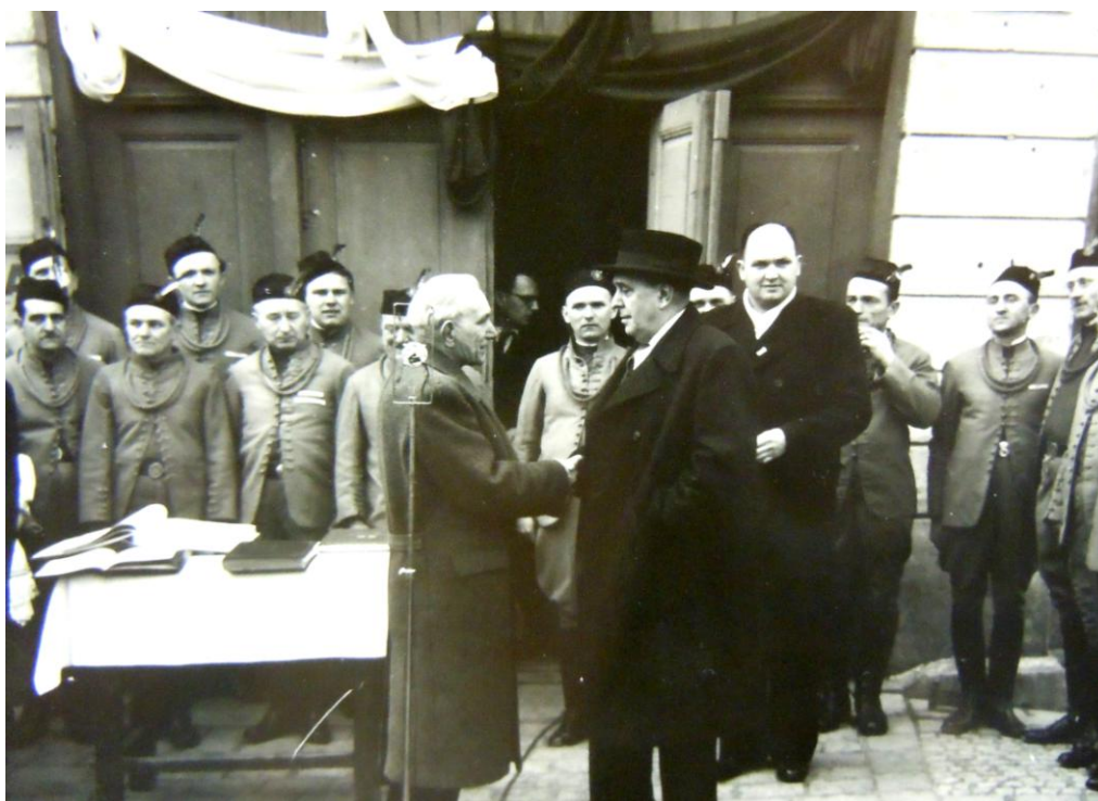
SOKA Přerov, fond Základní škola Tovačov. Inventární číslo: 3.