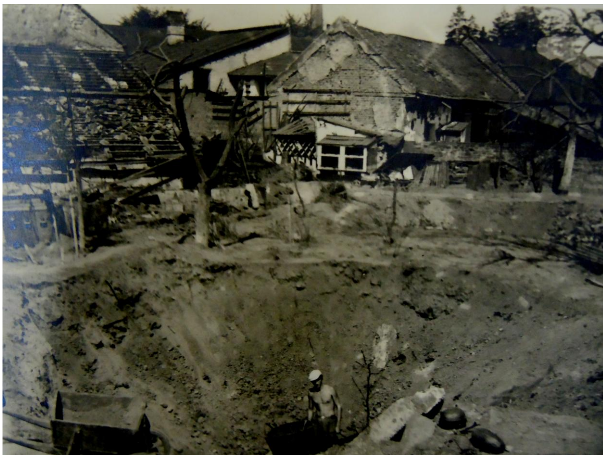
SOKA Přerov, fond Základní škola Tovačov. Inventární číslo: 3.