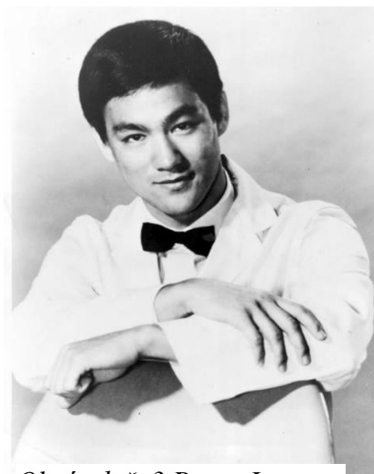
Obrázek č. 3 Bruce Lee

Bruce Lee je považován za světově nejslavnějšího umělce a popularizátora bojových umění, díky kterému se proslavil i na filmovém plátně. Svou hereckou prací ovlivnil natáčení a zviditelnil se prostřednictvím akčních filmů. Krátce po své smrti se stal legendou a dodnes je znám jako nejvlivnější osobnost bojových umění 20. století. Zkrátka každý se mohl na vlastní oči přesvědčit, že se jedná o zdařilé filmy plné akčních scén. Jeho filmy způsobily silnou vlnu nadšení k bojovému umění v éře 70. let. Tato éra přetrvala až dokonce 90. let. Velkou většinu mladých lidí ovlivnily filmy, kde vystupoval, a i proto se mladá generace začala věnovat bojovým uměním. Lidé se snažili napodobit jeho styl, pohyby, a dokonce i jeho zvuky. 30