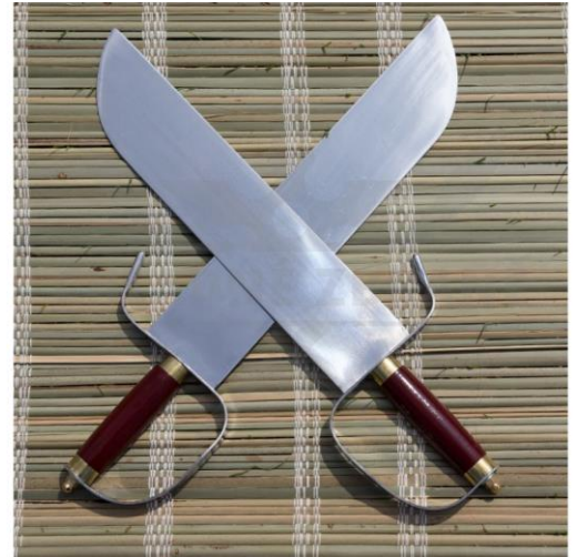
Obrázek č. 1 Motýlí meče

V tradičním systému Wing Tsun se využívají pouze dvě zbraně: zhruba 4 metry dlouhá tyč, která se používala k odrážení loděk od břehů, a pak dvojice krátkých mečů. Vzhledově se jeví jako šavle, ale známe je spíše pod názvem „motýlí meče“. Tento název byl odvozen od vzhledu a pohybu těchto zbraní, protože připomínají let motýla. Výuka s motýlími meči se vyučuje v pokročilejších stádiích výuky. Máloukterá zbraň se s nimi dá srovnávat. 22