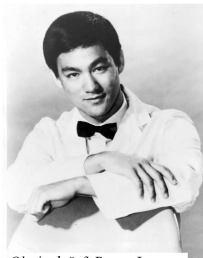
Obrázek č. 3 Bruce Lee

Bruce Lee je považován za světově nejslavnějšího umělce a popularizátora bojových umění, díky kterému se proslavil i na filmovém plátně. Svou hereckou prací ovlivnil natáčení a zviditelnil se prostřednictvím akčních filmů. Krátce po své smrti se stal legendou a dodnes je znám jako nejvlivnější osobnost bojových umění 20. století. Zkrátka každý se mohl na vlastní oči přesvědčit, že se jedná o zdařilé filmy plné akčních scén. Jeho filmy způsobily silnou vlnu nadšení k bojovému umění v éře 70. let. Tato éra přetrvávala až dokonce 90. let. Velkou většinu mladých lidí ovlivnily filmy, kde vystupoval, a i proto se mladá generace začala věnovat bojovým uměním. Lidé se snažili napodobit jeho styl, pohyby, a dokonce i jeho zvuky. 30