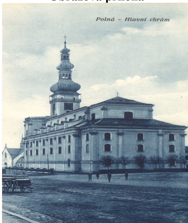
Obr.20 Chrám K.Hladký kolem roku 1918 pohled jihovýchodní Obr.21 Pohled na jihozápadní část chrámu z roku 1983