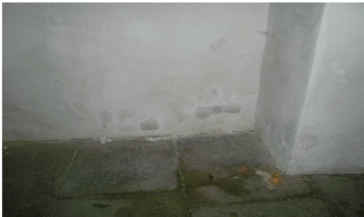
Obr.15 Vzlínající vlhkost u západního vchodu do kostela 2011