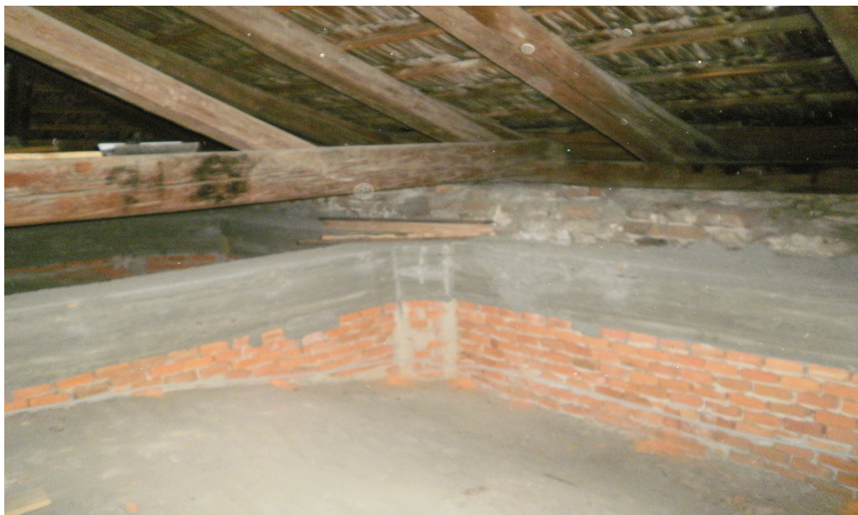
Obr.13 Nadezdívka obvodových stěn držících klenbu již po vyztužení s žb.věncem, patro nad sakristií pohled vrchní z roku 2011