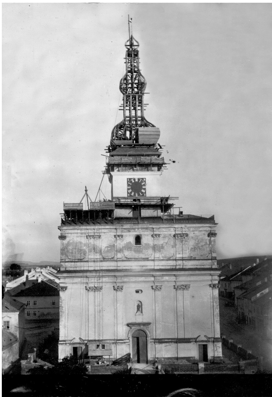
Obr.5 Stavba věže 1894

Dne 18. července se v chrámu konaly slavné služby Boží a hned nato započala stavba.(Obr.5)