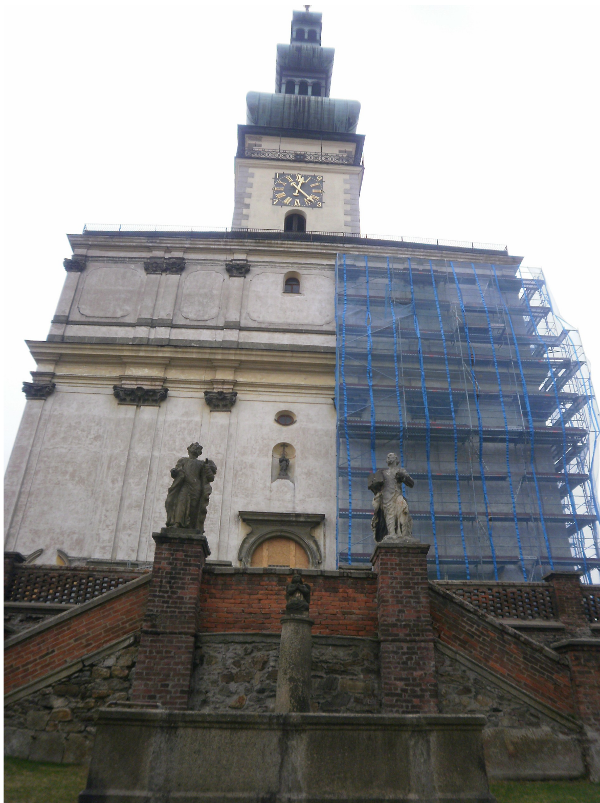
Obr.26 Pohled na západní část chrámu s lešením 2011