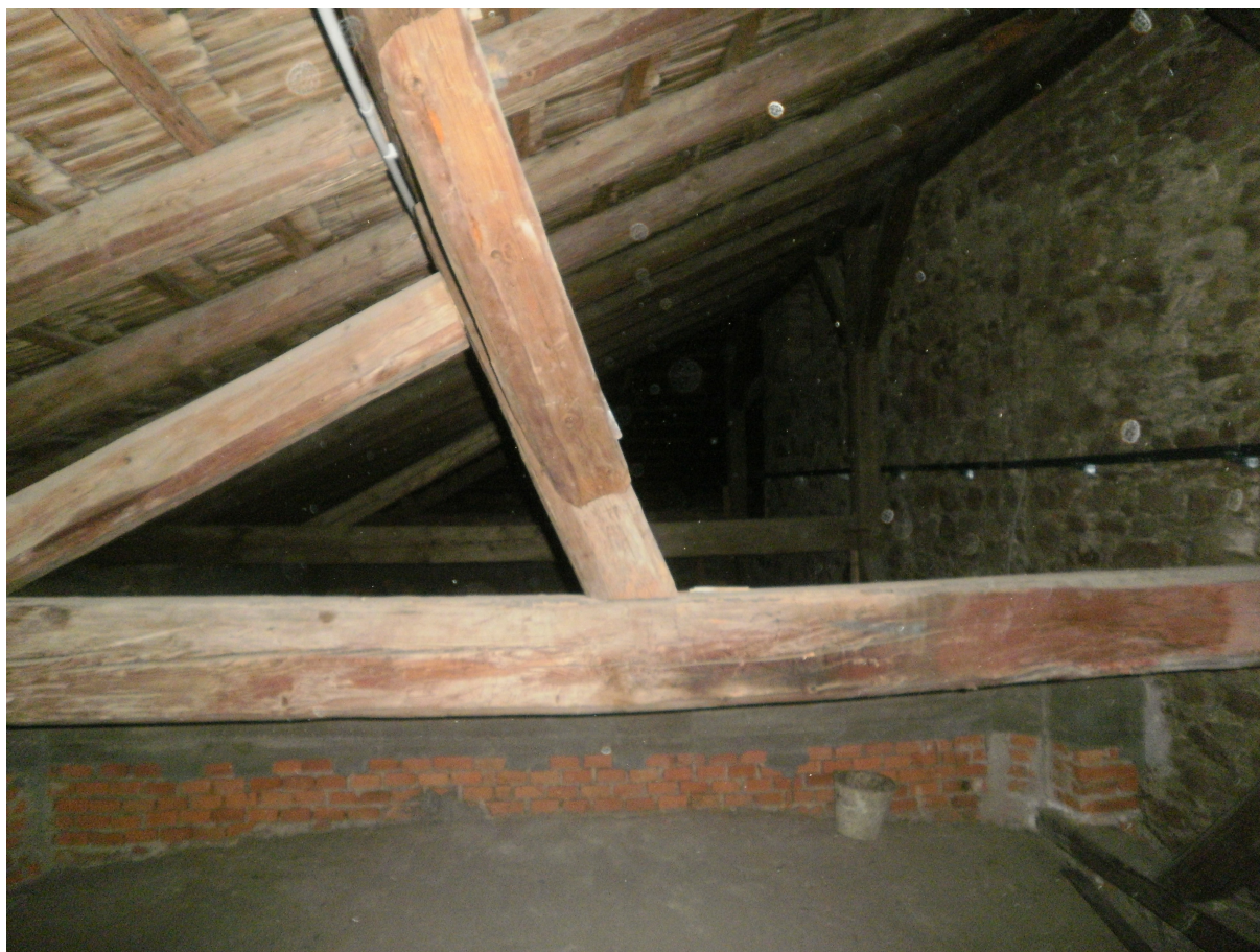
Obr.14 Nepůvodní krov nad sakristií s prohnutím trámu způsobeného předešlým nadměrným zatížením blidlicovou krytinou, foto z roku 2011