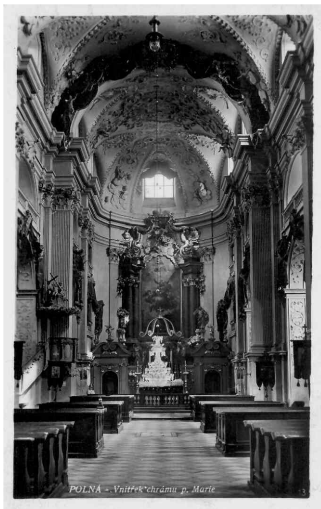
Obr.10 Interiér, pohlednice z roku 1932

Polenský hlavní kostel měří na délku 63,53 m, na šířku 26,54 m a sahá do výšky 22,12 m. Věž je vysoká 63,5 m. Valená klenba s lunetami hlavní lodi apresbytáře je velmi bohatě zdobena jak ornamentálně, tak i figurálně – akanty, listovci, kartušemi, záclonami a oblaky, výzdobu tvoří též andílci a znaky. Strop zdobí nádherná sestava jemných štuk. Stěny a postranní lodi jsou vyzdobeny kanelovanými pilíři, korintskými hlavicemi, členitými římsami a balustrádami. Nad oběma bočními loděmi se nachází empory zaklenuté hřebínkovou klenbou. Součástí obou bočních lodí je celkem 10 oltářních kaplí, které jsou po obou stranách sklenuty pruskými plackami s pásy. (Obr.10)