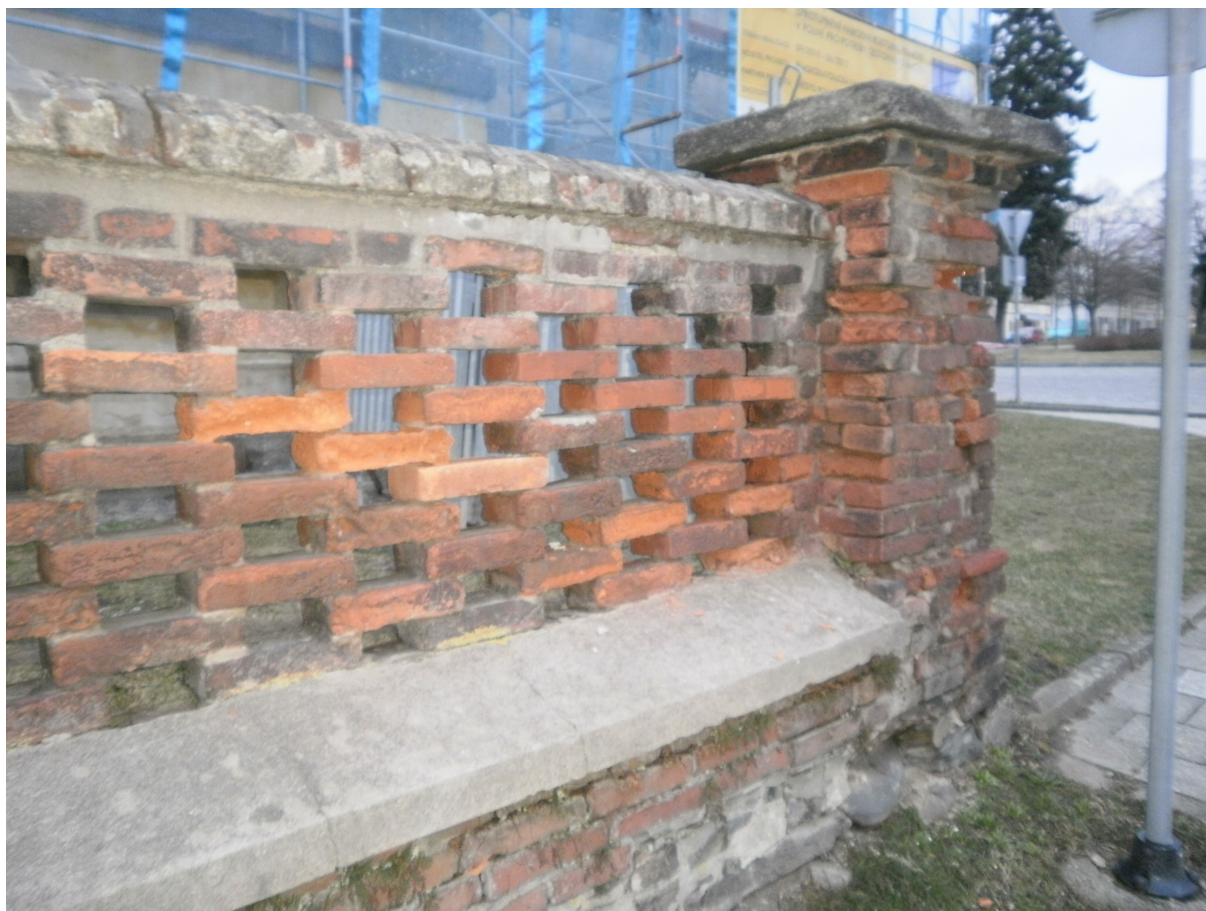
Obr.19 Narušené zdivo lemující kostel.