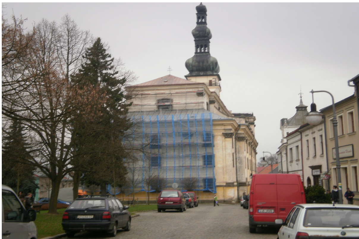
Obr.24 Pohled na chrám z Husova náměstí 2011. Začíná oprava fasády.