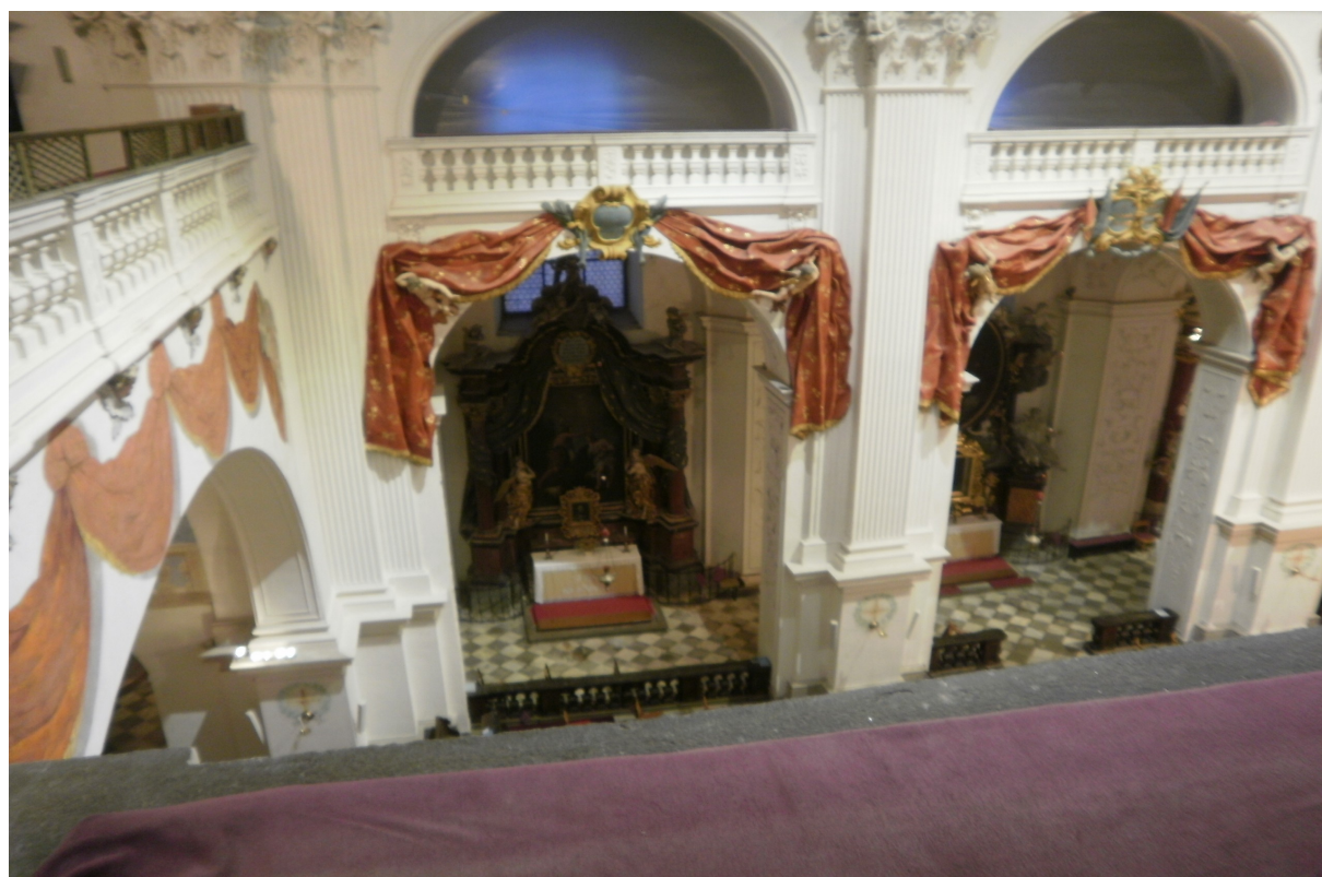
Obr.11 Křestní kaple po opravě vlevo dole na obrázku 2011