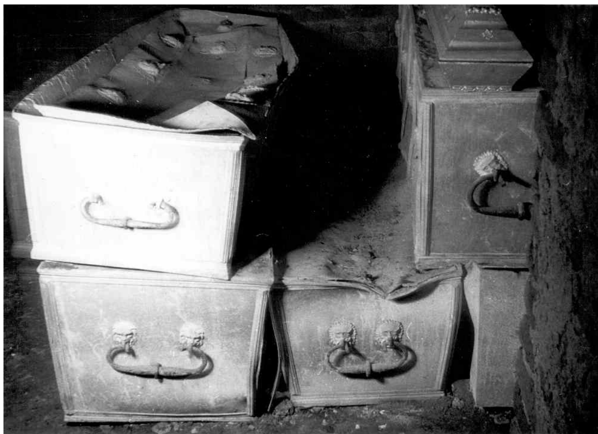
Obr.7 Rakve Žejdliců