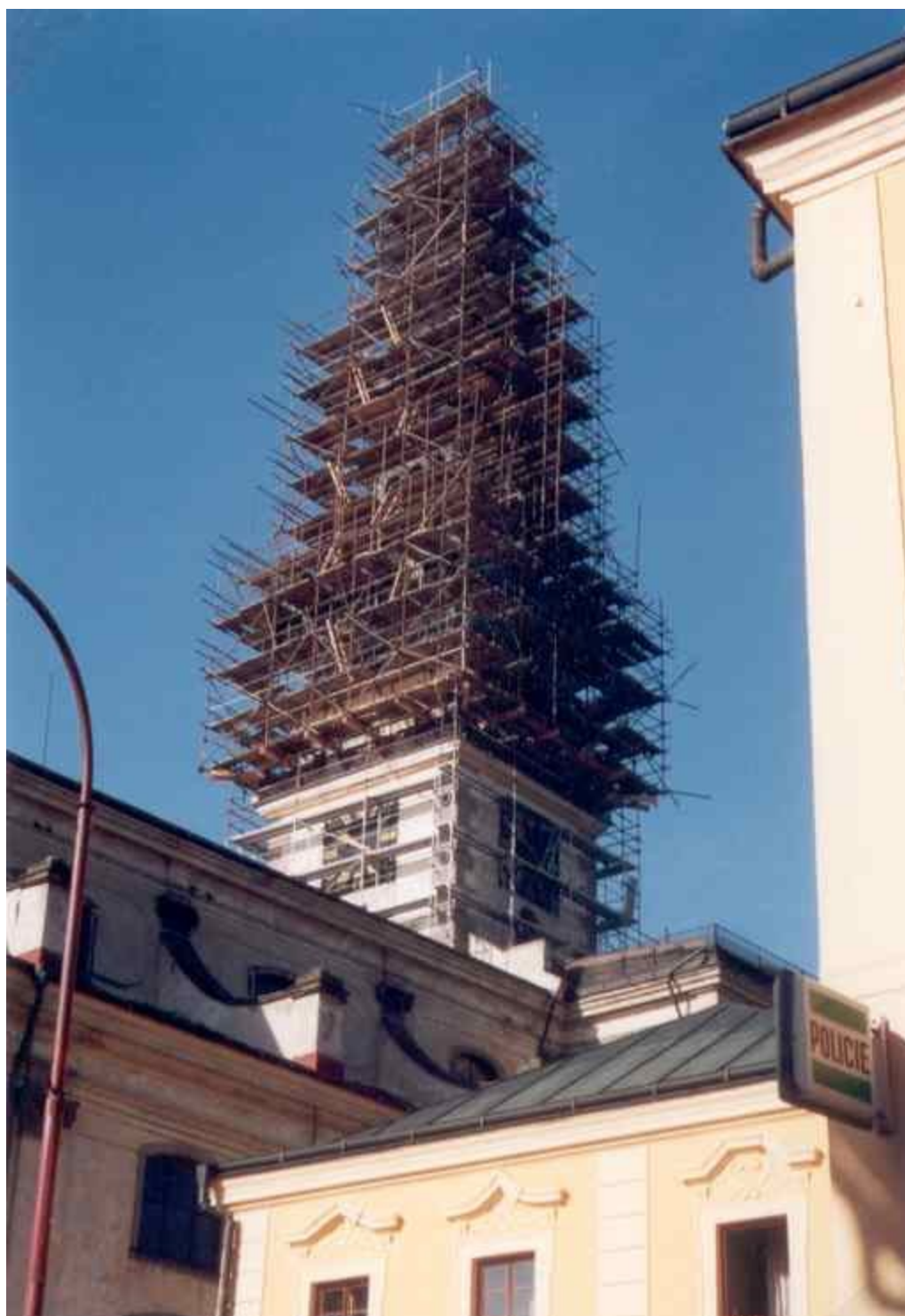
Obr.27 Oprava věže pohled od děkanství a kaplanky 2001