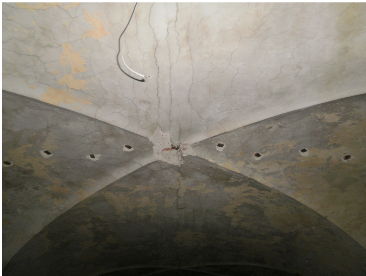
Obr.12 Praskliny v klenbě, navrtné otvory na zavěšení klenby, pohled spodní z roku 2011