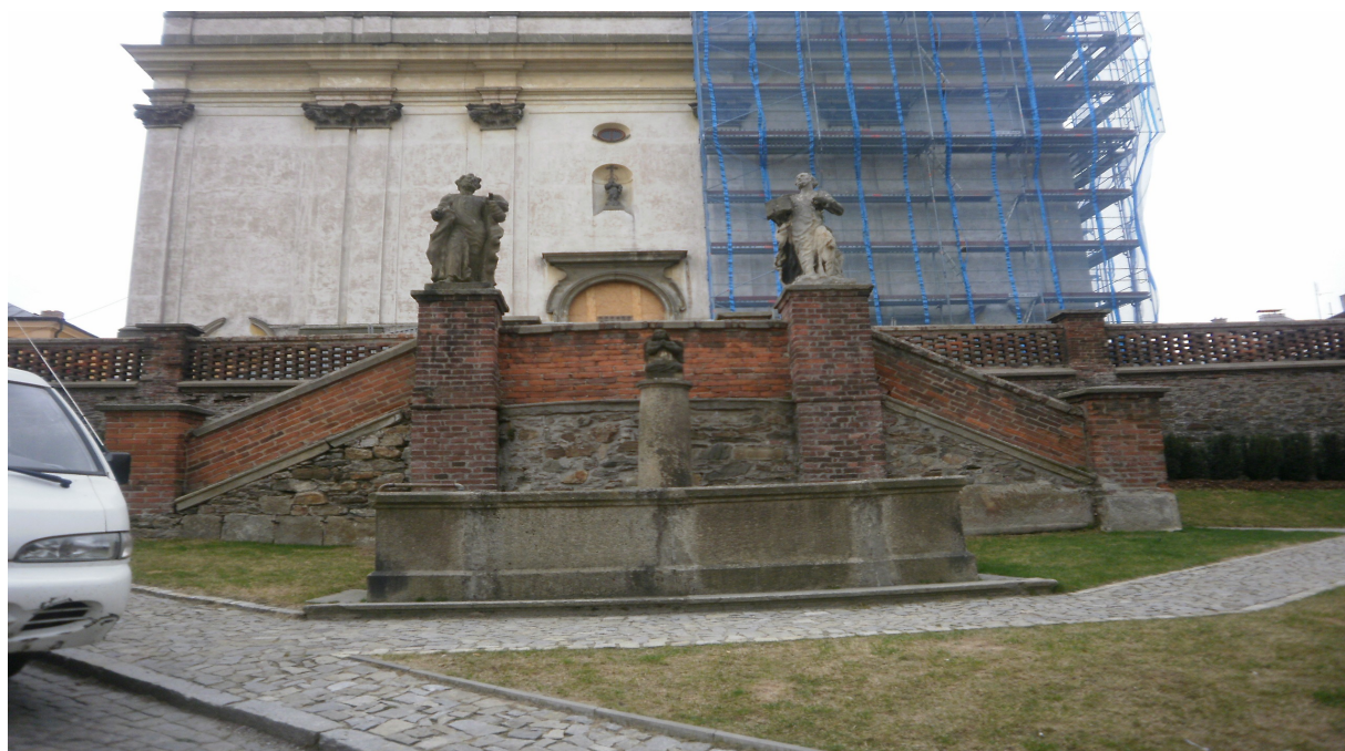
Obr.25 Pohled na schodiště a okolí před hlavním vstupem do chrámu 2011