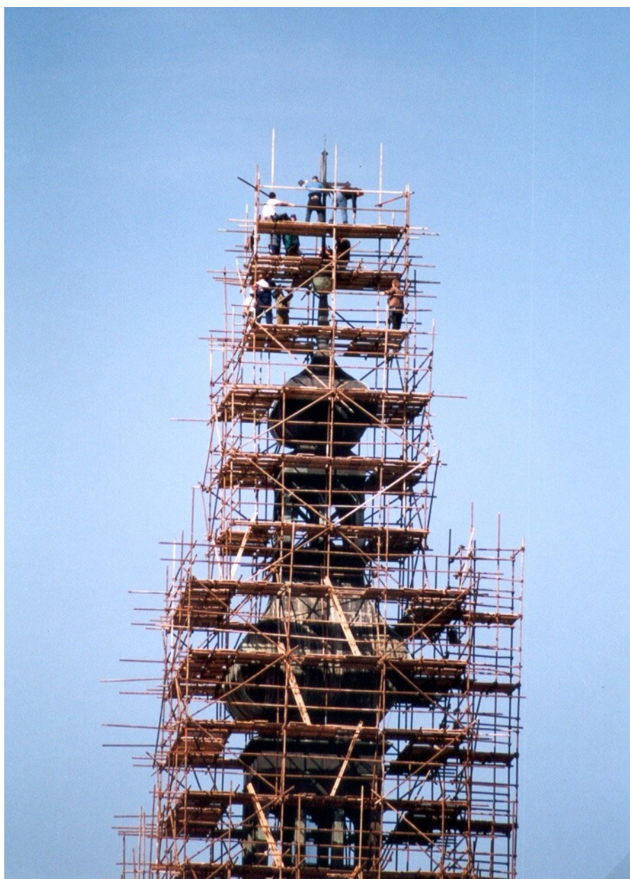
Obr.8 Oprava věže 2001

Z vrcholu věže byl sejmут kříž včetně makovice, která ukrývala tubusy z roku 1895 s různými doklady té doby. Po zrestaurování byl kříž s nově pozlacenou makovicí vrácen na původní místo. Do makovice bylo vloženo pět tubusů s původními a novými doklady a Zprávou budoucím pokolením.