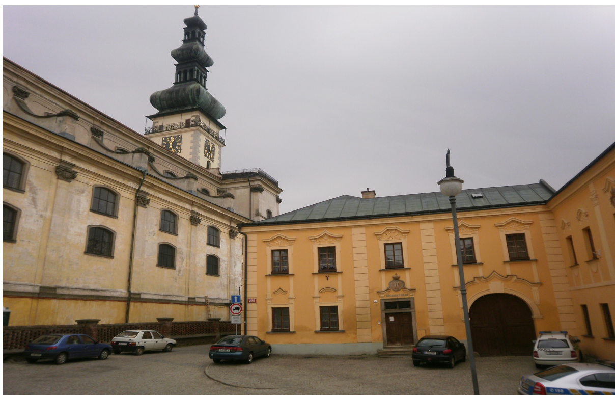
Obr.22 Pohled severovýchodní na chrám a děkanství 2011