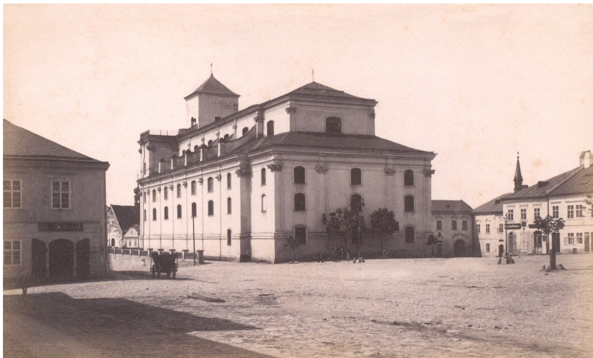
Obr.4 Chrám bez věže 1885