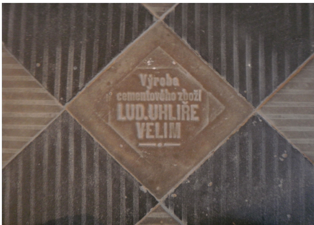
Obr.18 Cementová dlažba v bočních ambitech se signaturou výrobce, foto z roku 2011