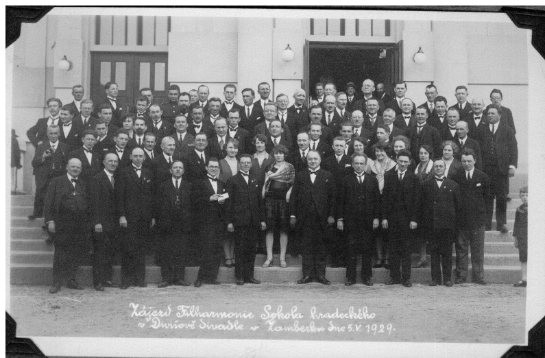
Obr. 1: Filharmonie Sokola Hradec Králové v Žamberku

Jak dokládá fotografie obr. 1, sokolská filharmonie vyrazila 5. května 1929 do Žamberka, aby odehrála v Divišově divadle koncert.