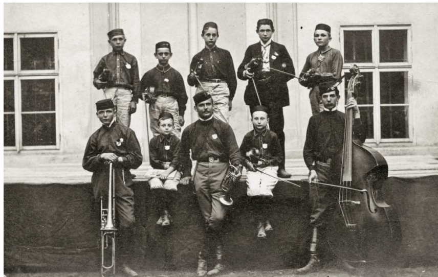
Obr. 3: Trubačský sbor jednoty Zbraslav 1910