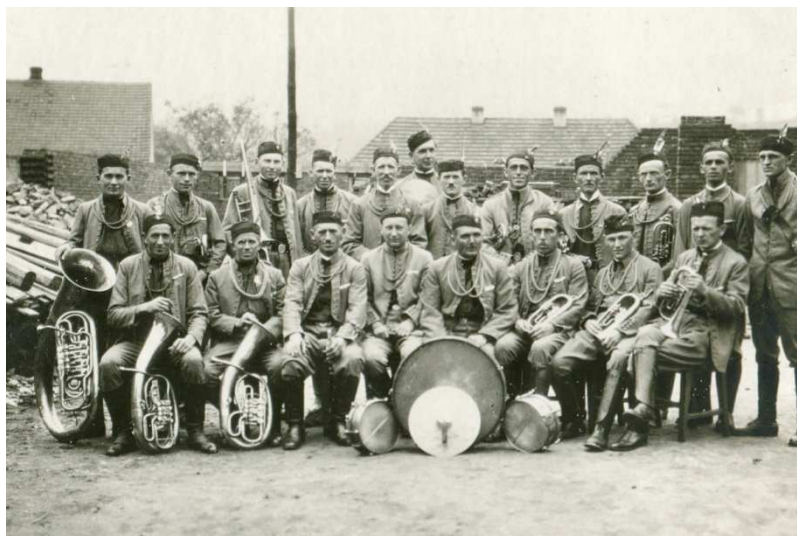
Obr. 4: Trubačský sbor při kladení základního kamene sokolovny

Rok 1929 byl v činnosti trubačského sboru asi nejvýznamnější. Zahájen byl 5 května výletem v krojích do Bojova, Hvozdnic, Masečina a Štěchovic. Pro zpáteční cestu výletníci využili parník. Hojná účast 192 osob svědčila o úspěchu akce. Dne 19. května 1929 se jmenovaný sbor účastní slavnostního výkopu stavby nové sokolovny. Slavnostní položení základního kamene sokolovny proběhlo 11. srpna 1929. Při této příležitosti koncertovaly trubačské sbory Sokola zbraslavského a pražského. 196 Při kladení základního kamene sokolovny měl sbor asi nejvíce vystupujících za celé své období; ten den měl sbor 20 členů, nejen trumpetisty, ale i dva hráče na barytony, tubu, bicí a pozouny. Na této akci byla pořízena fotografie trubačského sboru (obr. 4).