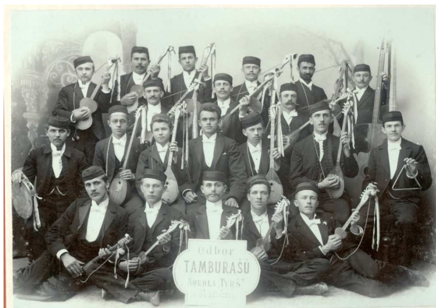
Obr. 5: Tamburašský odbor