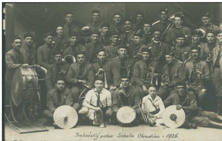
Obr. 2: Trubačský sbor Sokola Chrudim

a činely. Na trumpetě hrálo asi 8 členů, na klarinet 3 členové. Další hudebníci se věnovali hře na baryton a heligón.