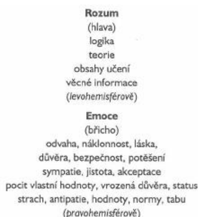
Obrázek č. 1: Učení - rozum a emoce 26

Podle Belze je velmi důležité to, že žáci ve třídě pracují kolektivně, v týmu. Každý člověk je individuální osobností, avšak žije ve složité spleti vztahů se svým okolím, které tvoří jiní lidé. Vztahy jsou velmi důležité, protože člověk nemůže existovat bez koordinace své osoby s okolím. Socializace právě souvisí s tím, že člověk funguje jako součást určitého kolektivu. Učení v týmu, ve skupinách je součástí socializace. Poté, co dítě nastoupí do školy, vystupuje ze své primární skupiny, což je rodina. Dostává se do kontaktu s jinými lidmi a setkává se s novými normami, hodnotami, názory a postoji. Často se setkává s naprosto jinou skutečností, než na kterou bylo dosud zvyklé. Dítě se vyrovnává s novým světem a je důležité, aby začalo proces socializace. Socializující vlivy v dětství a dospívání jsou stěžejní pro rozvoj nebo změnu identity osobnosti. Proto je nutné, aby se dítě vzdělávalo v oblasti získávání prosociálních dovedností v kolektivu. 27