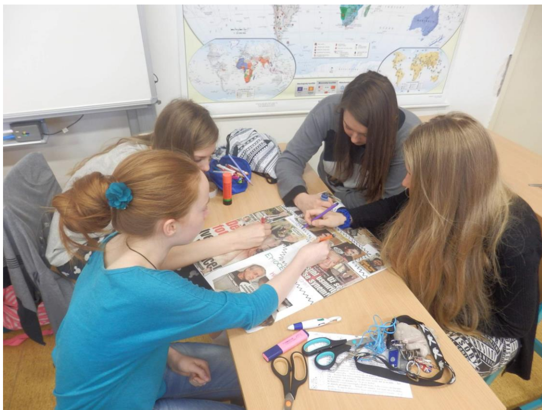
Obrázek č. 4: Fotografie námětu