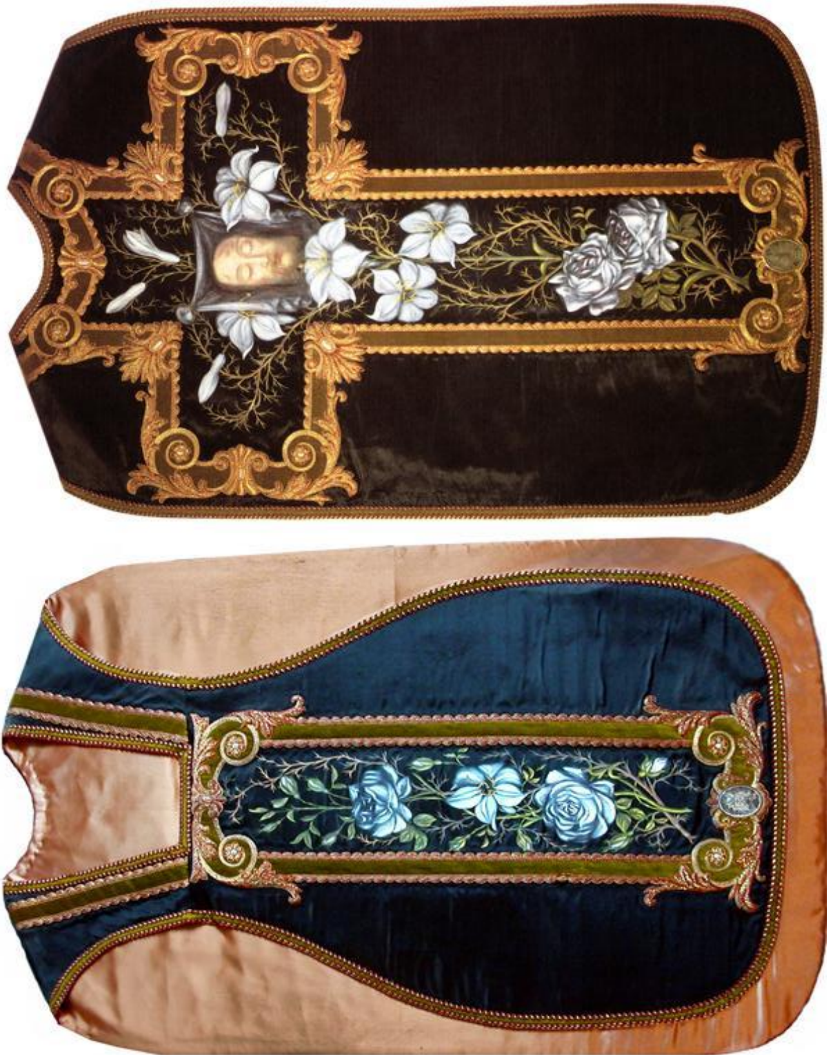
Obraz č. 15: Ornát zdobený Terezií