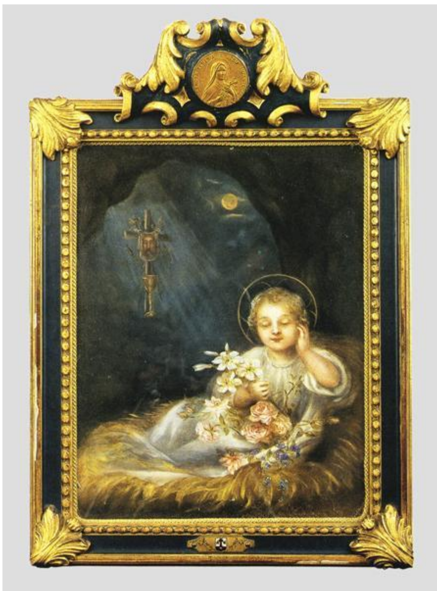
Obraz č. 14: Obraz Ježíškův sen (retušováno Celinou)