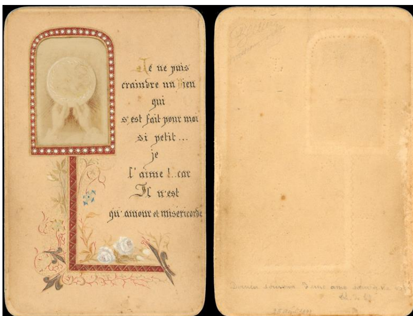
Obraz č. 4: Poslední obrázek namalovaný Terezií