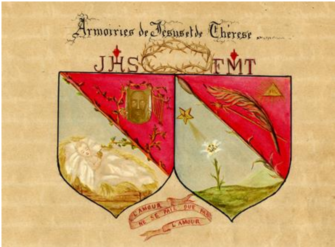
Obraz č. 8: Erby Ježíše a Terezie