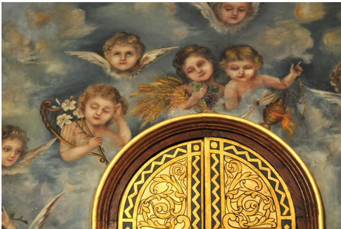
Obraz č. 2: Detail fresky