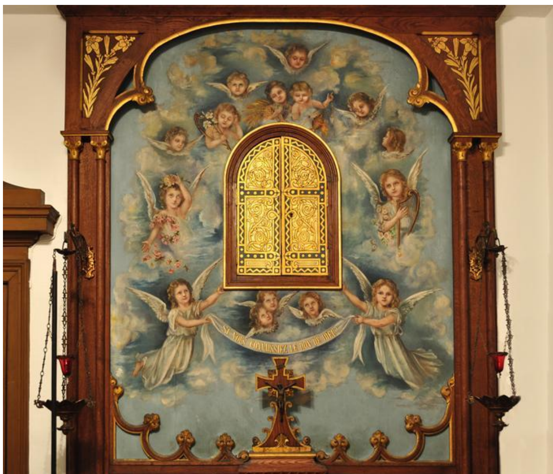
Obraz č. 1: Freska namalovaná Terezií v oratoři nemocných (retušováno Celinou)