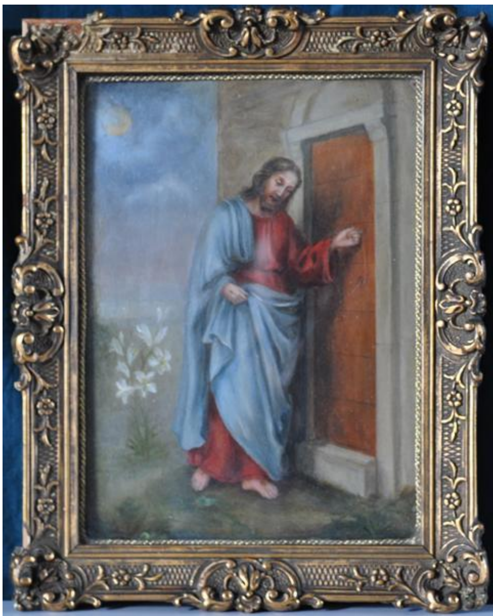
Obraz č. 13: Obraz Ježíš klepající na dveře