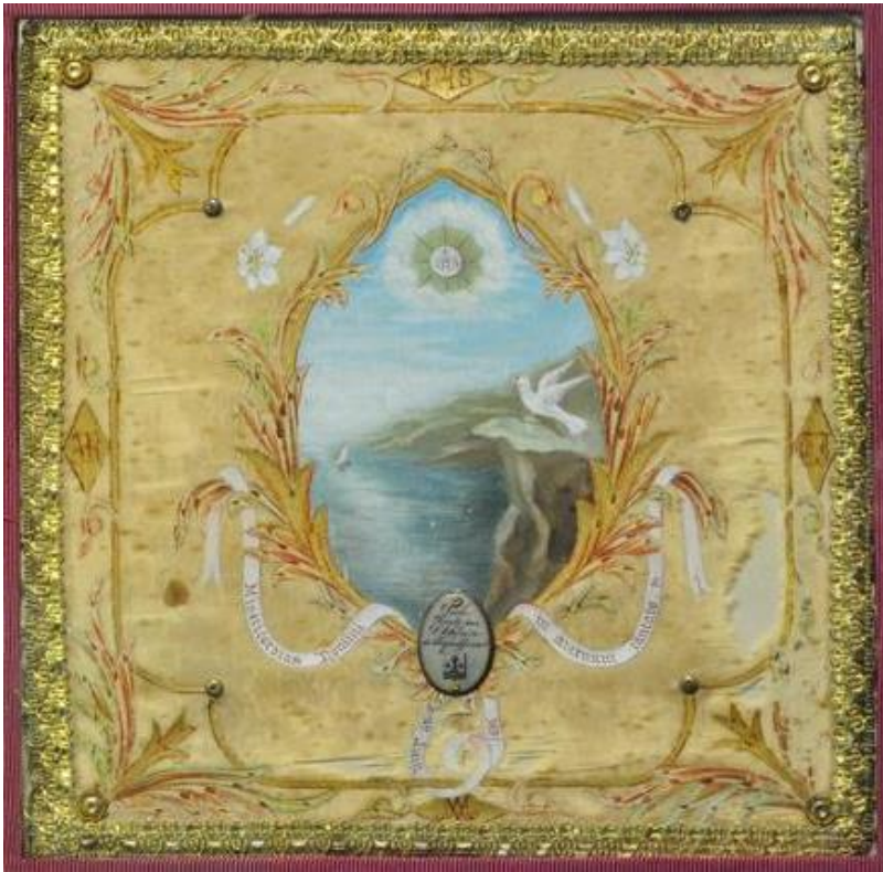
Obraz č. 3: Pala, kterou Terezie ozdobil pro o. Adolfa Roullanda