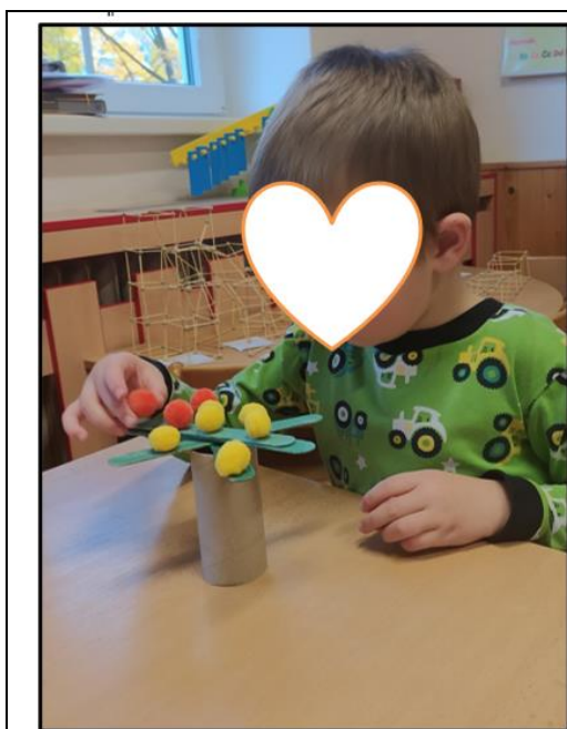
Obrázek 12 Sestavení jabloňky

Odpovědi dětí se pak začaly opakovat a dál se snažily postavit strom tak, aby na něm udržely všechny jablíčka. Poté, co se jim podařilo naskládat všechny dřívka i jablíčka. Jsem dětem vysvětlila, aby to šlo. Musely vytvořit rovnováhu. To znamená, že na obou stranách musela působit stejná síla, aby to nespadlo.