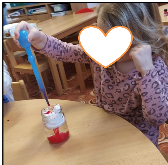
Obrázek 9 Jak vzniká déšť