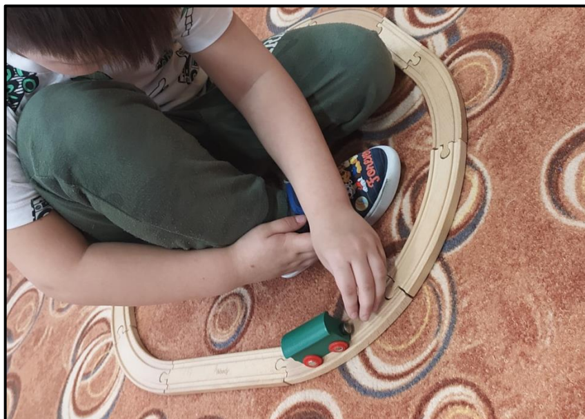
Obrázek 2 Odpudivá síla magnetu

Dívka č. 2: „Jo, buď se ten vláček lepí na magnet, přitahuje se, anebo ujíždí pryč od magnetu odtahuje se.“