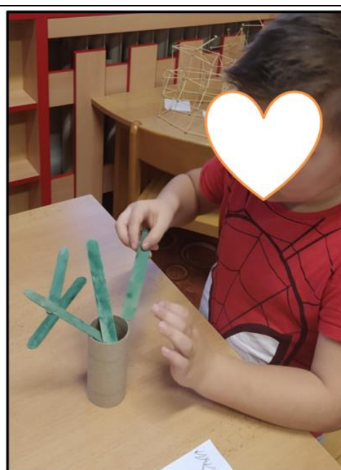
Obrázek 13 Sestavení jabloňky