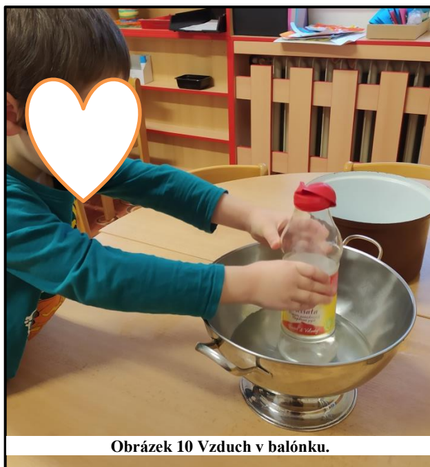
Obrázek 10 Vzduch v balónku.

Děti se dožadovaly opakování, ale chtěly, abych je dala jenom do studené vody. Děti hned volaly, že takto se balónek nenafoúkne. Zeptala jsem se proč. Chlapec č. 2: „Protože ten vzduch není ohřátý a není ho tam tolik.“ Děti jsem se tedy zeptala na to, kdy se balónek nafaúkne. Chlapec. 4: „Když v té láhvi bude teplý vzduch, ale to ji musíme dát do té horké vody, aby se ohřál“ Děti si mohly činnost vyzkoušet pod dozorem dospělého, pokud měly zájem.