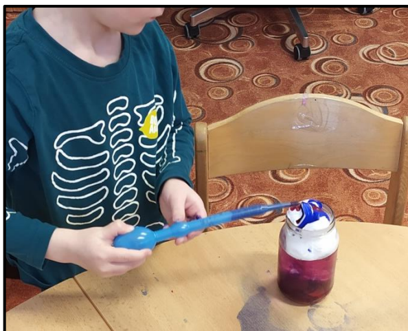
Obrázek 8 Jak vzniká déšť

Děti měly během dopoledne možnost vyzkoušet si aktivitu samostatně, od nalití vody do sklenice přes vytvoření mraku pěnou až po manipulaci s pipetou.