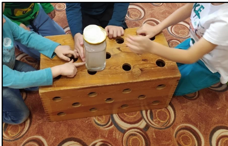
Obrázek 7 Jak vznikla mlha

skleničce. “ Během několika chviliek se ve sklenici vytvoří hustá, neprůhledná mlha. Děti jsem zvala ke skleničce po menších skupinkách, aby se mohly podívat na mlhu z blízka, a nechala je všechno prozkoumat. Já: „ Děti zkuste si sáhnout na spodek sklenice, jaká je tam ta voda? Horká. A co ten led nahoře, jaký je? “ Děti: „ Ledový, studený, zmrzlý. Je od něj zima. “ Já: „ A co se nám v té skleničce stalo? Já: Jak vznikla mlha ve sklenici? “