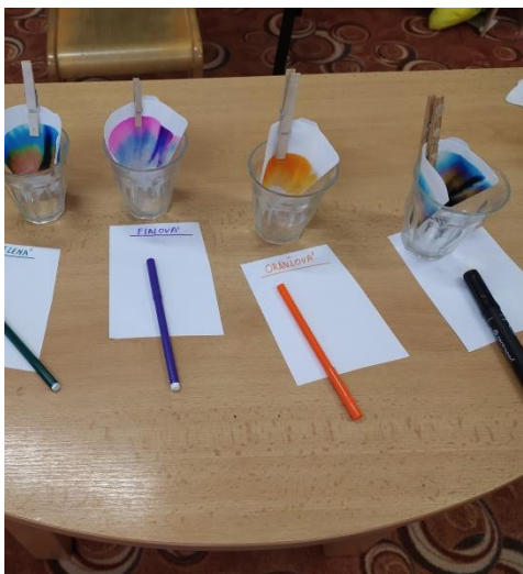
Obrázek 5 Chromatografie