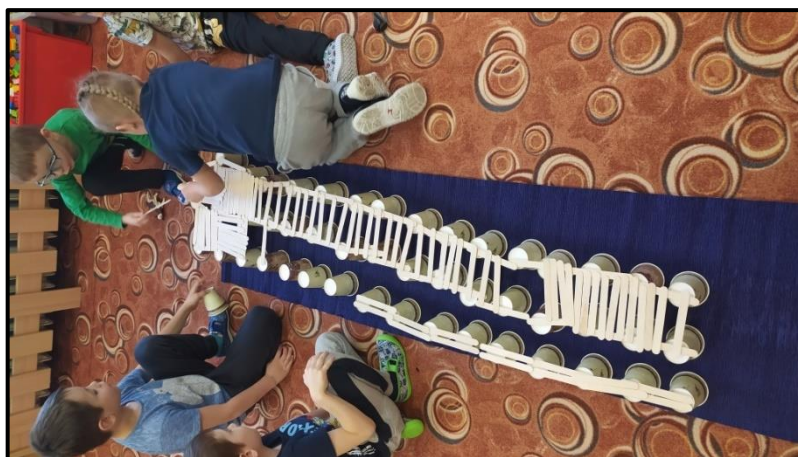
Obrázek 15 Volná hra chlapců v návaznosti na aktivitu