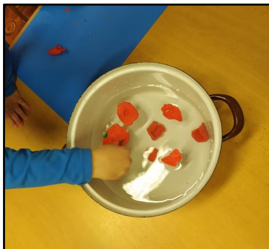
Obrázek 3 Kdy plave plastelína 1

Vymodeluju to znova, ale nesmí se mi tam dostat ta voda.“