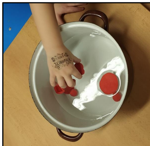
Obrázek 4 Kdy plave plastelína 2