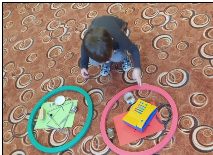
Obrázek 1 Třídění věcí magnetických a nemagnetických Zdroj: vlastní

Společně s dětmi jsme si ještě společně ukázaly na materiály, které magnet přitahuje a které ne. Dětem na stolečku ve třídě zůstal tác s magnetem a předměty z různých materiálů. Děti si mohly znovu ozkoušet, co se k magnetu přitahuje a co ne.