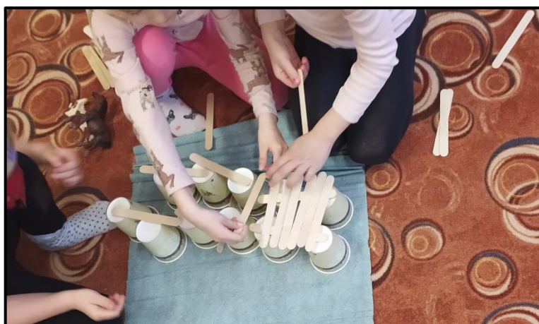
Obrázek 14 Most pro zvířátka na farmu

Protože v aktivitě chtěly děti pokračovat, dostaly opět ztížené podmínky. Já: „ Děti na statek přišla velká vichřice a mosty zbořila a zbyly jenom některé části mostu, přes které musí zvířátka přejít. Zbylo nám 6 kelímků a 20 špachtliček. “. I přes počáteční komplikace se sníženým počtem kelímků a špachtliček, se dětem podařilo vytvořit stabilní most, přes které zvířátko přejde.