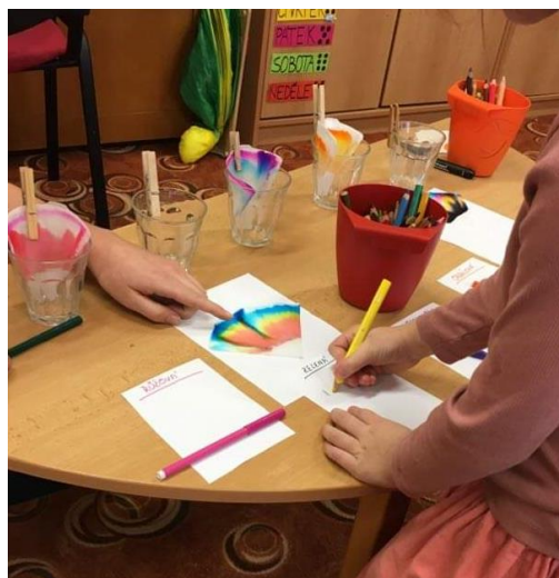
Obrázek 6 Zakreslení barev z chromatografie