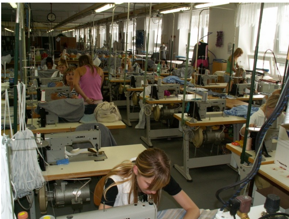
Obr.9: Dílny SOŠ oděvní a SOU ( SOŠ oděvní a SOU Strážnice [online]. 01. 01. 2000 [cit. 2011-03-11]. Dostupné z WWW: < http://www.sosostraznice.cz/ >.)