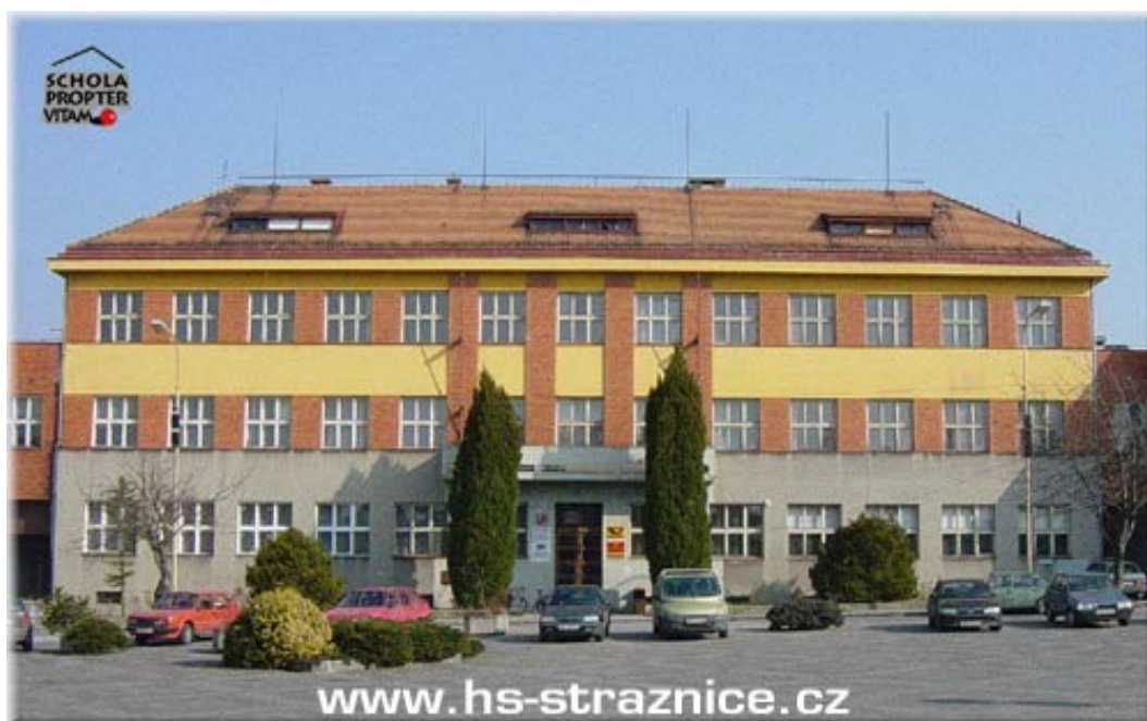
Obr.11: Budova soukromé hotelové školy ( Střední škola hotelová, služeb a Veřejnosprávní akademie, s. r. o. [online]. c 2001 [cit. 2011-03-11]. Dostupné z WWW: < http://www.hs-straznice.cz/ >.)