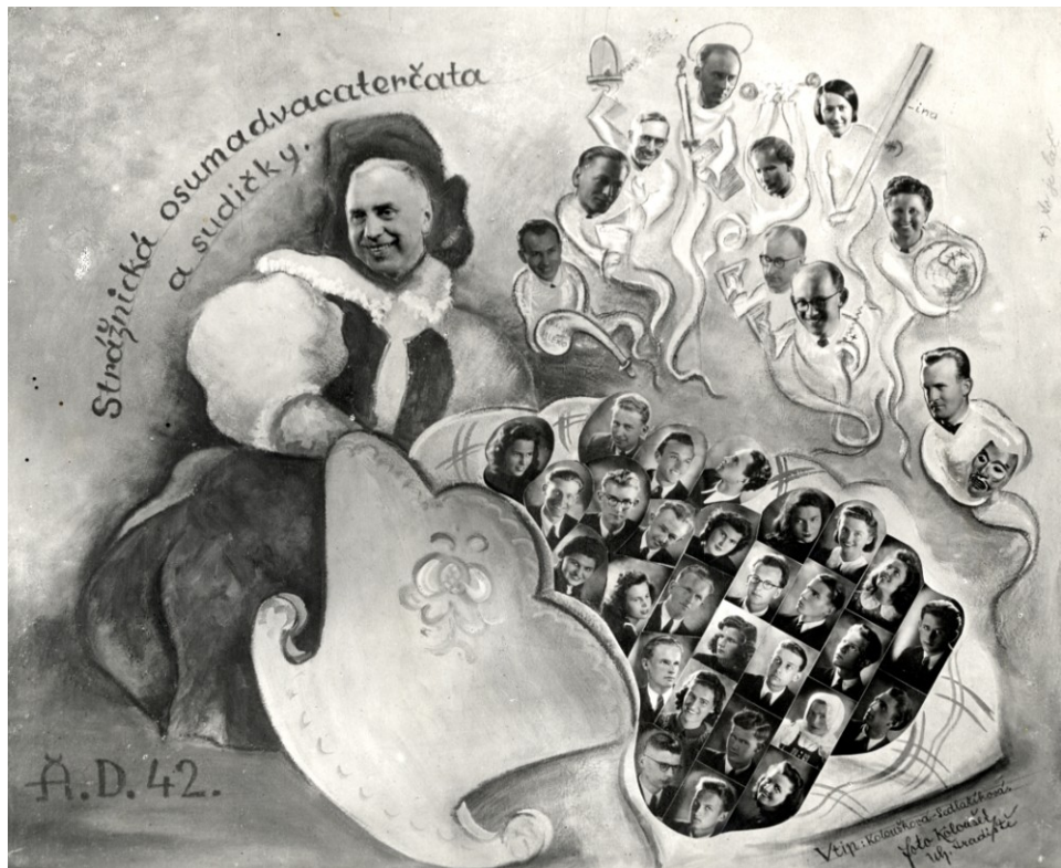
Obr.4: Abiturienti českého gymnázia v roce 1942