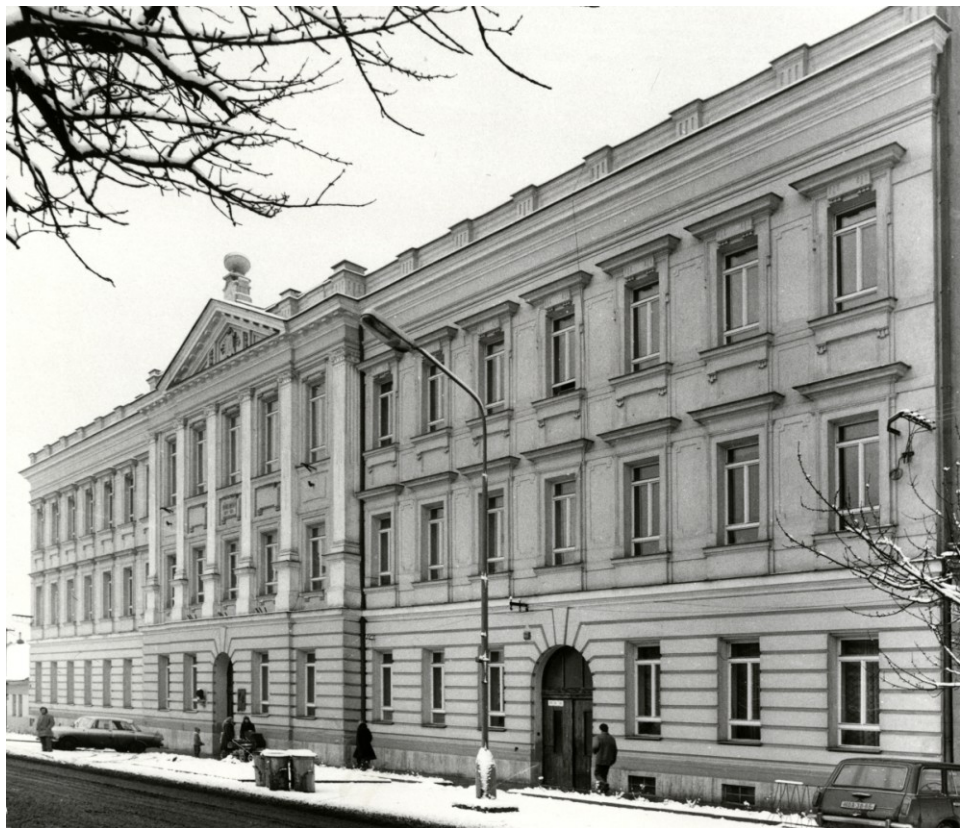
Obr.5: Budova gymnázia 70. léta 20. století