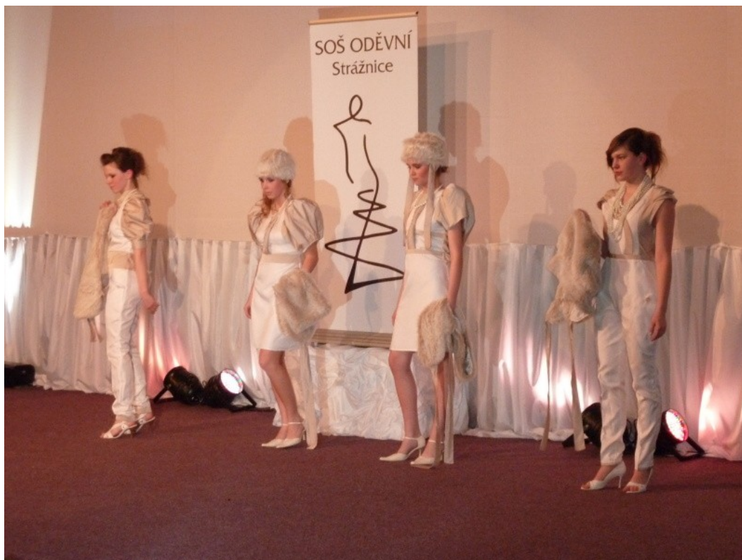
Obr.10: Módní přehlídka ve Veselí nad Moravou 26. 2. 2010 ( SOŠ oděvní a SOU Strážnice [online]. 01. 01. 2000 [cit. 2011-03-11]. Dostupné z WWW: < http://www.sosostraznice.cz/ >.)