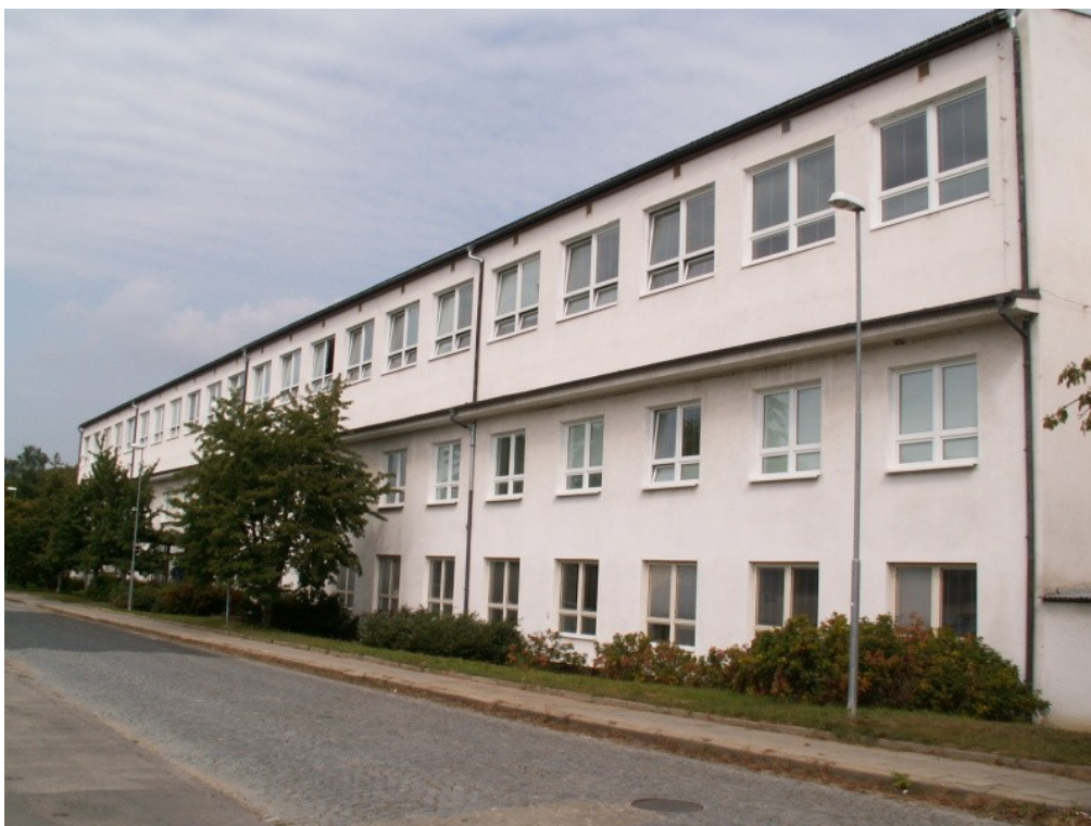
Obr.8: Budova SOŠ Oděvní a SOU ( SOŠ oděvní a SOU Strážnice [online]. 01. 01. 2000 [cit. 2011-03-11]. Dostupné z WWW: < http://www.sosostraznice.cz/ >.)