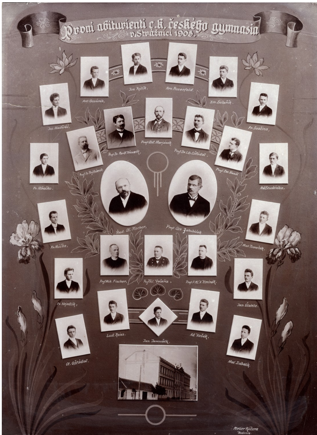
Obr.3: První abiturienti českého gymnázia v roce 1905