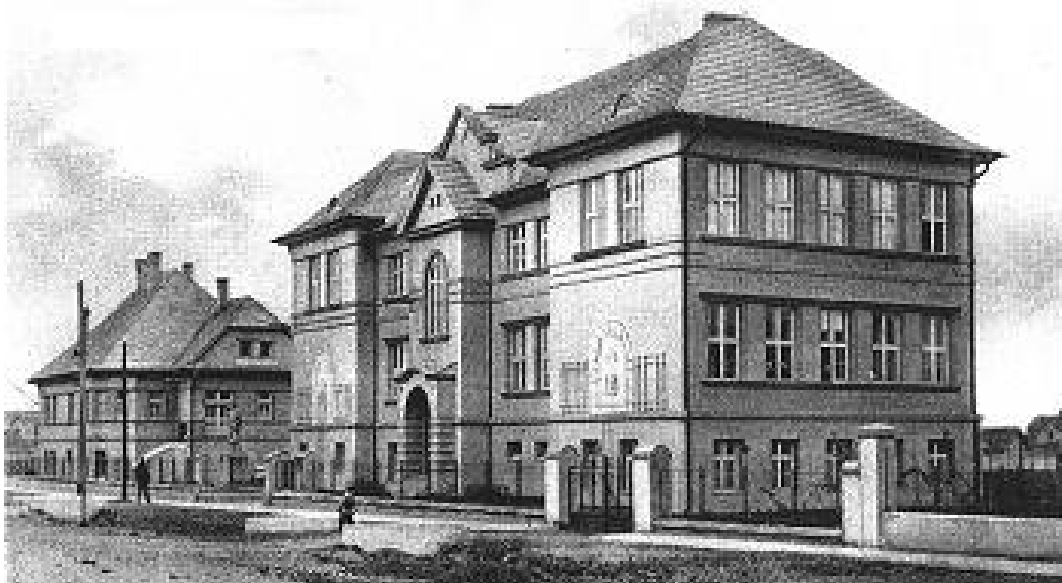
Obr.6: Zemská hospodářská škola 1926 ( Střední odborná škola Strážnice [online]. c SOŠ Strážnice [cit. 2011-03-09]. Dostupné z WWW: http://www.sosstr.cz/ )