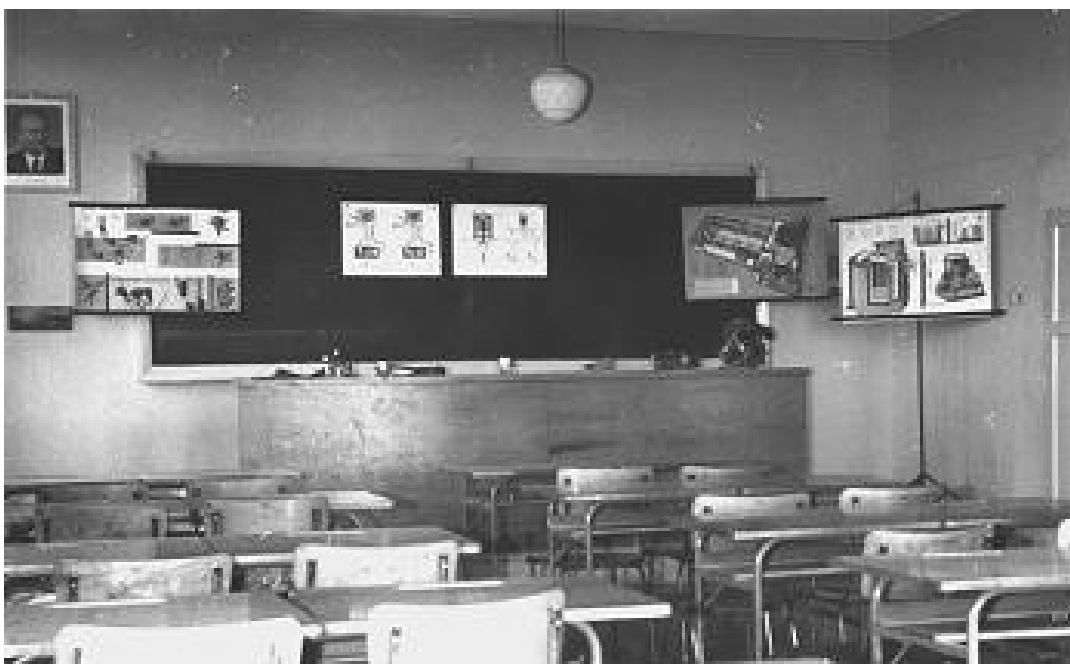
Obr.7: Specializovaná učebna Zemské hospodářské školy ( Střední odborná škola Strážnice [online]. [cit. 2011-03-09]. Dostupné z WWW: http://www.sosstr.cz/)