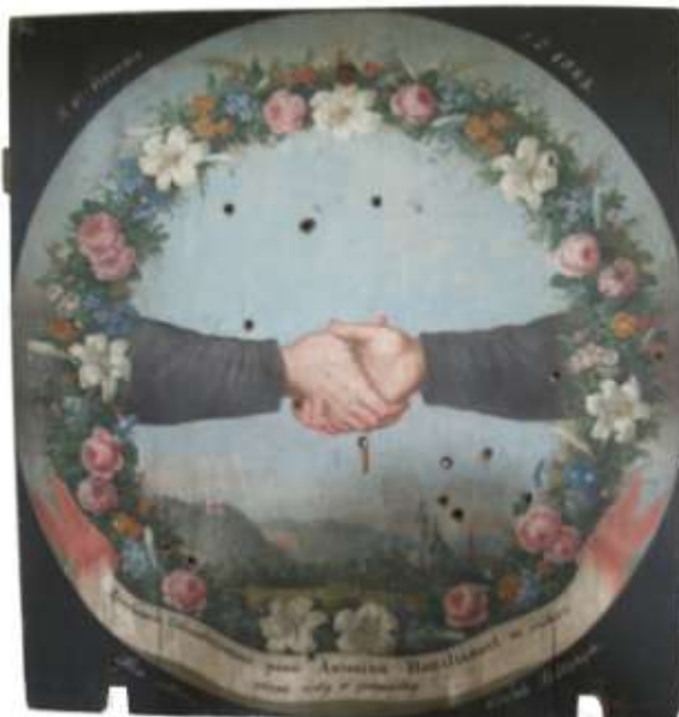
60. Sbor ostrostřelců , 8. 7. 1865, olej, dřevo; 78 × 74,5 cm, Šumperk, Vlastivědné muzeum, fond Havelkova muzea, inv. č. H 2954-1