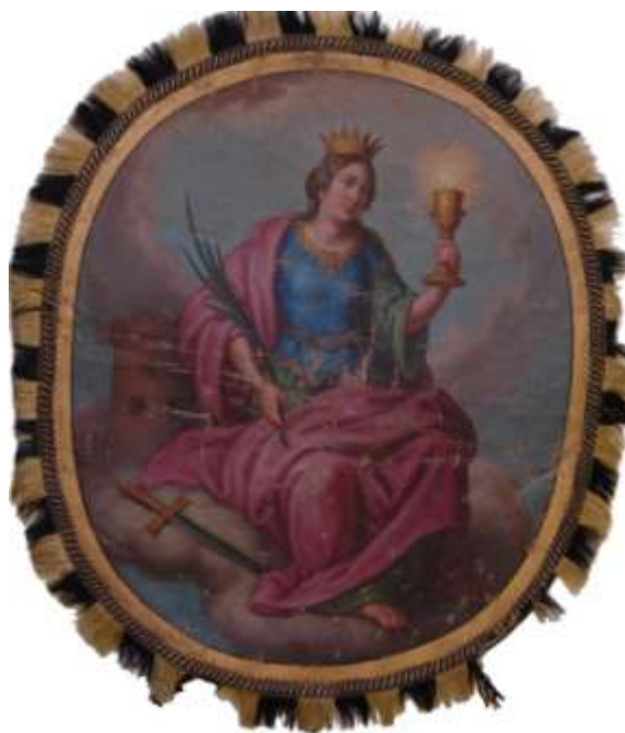
54. Sv. Barbora , druhá polovina 19. století, olej, plátno; 49,5 × 42 cm, Šumperk, Vlastivědné muzeum, fond Havelkova muzea, inv. č. H 2523