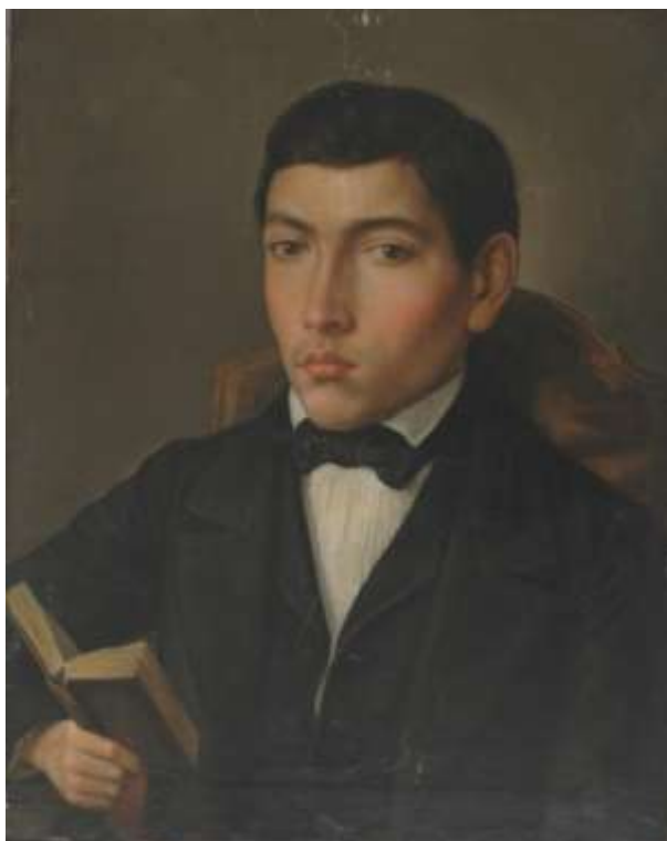
49. Portrét Jana Havelky , druhá polovina 19. století, olej, plátno; 50,5 × 40 cm, Šumperk, Vlastivědné muzeum, pobočka Havelkovo muzeum v Lošticích, inv. č. H 2597