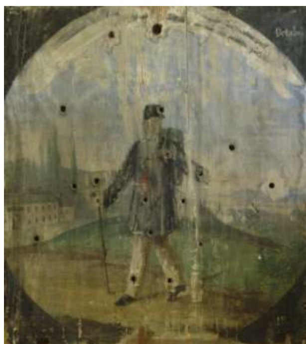
61. Budova Jednotného Zemědělského Družstva , druhá polovina 19. století, Šumperk, Vlastivědné muzeum, fond Havelkova muzea, inv. č. H 2954-2