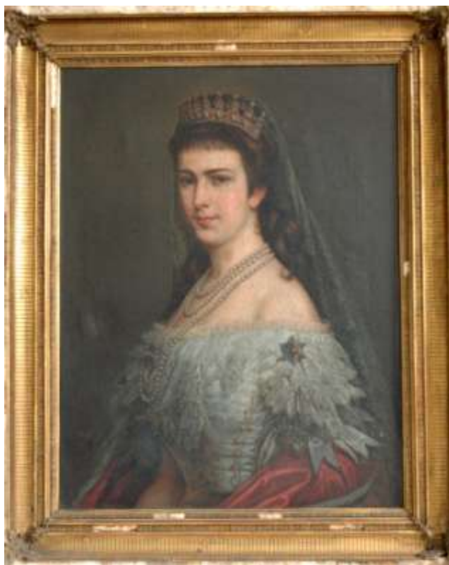
51. Portrét císařovny Alžběty , 1880, olej, plátno; 81,4 × 62,5 cm, Šumperk, Vlastivědné muzeum, pobočka Havelkovo muzeum v Lošticích, inv. č. H 4337