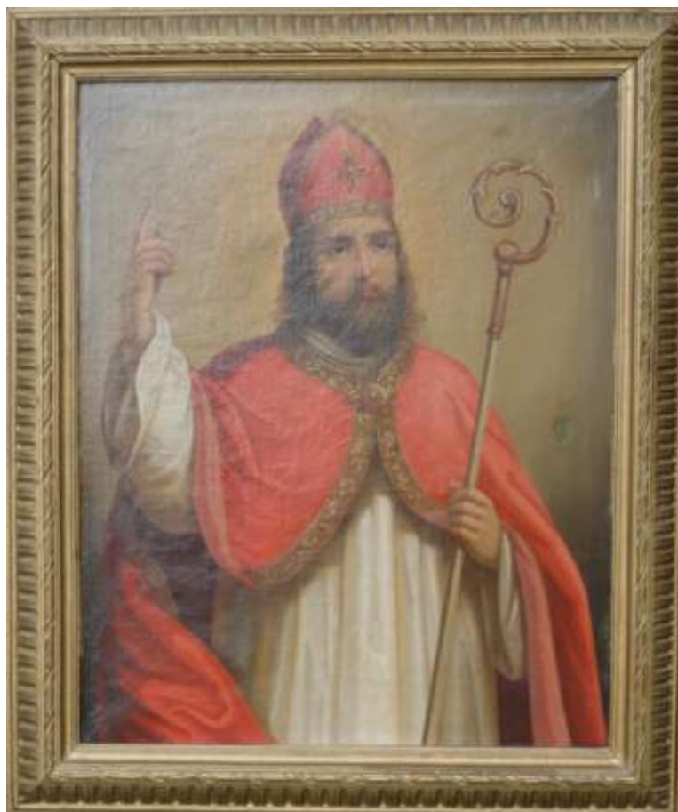
80. Sv. Mikuláš , druhá polovina 19. století, olej, dřevo; přibližně 67 × 48 cm, ve vlastnictví rodiny Drlíkové v Lošticích.