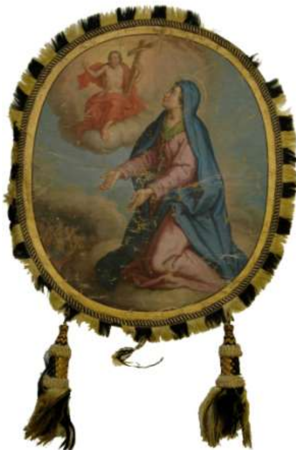
55. Orodující Panna Marie , druhá polovina 19. století, olej, plátno; 50 × 42 cm, Šumperk, Vlastivědné muzeum, fond Havelkova muzea, inv. č. H 2524