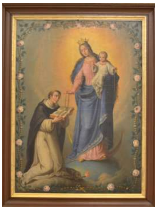
44. Sv. Dominik s Růžencovou Pannou Marií , 1863, olej, plátno; 99 × 73 cm, Šumperk, Vlastivědné muzeum, fond muzea v Mohelnici, inv. č. H 2105