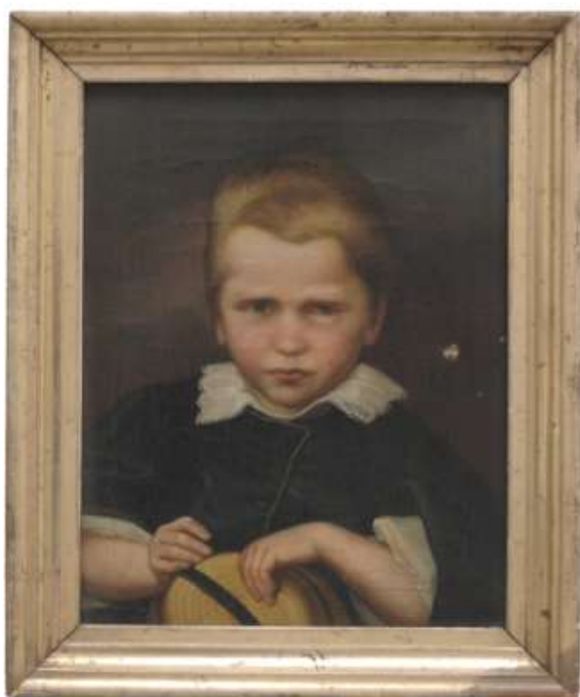
48. Dětský portrét , druhá polovina 19. století, olej, plátno; 32,5 × 25,5 cm, Šumperk, Vlastivědné muzeum, pobočka Havelkovo muzeum v Lošticích, inv. č. H 2573