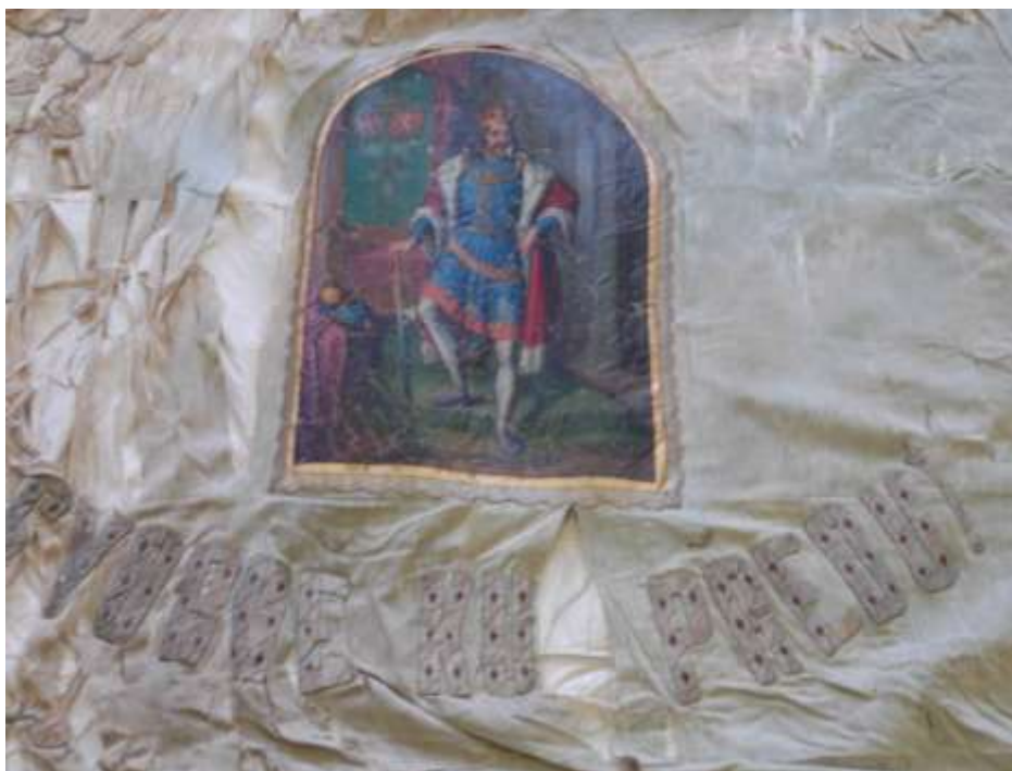
59. Prapor Občanské besedy král Jiří z Poděbrad, 1871, detail.