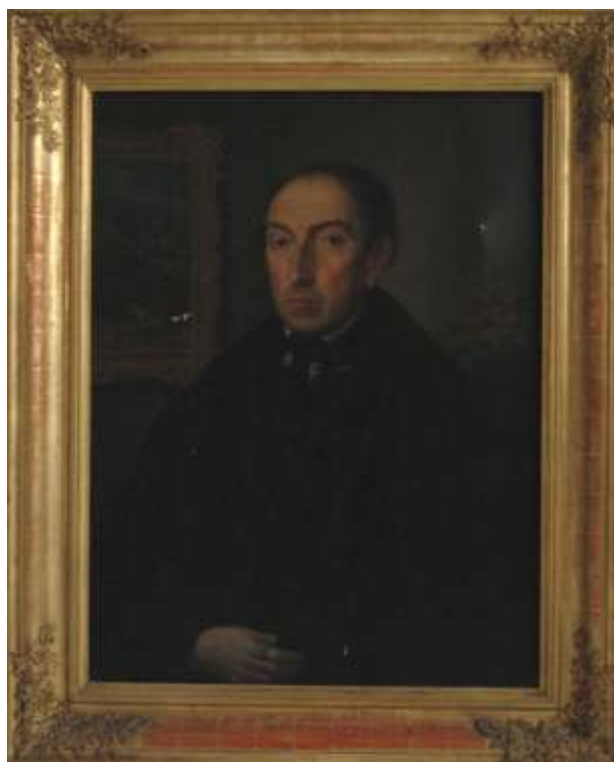
46. Autoportrét , druhá polovina 19. století, olej, plátno; 76 × 58,3 cm, Šumperk, Vlastivědné muzeum, pobočka Havelkovo muzeum v Lošticích, inv. č. H 2595