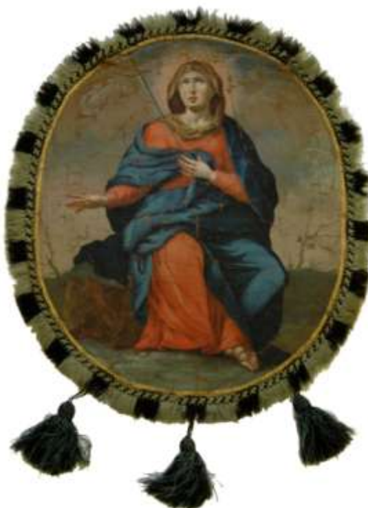
52. Panna Marie Bolestná , druhá polovina 19. století, olej, plátno; 50 × 42,5 cm, Šumperk, Vlastivědné muzeum, fond Havelkova muzea, inv. č. H 2521