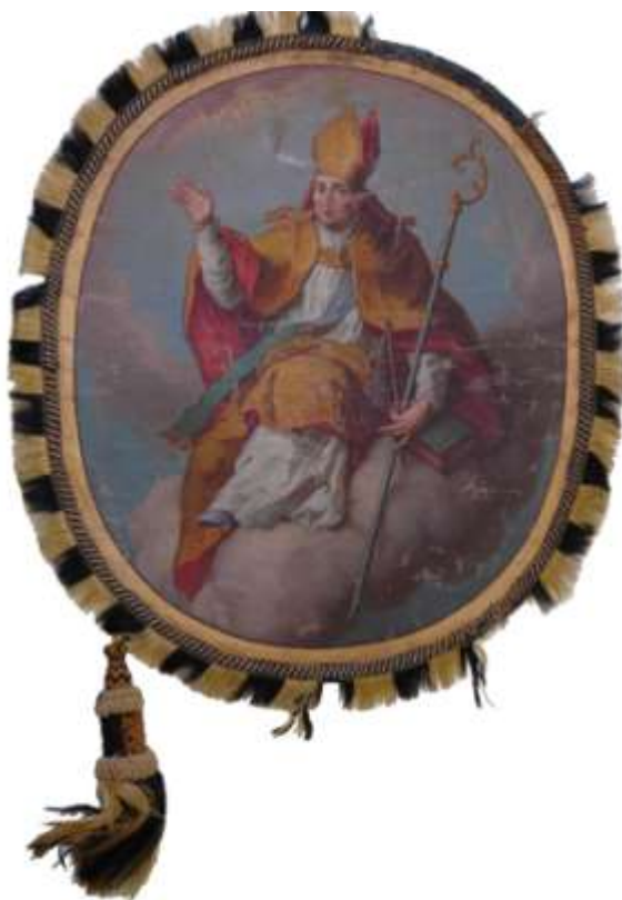
53. Sv. Prokop , druhá polovina 19. století, olej, plátno; 50 × 42,5 cm, Šumperk, Vlastivědné muzeum, fond Havelkova muzea, inv. č. H 2522