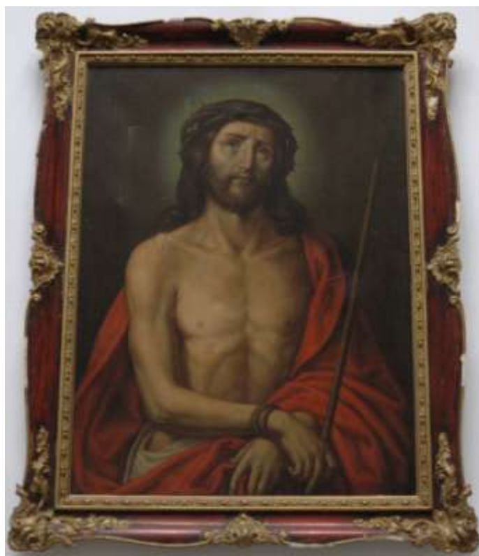
36. Kristus , 1868–1869, olej, plátno; 75,5 × 56,5 cm, Šumperk, Vlastivědné muzeum, pobočka Havelkovo muzeum v Lošticích, inv. č. H 2586