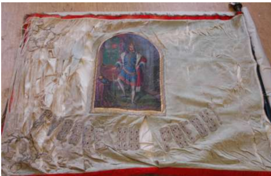
57. Prapor Občanské besedy Král Jiří z Poděbrad , 1871, olej, plátno; 150 × 170 cm, Šumperk, Vlastivědné muzeum, fond Havelkova muzea, inv. č. H 2706