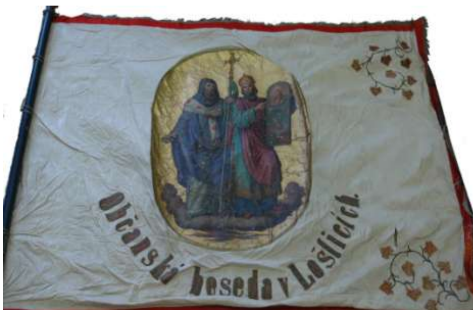
56. Prapor Občanské besedy sv. Cyril a sv. Metoděj , 1871, olej, plátno; 150 × 170 cm, Šumperk, Vlastivědné muzeum, fond Havelkova muzea, inv. č. H 2706