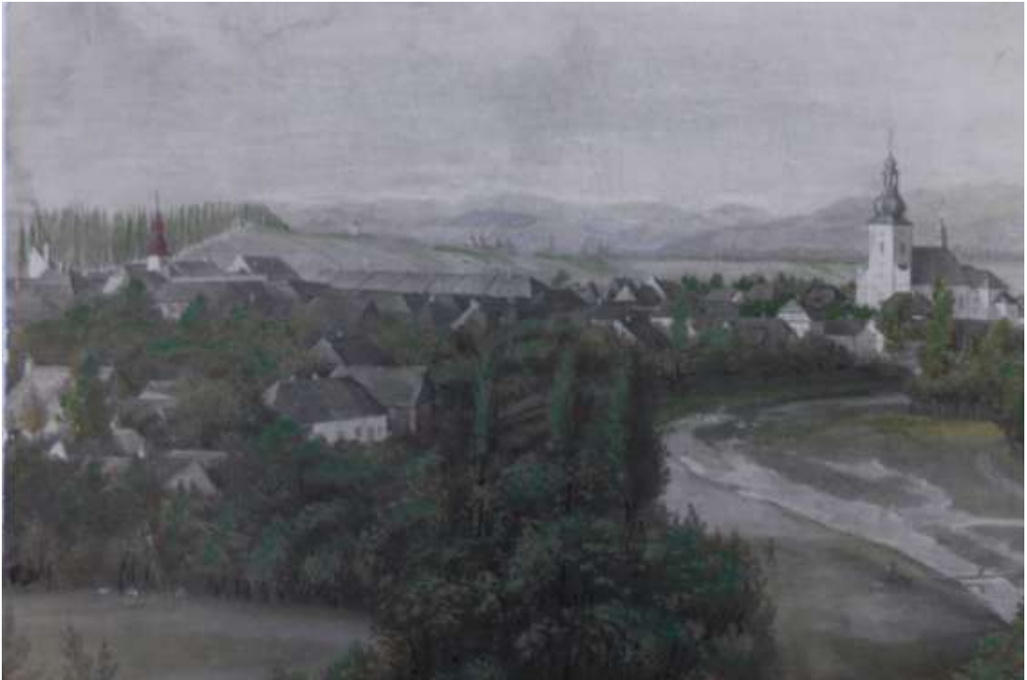
34. Fotografie dle obrazu Fr. Havelky, 1862, Kolorovaná fotografie, přibližně 47 × 38 cm Šumperk, Vlastivědné muzeum, fond Havelkova muzea, inv. č. H 4023