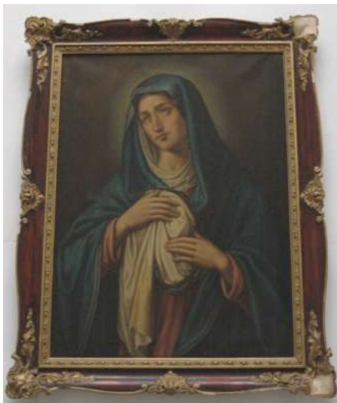
35. Panna Marie Bolestná , 1868, olej, plátno; 75 × 57 cm, Šumperk, Vlastivědné muzeum, pobočka Havelkovo muzeum v Lošticích, inv. č. H 2584