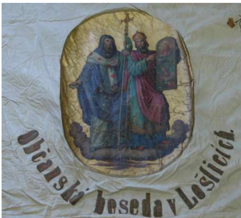
58. Prapor Občanské besedy sv. Cyril a sv. Metoděj , 1871, detail