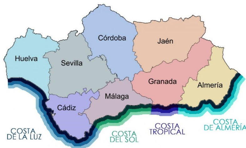
Obrázok 3: Provincie a pobrežia Andalúzie

Andalúzia je rozdelená do ôsmich provincií, z ktorých päť sa rozprestiera na pobreží. Provincie Andalúzie, Sevilla, Huelva, Córdoba, Jaén, Cádiz, Málaga, Granada a Almería, sú miesta, na ktoré turisti len tak ľahko nezabudnú a často sa vracajú späť.