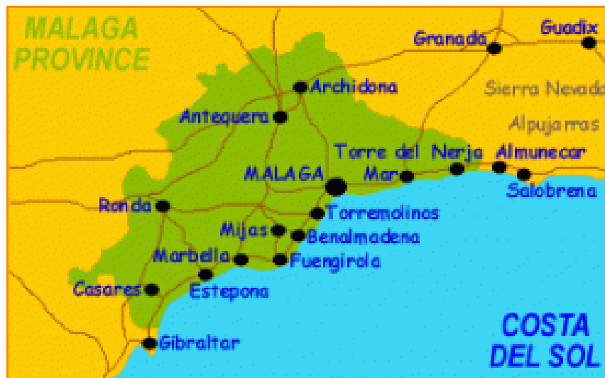
Obrázok 6: Provincia Malaga a jej časti