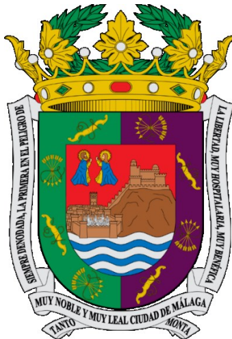
Obrázok 5: Erb mesta Malaga