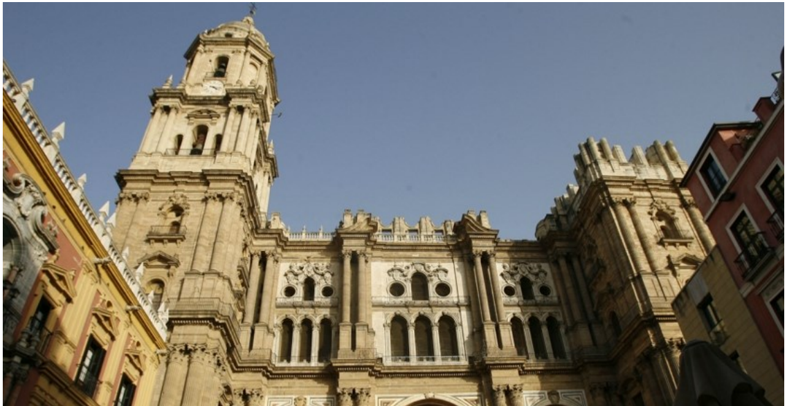
Príloha 1: Katedrála La Manquita v Malage

V prílohe sú uvedené obrázky z miest zahrnutých vo vytvorenom zájazde.