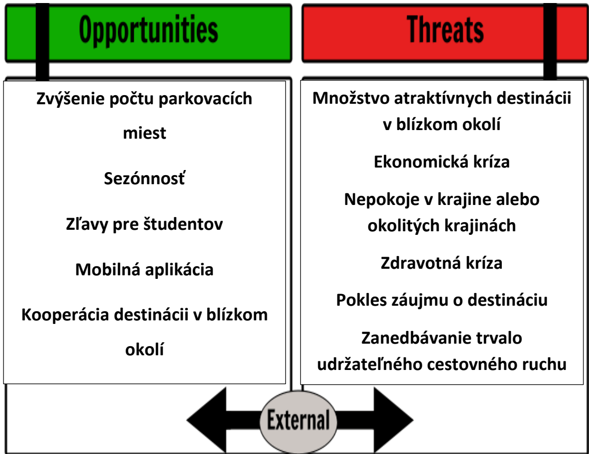
Tabuľka 2: SWOT analýza – príležitosti a hrozby