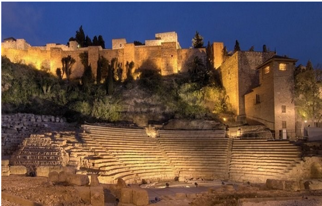
Príloha 2: Rímske divadlo v Malage