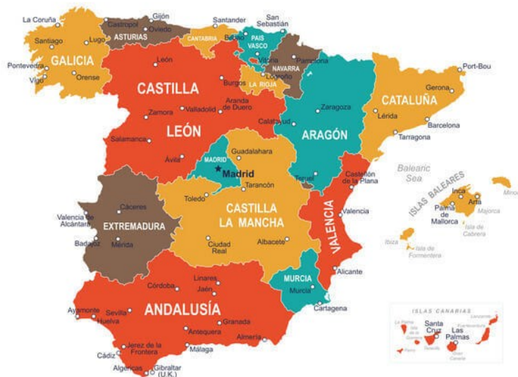
Obrázok 2: 17 autonómnych oblastí Španielska

Andalúzia, a celkovo Španielsko je veľmi vyhľadávanou a navštevovanou destináciou v Európe. V roku 2017 bolo Španielsko najčastejšou destináciou pasívneho cestovného ruchu v EÚ v prípade ľudí cestujúcich do zahraničia, pričom počet prenocovaní v ubytovacích zariadeniach cestovného ruchu predstavoval 306 miliónov, resp. 20 % z celkovej hodnoty v rámci EÚ. (web 1)