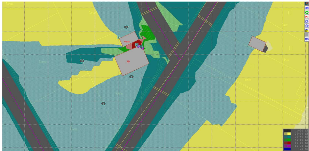
Obr.9.2: Hluková situace – Noc