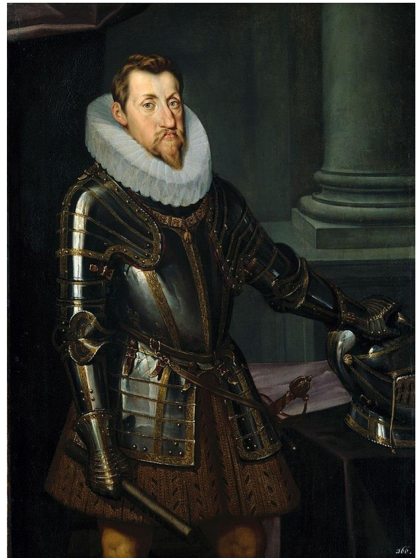
Figuur 11: Ferdinand II

Door hun rebellie bewezen de rebellen een vreselijke slechte dienst aan de standen en het protestantisme. Sommige rebellen en de eerste emigranten verlieten de Tsjechische landen samen met de koning. De leiders van de opstand die het land niet vertrokken, werden in de zomer van 1621 in Praag geëxecuteerd. Er waren grote confiscaties van het eigendom in Bohemen die een recessie hebben veroorzaakt. Moeilijke tijden begonnen voor de protestantse gelovigen. Alle niet-katholieke geestelijken werden verdreven uit Bohemen tot 1624. In de jaren 1627 en 1628 gaf Ferdinand nieuwe grondwetten uit aan de