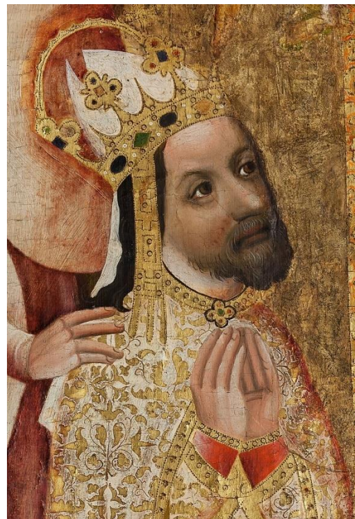
Figuur 2: Karel IV

Keizer Karel IV zorgde nauwgezet voor zijn Přemyslidse erfenis. Praag werd de hofstad van het Heilige Roomse Rijk, er werd onder andere een universiteit gesticht. Karel verwierf een aanzienlijk gebied en creëerde de Landen van de Boheemse Kroon, bestaande uit Bohemen, Moravië, Silezië en Opper- en Neder-Lausitz. Zijn zoon Wenceslaus IV kwam in 1378 op de troon. Wenceslaus IV was niet bekwaam genoeg om de problemen van zijn tijd op te lossen. De autoriteit van de katholieke kerk werd ondermijnd door het Westers Schisma, de Tsjechische munteenheid werd gedevalueerd door de inflatie. De Tsjechische staat verkeerde in een crisis