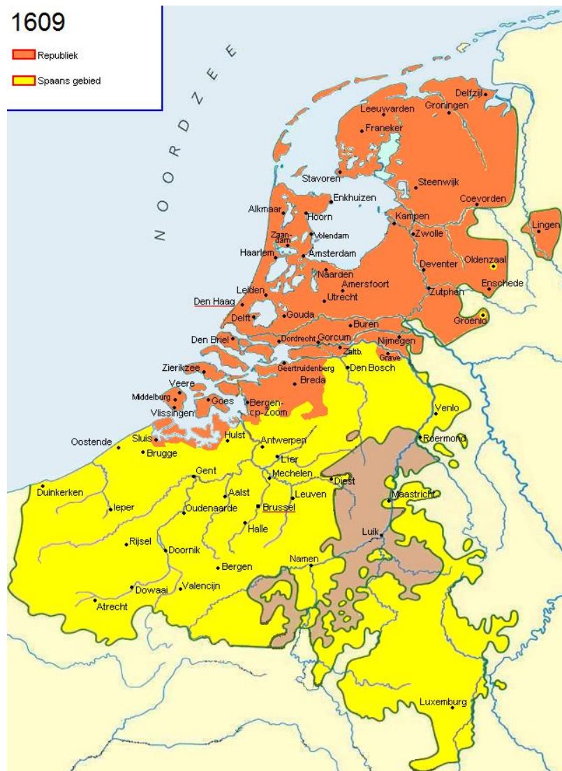
Figuur 7: Het Twaalfjarig Bestand

De 17 e eeuw staat algemeen bekend als de gouden eeuw van Nederlanden. De Republiek werd beschouwd als een van de rijkste gebieden in Europa. De economische boom werd ondersteund door handelsroutes naar Oost-Indië onder auspiciën van VOC. De Republiek werd een koloniale supermacht. De steden groeiden omdat mensen naar Nederlanden verhuisden voor werk, maar ook om religieuze redenen. Dit geldt ook voor Joden die naar Nederlanden kwamen, vooral uit Spanje en Portugal, waar ze werden verdreven. Beroemde kunstenaars zoals Rembrandt,