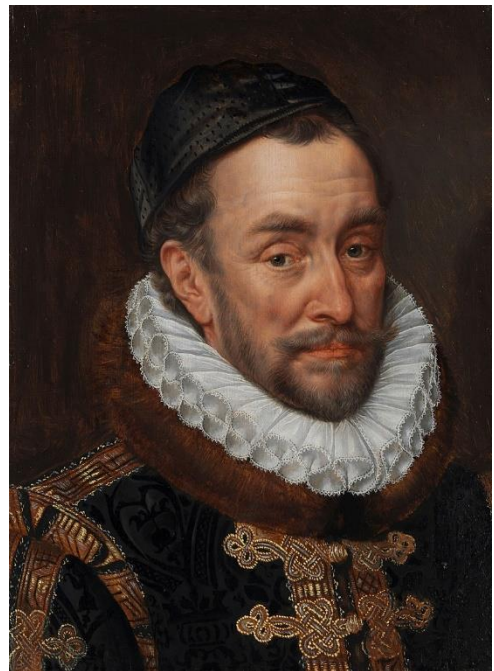
Figuur 4: Willem van Oranje

De lagere aristocratie vormde in 1555 een vereniging het Verbond der Edelen (Compromis) , die hetzelfde eiste als Willem van Oranje en zijn aanhangers. Willem en zijn collega's hebben zich officieel van deze vereniging afgekeerd. De hoofdpersonen waren Lodewijk van Nassau (broer van Willem), Hendrik van Brederode, Floris van Culemborg en de broers Jan en Filip van Marnix. In 1566 droegen de leden van deze vereniging hun verzoek voor bij de landvoogdes Margaretha. Ze verzochten om de edicten tegen de ketters terug te trekken. Margaretha's adviseur Berlaymont noemde de aanvragers bedelaars, in het Frans gueux . Dit creëerde de beroemde bijnaam geuzen .