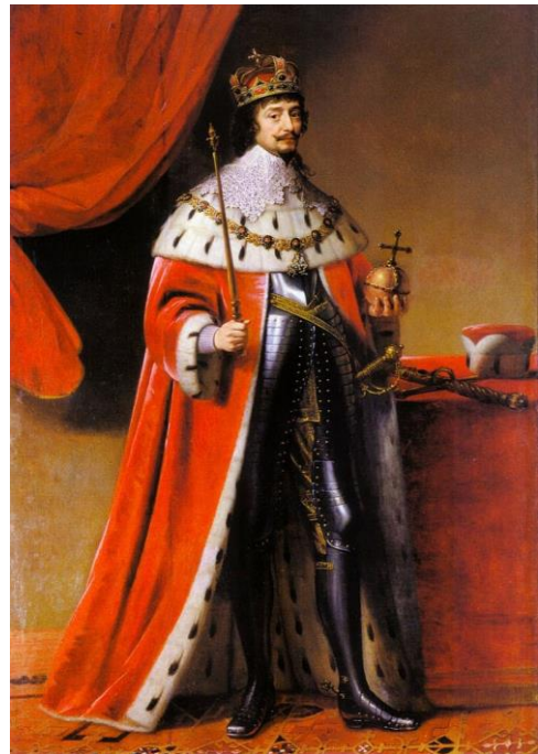
Figuur 10: Frederik van de Palts

Frederik had echter geen haast om Praag te bereiken. Hij aarzelde of hij de Boheemse kroon zou accepteren. Zijn schoonvader Engelse koning Jacobus I adviseerde hem dat niet te doen. Zijn oom prins Maurits raadde hem juist aan het wél te doen. Hij kwam pas in november 1619 in Praag aan. Al in het begin van zijn bestuur antagoniseerde hij een groot deel van de bevolking tegen zichzelf, toen hij een beeldenstorm in Sint-Vituskathedraal uitvoerde. Er heerste ook een slechte stemming in het Tsjechische leger, dat bijna geen salaris ontving. De verkiezing van Frederik was ook een grote belediging voor de hertog van Saksen