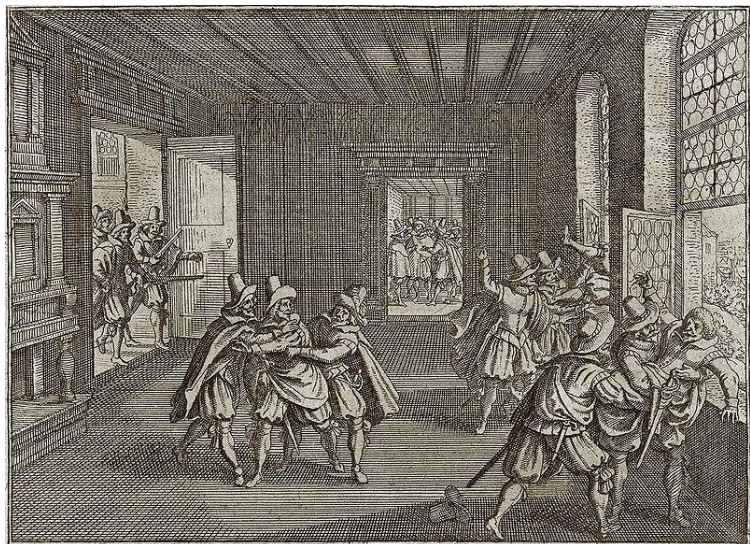
Figuur 9: De Derde Praagse Defenestratie

In mei 1618 ontmoetten de radicalen die ontevreden waren met de verkiezingen (sommigen stemden een paar maanden geleden voor Ferdinand) in Praag. Met de rechtvaardiging dat de rechten van de standen werden geschonden, vielen ze op 23 mei de Praagse burcht binnen en