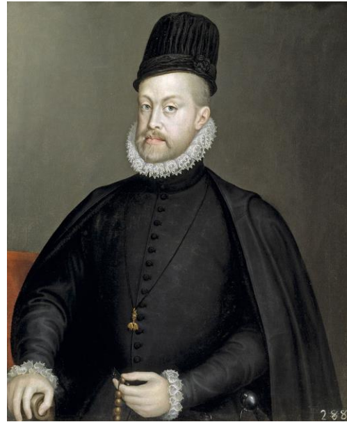
Figuur 3: Filips II

Na de troonsafstand van zijn vader, Karel, in 1555, besteedde de compromisloze katholieke Filips II de troon van Spanje. Hij erfde alle titels van zijn vader behalve één. Filips' oom Ferdinand I werd de keizer van het Heilige Roomse Rijk. Naast de titels erfde Filips zijn vaders schulden en de kostbare oorlog met Frankrijk, dat zich bedreigd voelde door een Habsburgs machtsgebied. De koning regeerde niet rechtstreeks in Nederlanden, net zoals zijn vader had hij een landvoogd had aangesteld om in zijn plaats te regeren. Tijdens de oorlog met Frankrijk leidde de ervaren krijger Emanuel Filibert van Savoye de aanval op Frankrijk vanuit Nederlanden. In het leger