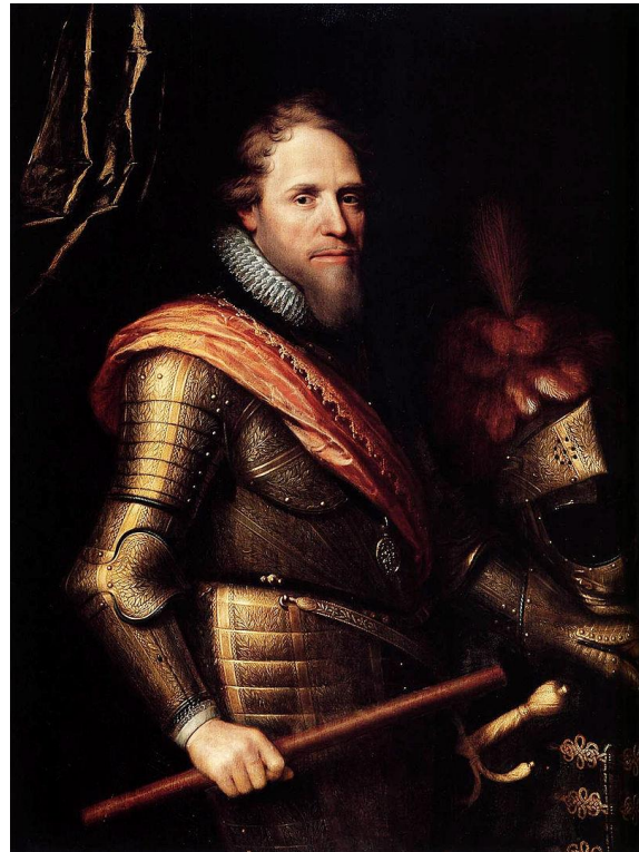
Figuur 6: Maurits van Oranje

De jonge republiek kreeg ruimte voor een tegenoffensief. Maurits van Oranje werd de hoogste militaire commandant en begon het leger te hervormen. Maurits hield zich bezig met de studie van de constructie van vestingwerken, de belegeringstechnieken en de mars van de troepen. In het leger introduceerde hij een gestandaardiseerd kaliber en ook harde discipline. In ruil daarvoor kon hij de soldaten een vast salaris beloven dat de jonge republiek genereus had gefinancierd. Dit alles werd weerspiegeld in de successen op het slagveld. Maurits was bijzonder succesvol in de belegering van steden. In de jaren negentig, die