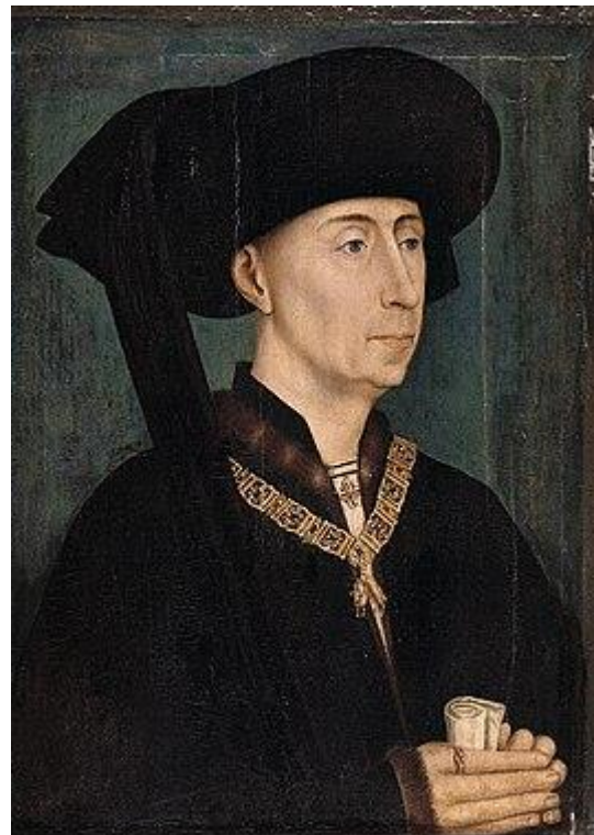
Figuur 1: Filips de Goede

De gefragmenteerde graafschappen en hertogdommen begonnen langzaam te fuseren aan het einde van de 14 e eeuw. Vlaanderen werd door Filips II de Stoute, hertog van Bourgondië geërfd. De machtsovername was probleemloos omdat Filips II alle rechten van de onderdanen bevestigde. Zijn zoon Filips de Goede ging met de toegeeflijke tactiek door. Hij kreeg controle over andere gebieden. Hij kreeg zo Namen (1421), Henegouwen (1428), Holland en Zeeland (1432),