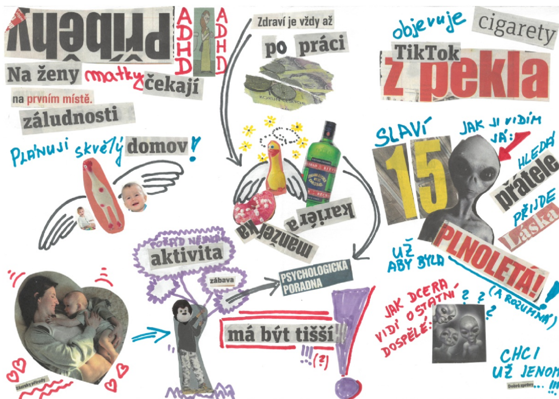
Obrázek 5: Koláž Karolína. Autor: Karolína.

Karolína vnímá sebe a děti jako lidi s poruchou, identifikuje se v mimozemšťanech. Vnímání mimozemšťanů je ve společnosti spojeno s myšlenkou, že by jejich inteligence a způsoby komunikace měly být odlišné od lidských. Dorozumívají se neznámým jazykem nebo signály. Cítit se jako mimozemšťan se používá ve významu, že se člověk cítí mimo společnost. Je třeba si uvědomit, že impulzivní reakce lidí s ADHD jsou pro okolí často nepochopitelné. Pro poruchu ADHD bez hyperaktivity je typické denní snění (Goetz & Uhlíková, 2013) a sama Karolína se vyjadřuje o tom, že dcera žije ve svém světě a její vrstevníci to nechápou, zůstává tak osamocená a mimo kolektiv.