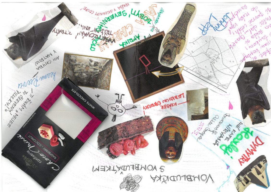
Obrázek 4: Koláž Lenky. Autor: Lenka.

Lenka ví o svém problému s autoritami, který byl diagnostikován odborným lékařem. Nasvědčuje tomu i černočervená barevnost. Tato kombinace barev se často používá u zobrazování pekla. V přírodě je to varovná kombinace u jedovatých živočichů.