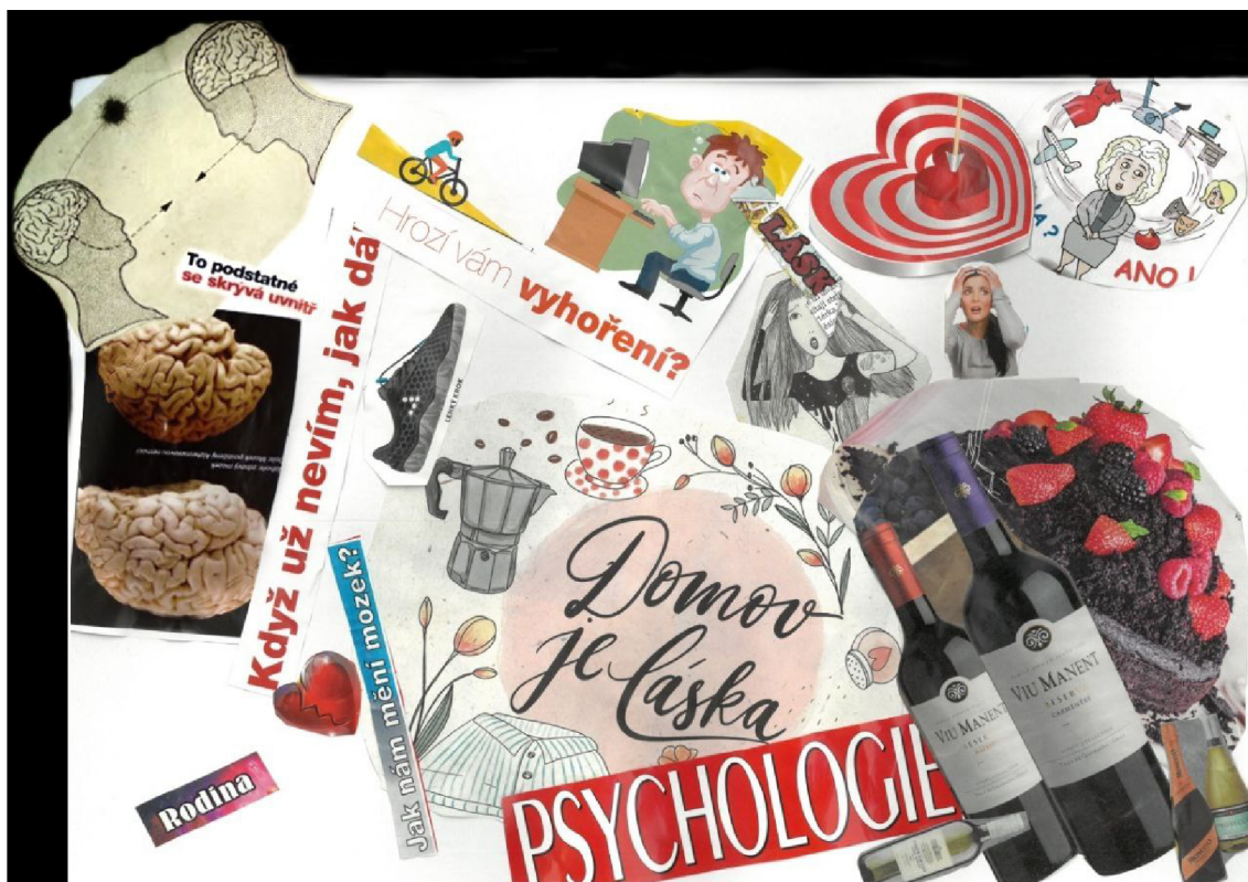
Obrázek 1: Koláž Anežky. Autor: Anežka.

Anežčina koláž (Obrázek 1) je středové kompozice.