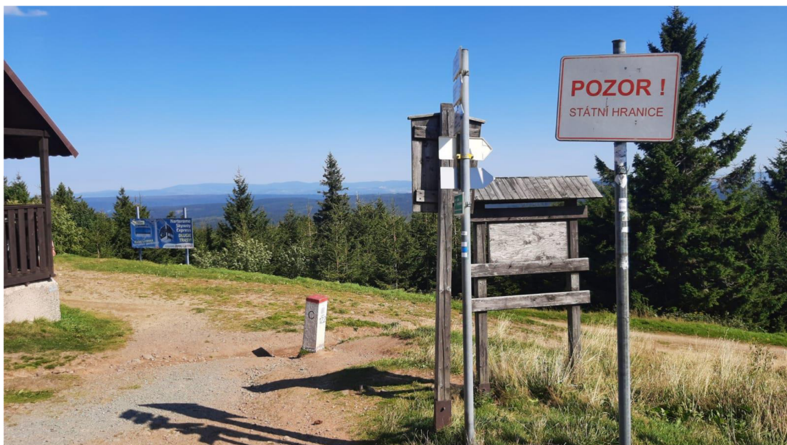
Obrázek 2 - Fotografie hraničního značení s využitím umělých hraničních znaků. Situace značení státní hranice České republiky a Polska v prostoru Masarykovy chaty nedaleko kóty Šerlich v Orlických horách, (Září 2021).

Oprávnění neboli kompetence Zeměměřického úřadu 25 nalezneme v ustanovení §3a písm. g) zákona č. 359/1992 Sb., o zeměměřických a katastrálních orgánech, provádí zeměměřické činnosti na státních hranicích v dohodě se správcem dokumentárního díla státních hranic. Obsahem zákonného zmocnění k provádění zeměměřických činností na státních hranicích je současně v zákoně o státních hranicích v ustanovení §8 písm. a), jak bylo uvedeno výše u kompetencí Ministerstva vnitra.