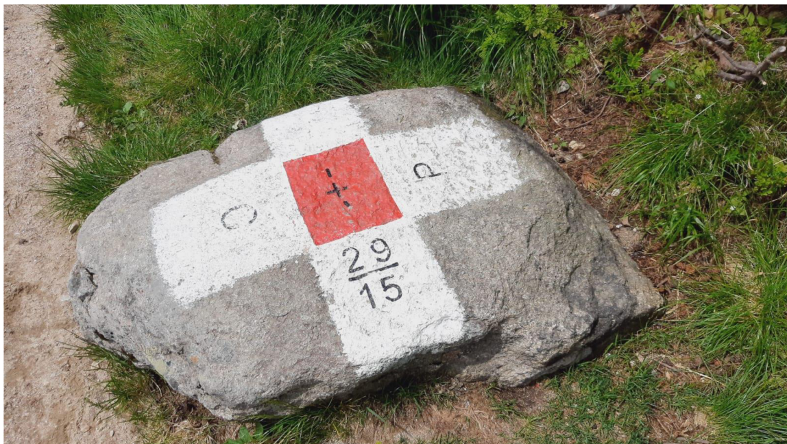
Obrázek 1 - Fotografie hraničního značení s využitím přírodního objektu. Situace značení státní hranice České republiky a Polska v úseku mezi Sněžkou a Luční boudou, (Červenec 2022).

hranicích, zabezpečuje umístění zařízení upozorňujících na průběh státních hranic a je dotčeným orgánem státní správy v územním a stavebním řízení.