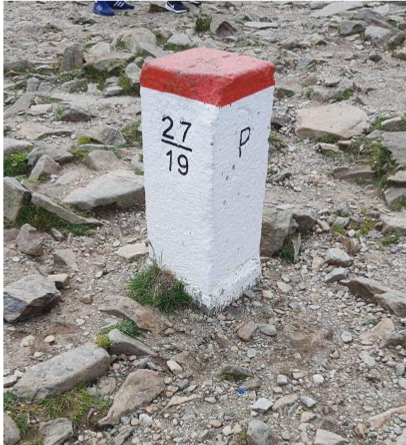
Obrázek 3 - Fotografie hraničního značení s využitím umělých hraničních znaků. Situace značení státní hranice České republiky a Polska na vrcholu kóty Sněžka, (Červenec 2022).

Činnosti Katastrálního úřadu vymezuje ustanovení §3 odst. 1 zákona č. 200/1994 Sb., o zeměměřictví a o změně a doplnění některých zákonů souvisejících s jeho zavedením, jako činnosti při budování, obnově a údržbě bodových polí, podrobné měření hranic územně-správních celků a nemovitostí a dalších předmětů obsahu kartografických děl, vyhotovování geometrických plánů a vytyčování hranic pozemků, vyměřování státních hranic, tvorba, obnova a vydávání kartografických děl, standardizace geografického názvosloví, vedení dat v informačních systémech zeměměřictví včetně dokumentace a archivace výsledků zeměměřických činností. 26