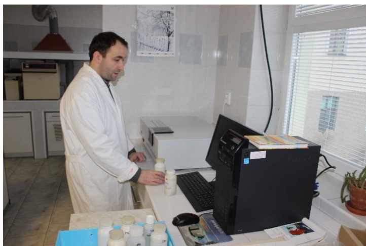
Obr. 3. Práce na rtuťovém analyzátoru AMA 254, EMPLA AG a.s.