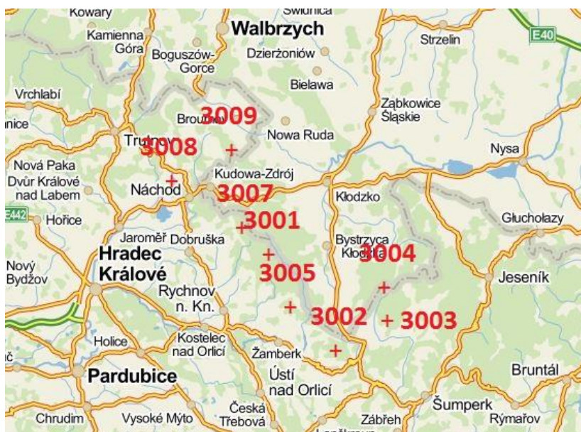
Obr. 2. Vyznačení referenčních bodů v rámci biomonitoringu toxických kovů sledované česko-polské přeshraniční oblasti [22].