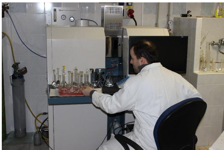
Obr. 4. Práce na ICP OES Integra XL2, GBC, EMPLA AG a.s.