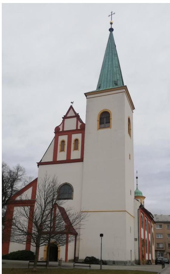
Zdroj: archiv autorky