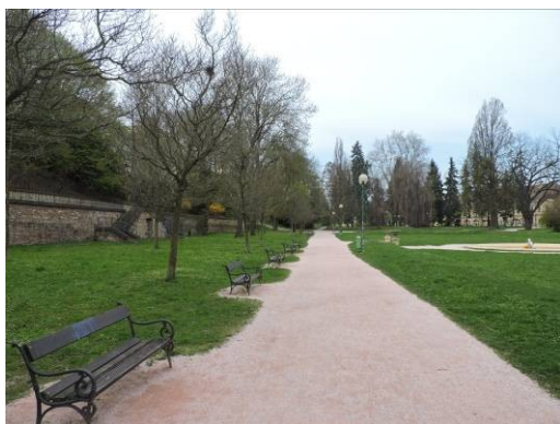
Obr. 22 – Žižkovy sady