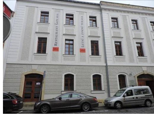
Obr. 2 – Restaurace Šatlava