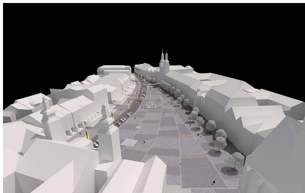
Obr. 25 – Plán Velkého náměstí

Zdroj: http://g.denik.cz/17/5b/architekti_velke_namesti_krejcik_4_galerie-980.jpg