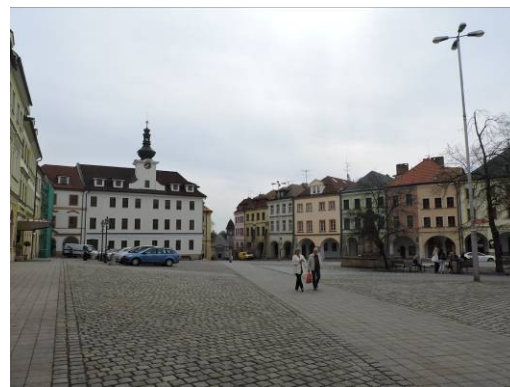
Obr. 15 – Malé náměstí