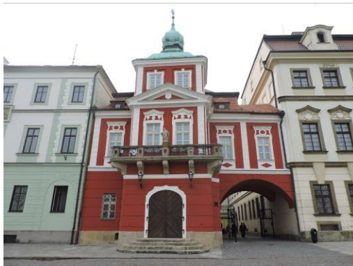
Obr. 21 – Dům u Špuláků