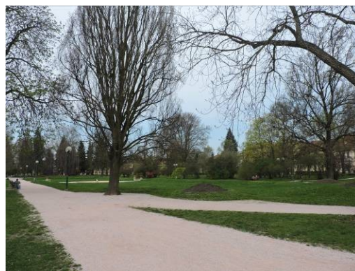
Obr. 23 – Žižkovy sady