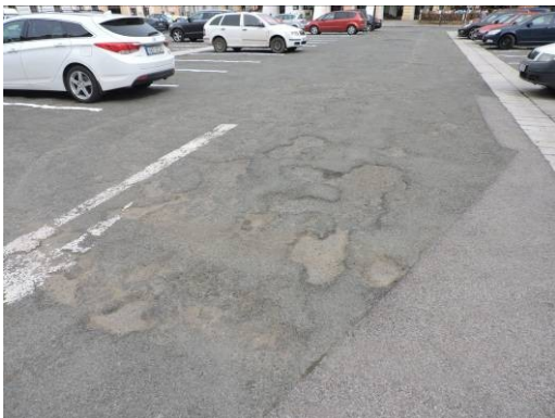
Obr. 5 – Parkoviště