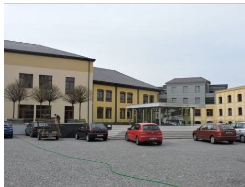
Obr. 20 – Administrativní centrum