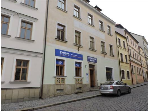
Obr. 1 – Penzion Arto