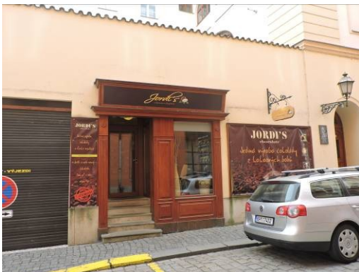
Obr. 3 – Čokoládovna Jordi's