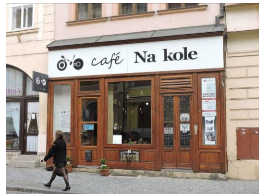
Obr. 4 – Café na kole