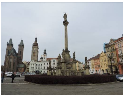
Obr. 13 – Morový sloup