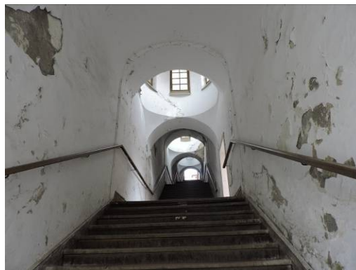
Obr. 12 - Bono publico