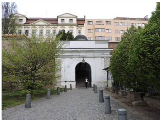
Obr. 11 – Bono publico