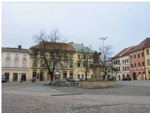
Obr. 14 – Malé náměstí