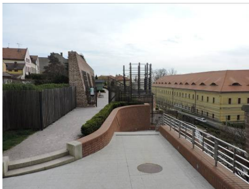
Obr. 16 – Opravené schodiště