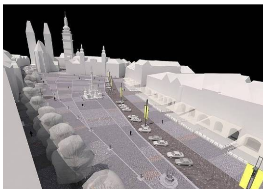
Obr. 24 – Plán Velkého náměstí