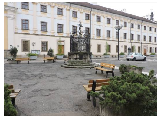
Obr. 6 - Parkoviště