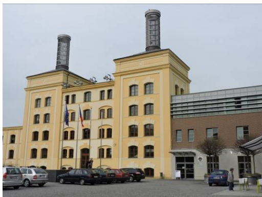
Obr. 19 – Pivovarské náměstí