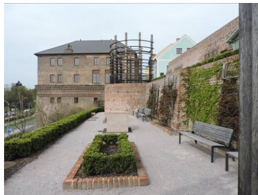
Obr. 17 – Opravené terasy