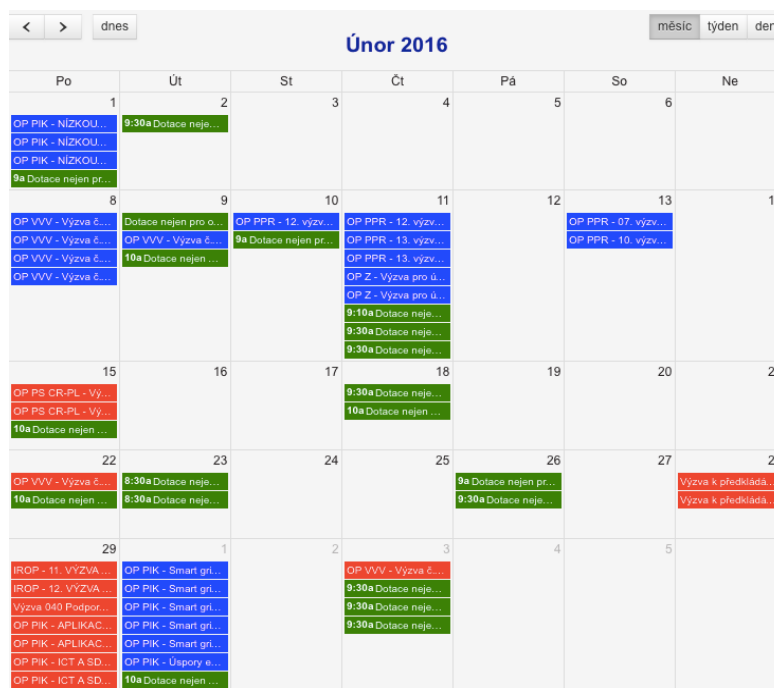
Obr. 4 - Harmonogram výzvy na rok 2016 únor 28

Žádost k získání ve finančních prostředků nelze podávat celoročně. Možnost podávání žádostí je podmíněno vypisování jednotlivých výzev ze strany EU. V těchto výzvách najdeme přesně definované podmínky pro podání žádosti, jako například pro koho je určen program podporovaných oblastí, definici oprávněných žadatelů, časové nastavení, míra podpory a územní zaměření. Žadatel by měl ve svém vlastním zájmu sledovat konkrétní výzvy, které vypisuje řídicí orgán. Harmonogram bývá zveřejněn s půlročním předstihem na webových stránkách řídicích orgánů a bývají průběžně aktualizovány. 27