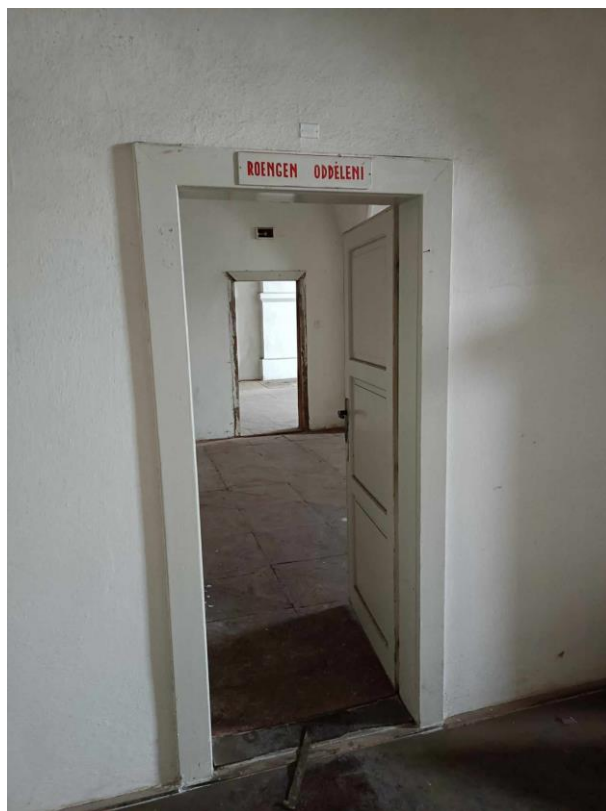
Obrázek 2: Rentgenové oddělení (Zdroj vlastní)

„Přiznávám, že při všech trpkostech, které jsem zažil v oněch těžkých dobách válečných, žilo se mi mezi tolika dobrými našimi lidmi velice dobře a patří toto mé působení v Terezíně mezi nejkrásnější v mém životě!“ 91 Je velice smutné, že doktor Levit končí své vzpomínky takto, neboť jak je psáno na začátku kapitoly, doktor Levit se do Terezína zpátky vrátí, tentokrát ale jako vězeň nacistického režimu. 92