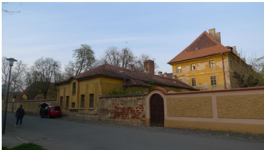
Obrázek 4: Budova nemocnice dnes

O nemocnici samotné se vedou diskuze, jak by se s budovou mělo pracovat dále, ale ve výsledku zůstává ve stále žalostném stavu.