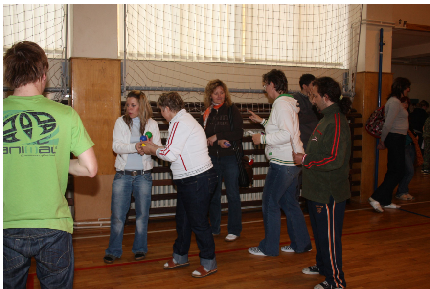
Obr. č 5: Sportovní den 2010 na SŠZP v Klatovech.