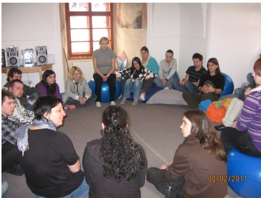
Obr. č. 6: Supervize se studenty pořádanou organizací TOTEM.