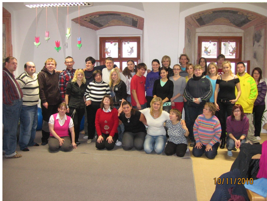
Obr.č. 1: Společná fotografie uživatelů DS a žáků SŠZP.