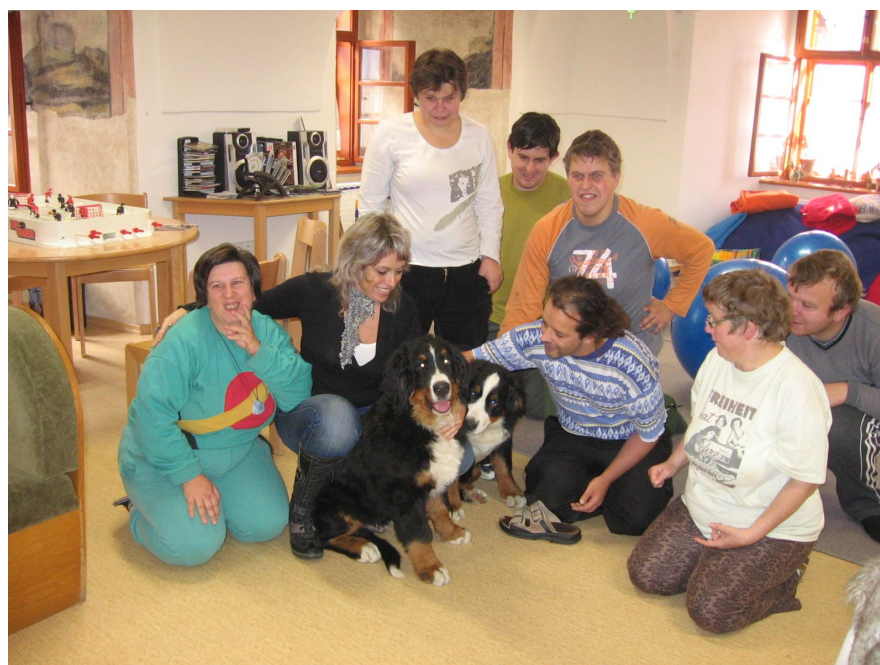
Obr. č. 2: Fotografie uživatelů DS – canisterapie.