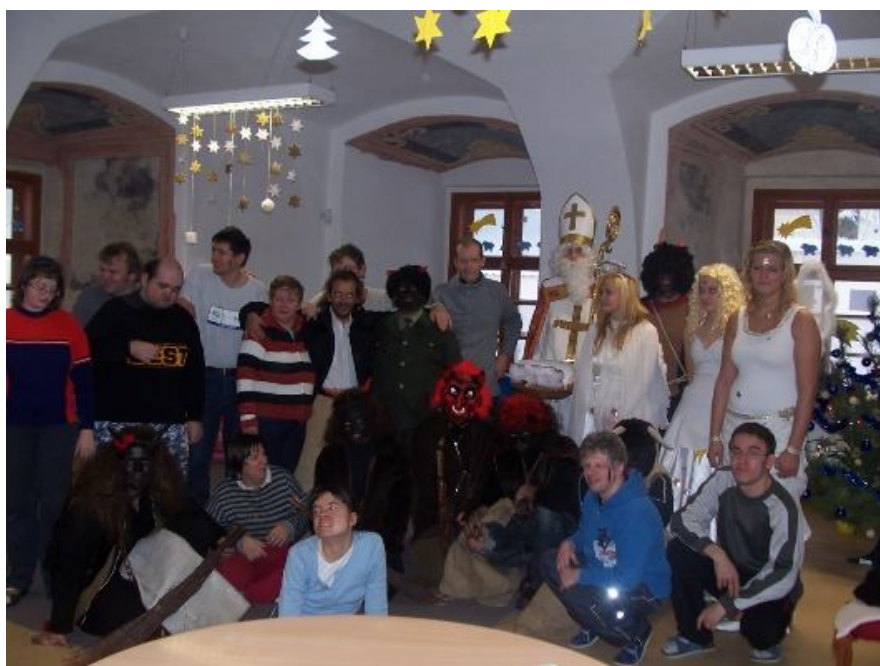
Obr.č.3: Čerti v denním stacionáři v roce 2011.