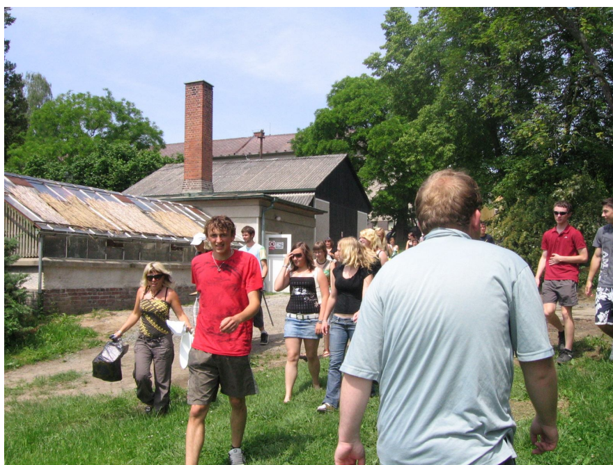
Obr. č. 4: Táborák, kteří pro uživatele DS uspořádali studenti.