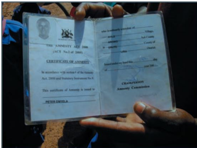
Zdroj: Allen 2006: 75