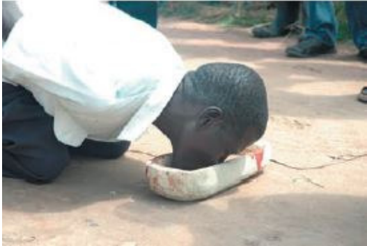
Obr.č. 3: Rituál mato oput, pití hořkého kořene