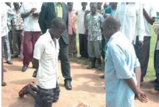
Zdroj: Allen 2006: 161