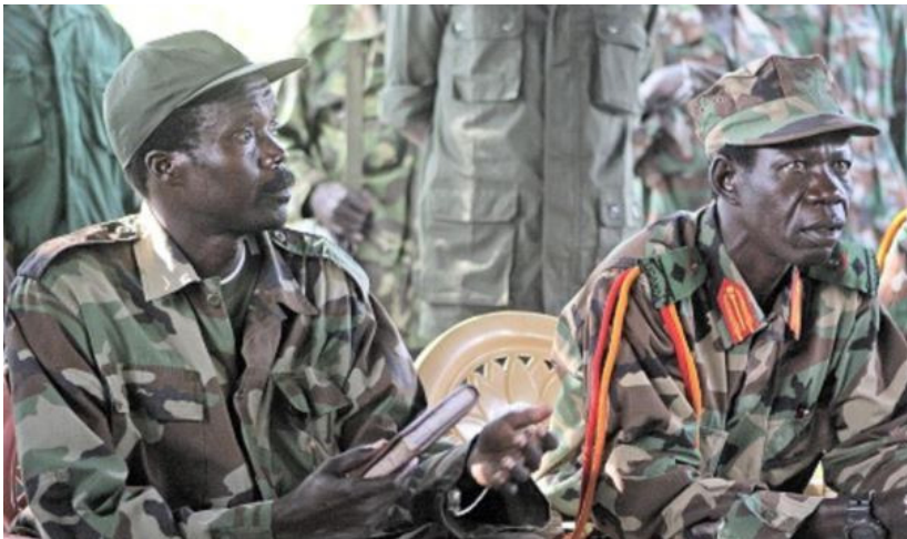
Obr.č. 4: Vlevo Joseph Kony a napravo Vincent Otti na mírových jednání v Jižním Súdánu 2006