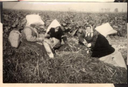
Ukázka Kroniky z roku 1950