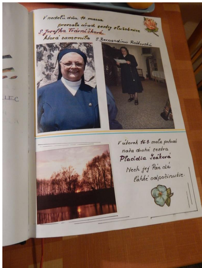
Ukázka z Kroniky od roku 2005