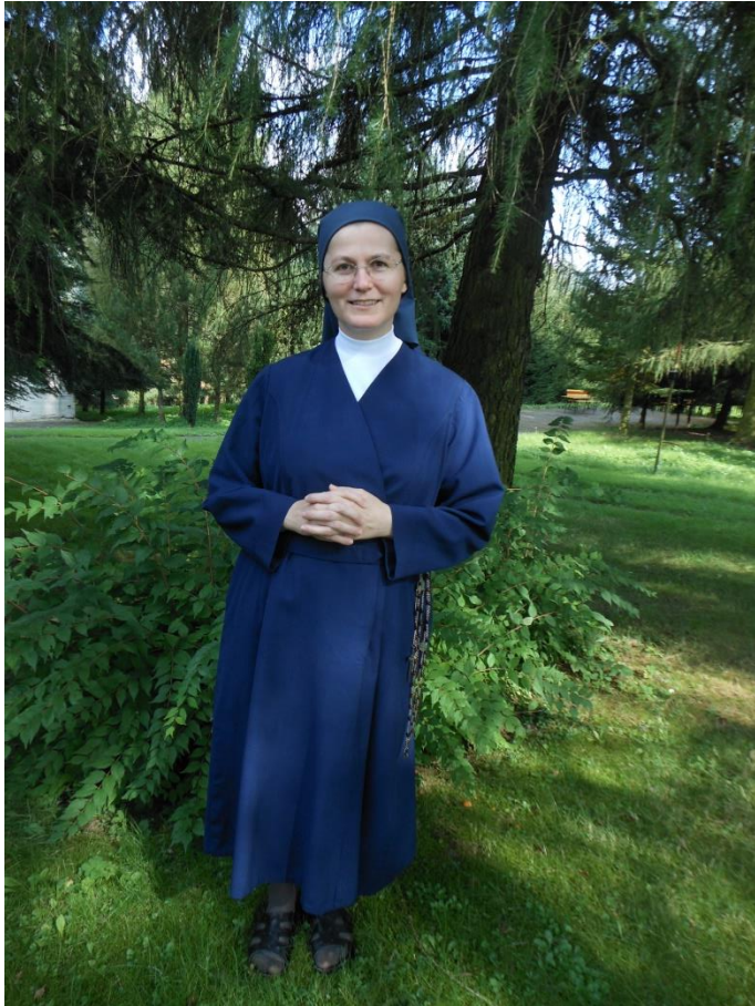
Dnešní podoba řeholního oděvu