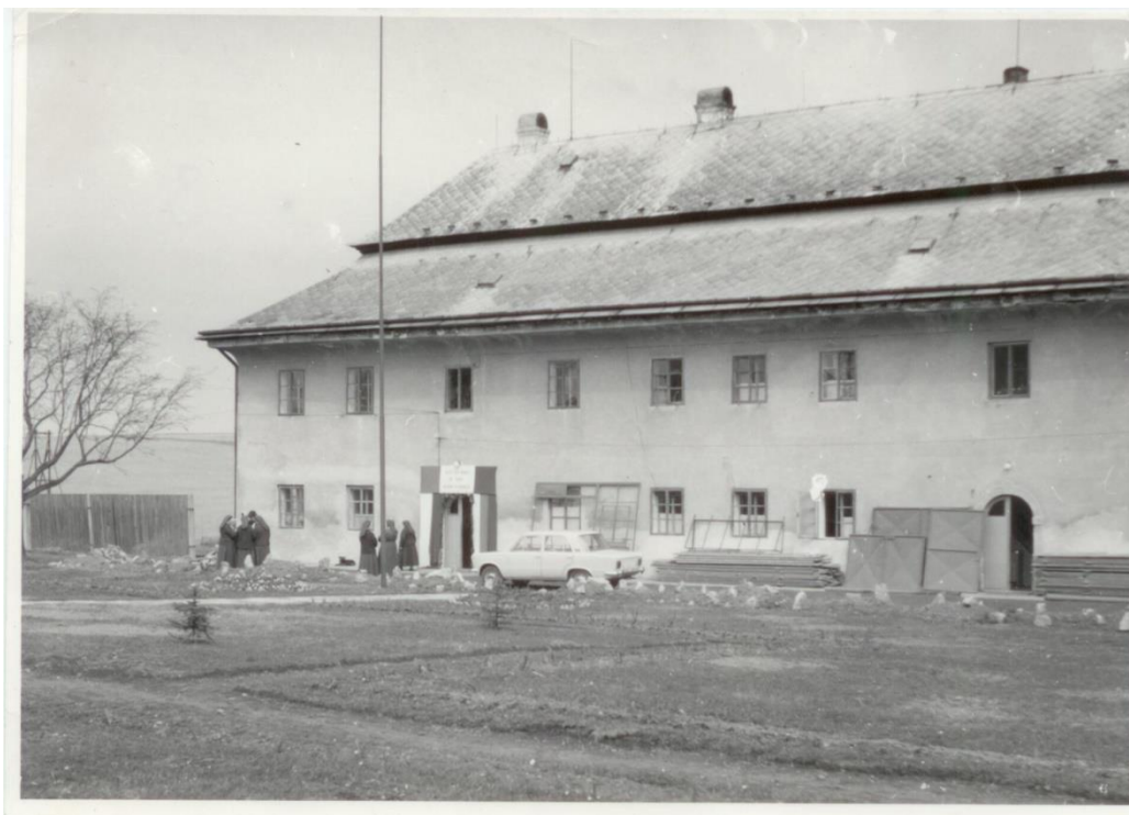
První roky v Mendryce