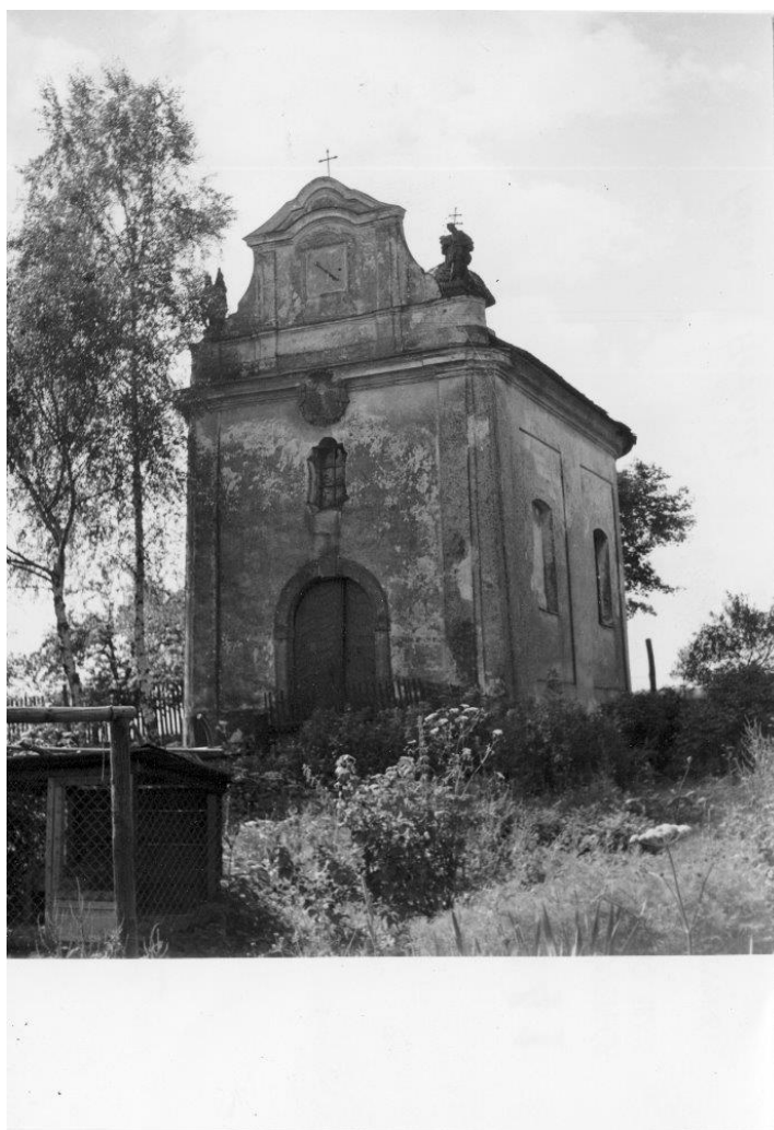
Historické foto Mendryky před příchodem sester