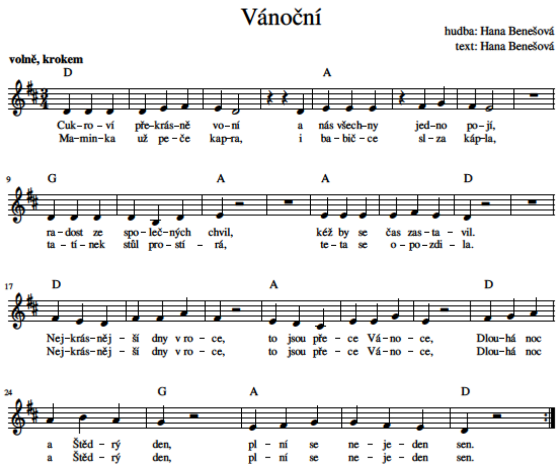
Obrázek 4: notový zápis písně Vánoční