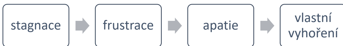
Obrázek 2 Fázový model dle Šudentové

neexistuje. Naopak někteří zaměstnanci vykonávají svojí práci naplno, ale dokážou určit, kde jsou hranice a bariéry k rozvoji syndromu, proto u nich se syndrom nerozvíjí. Ve druhé fázi, stagnaci, se ocitá člověk, který se seznámil s realitou a přijal ji, často po prožitém zklamání. Na základě toho začíná měnit své úvodní představy. Nadále vykazuje práci, ale ta už pro něj není tak strhující, jako tomu bylo na počátku. Do popředí jeho zájmu se začínají dostávat platební podmínky a možnost kariérního růstu, které ze začátku nepovažoval za důležité. Celý jeho život je jeho zaměstnání, a tak rodinný život se dostává do obtíží. Ve stagnaci si postižený ani jeho okolí neuvědomuje, že jsou to příznaky syndromu vyhoření. Ve fázi frustrace se člověk začíná pochybovat o svém výkonu v práci a má pocit bezmoci při výkonu své práce. Začíná pochybovat o vykonané práci a nedostává se mu uznání ze strany zákazníků nebo nadřízeného. Z důvodu rozporu mezi jeho závazky a praktickou dovedností roste jeho zklamání. Člověk ve fázi apatie vnitřně rezignuje to je přirozená obranná reakce na frustraci. Jeho práce ho nenaplnuje a je dlouhodobým zdrojem zklamání. Převládá v něm pocit, že není žádná naděje na změnu. Proto pracuje a dělá, co je nezbytně nutné, vyhledává pouze jednodušší úkoly a omezuje přímý kontakt se zákazníky nebo se snaží rychle vše vyřídit. V této fázi jeho počáteční nadšení postupně mizí a nastává zoufalství způsobené nedostatek jiných alternativ k prosazení.