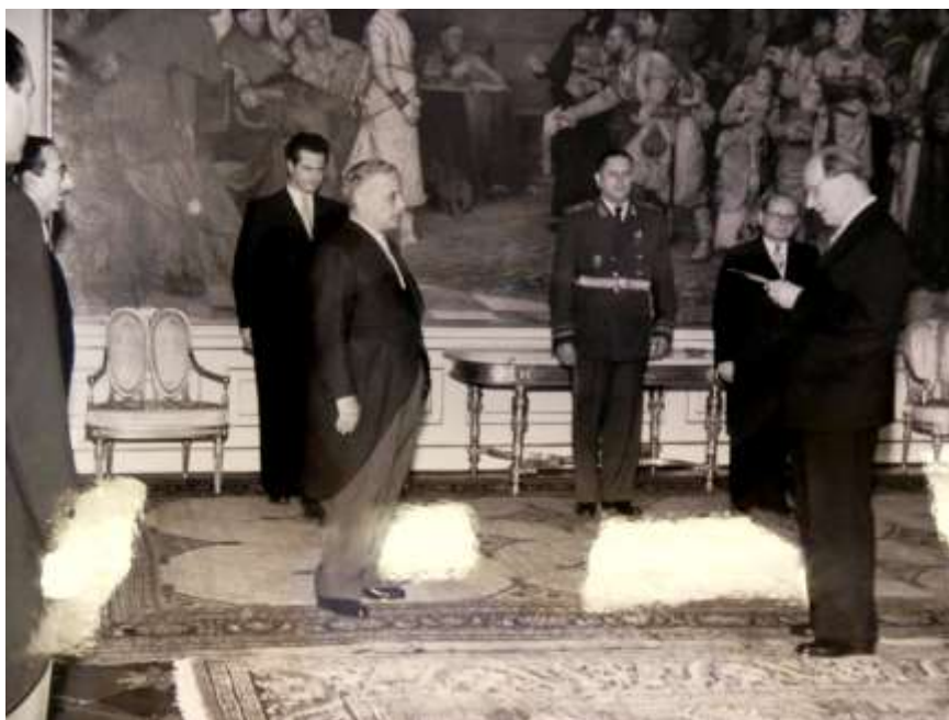
Amin Taha Aboul Dahab, jeho příchod na Pražský hrad a jmenování vyslancem v červnu 1954.