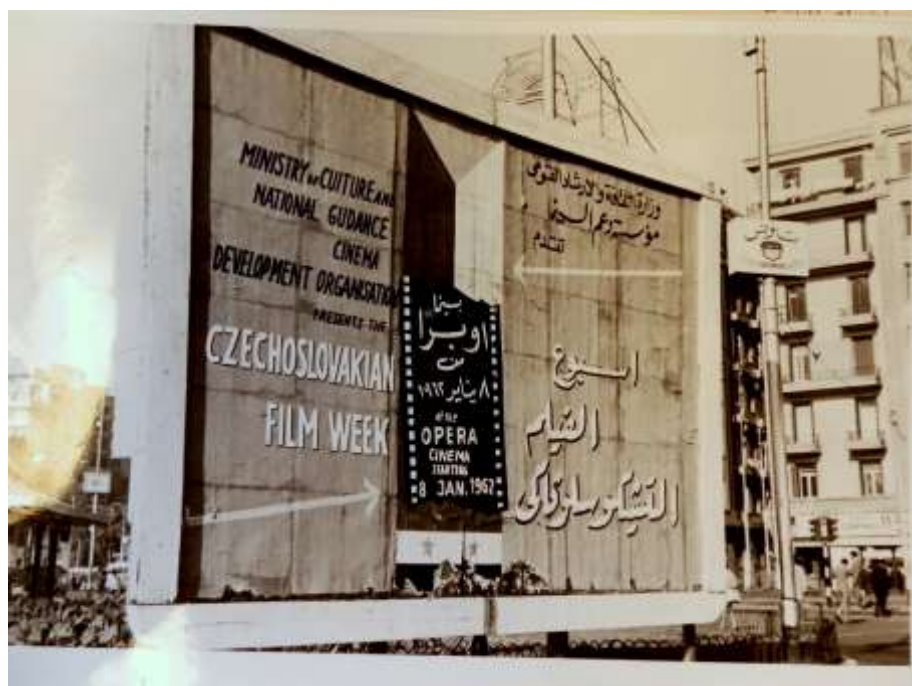
Propagace k československému týdnu filmu v Egyptě v roce 1962.