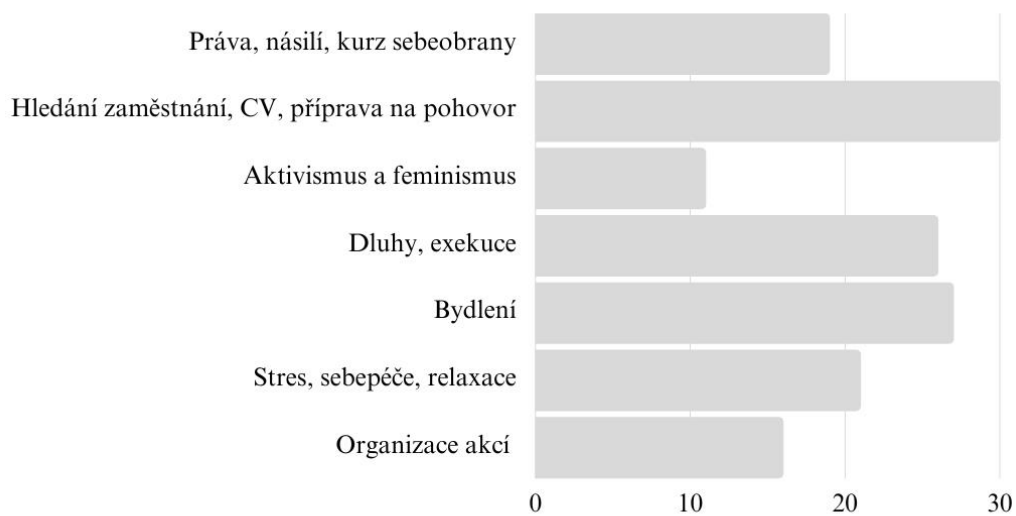
Obrázek 3: Výsledky atraktivnosti témat v rámci klíčové aktivity průběh skupiny

předložil návrhy témat a ženy měly vybrat ty, kterých by se v rámci fungování skupiny zúčastnily. Z průzkumu sledující atraktivnost o jednotlivá témata vyplynulo následující.