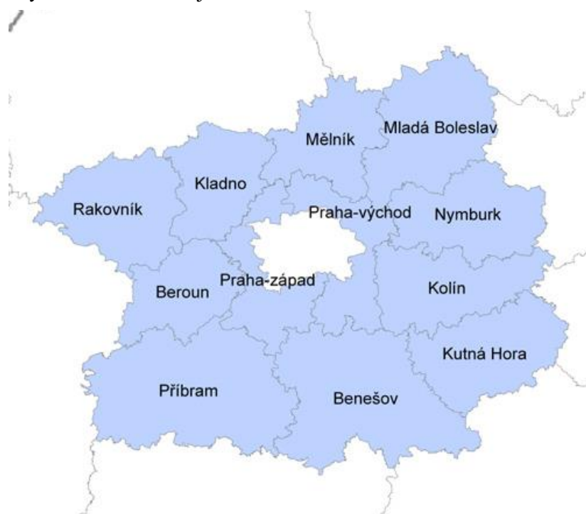
Obrázek 1: Okresy Středočeského kraje