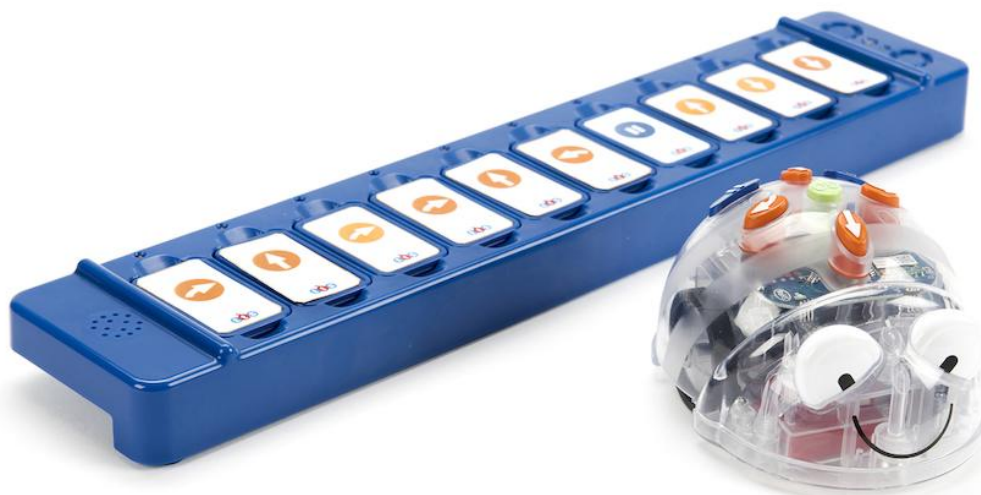
Obrázek 1 Blue-bot (Infráček.cz)

U menších žáků je možné využití robotických hraček – Blue-botů (Obrázek 1) či Bee-botů (Obrázek 2).