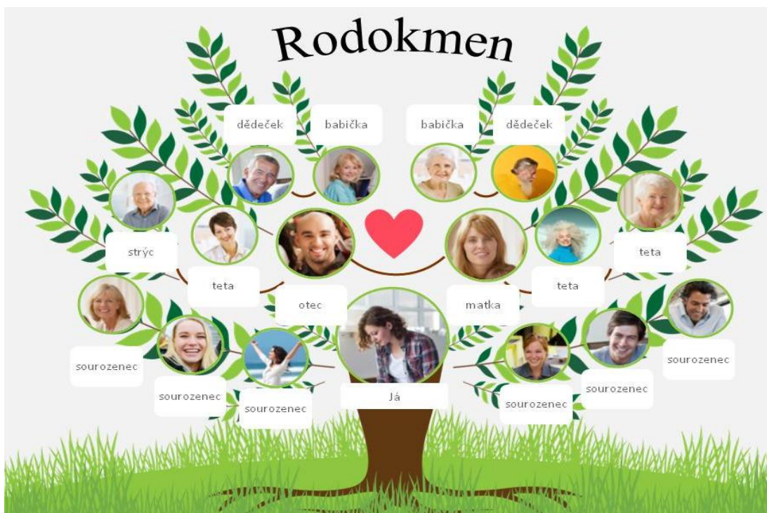
Obrázek 4 Rodokmen (verze 2)