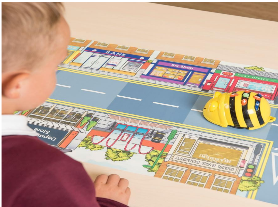
Obrázek 2 Bee-bot

Robotické včelky (Bee-boti a Blue-boti) jsou programovatelné robotické hračky využitelné i v jiných předmětech. Rozvíjí logické myšlení, infromatické myšlení, pomocí jednoduchých úkolů přibližují žákům základy algoritmizace a programování. Blue-boti jsou doplněni o bluetooth připojení, které umožňuje robota programovat i vzdáleně přes různá dotyková zařízení či počítač.