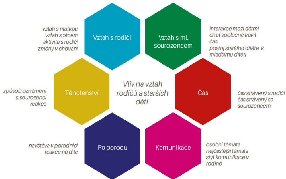
Schéma 1: Ukázka témat otázek

Dohromady má rozhovor pro starší dítě 42 otázek.