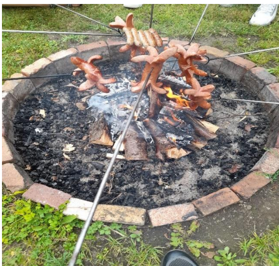
Obrázek 8: Opékání buřtů