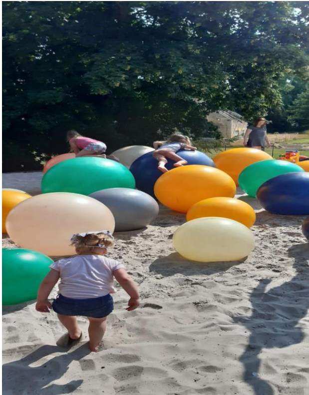
Obrázek 6: Hra na trampolínách a míčích