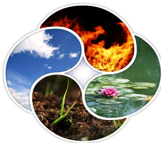
Obrázek 4: Přírodní živly (Bilková 2020)

Příměstský tábor bude zaměřen na aktivity dětí s tematikou přírodních živlů Země, Voda, Vzduch, Oheň. Aktivity jednotlivých dní vždy využijí jeden z živlů. Příměstský tábor bude na 5 dní, pátý den spojíme všechny živly dohromady a zopakujeme si, co jsme všechno zažili.