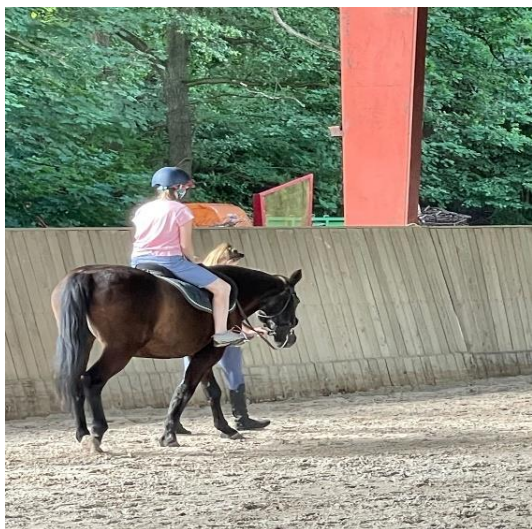
Obrázek 5: Jízda na koni

Na obrázku č. 5,6,7,8 jsou vidět jednotlivé aktivity dětí. Jízda na koni, Využití trampolín a gumových míčů v areálu trampolín, dále pak i chytání pulců, které nebyli v plánu, ale byli součástí lesního koupaliště. Nakonec i opékání buřtů bylo přínosem pro děti, které musely udržet prut s buřtem nad ohništěm, buď ve stoje, nebo ve dřepu.