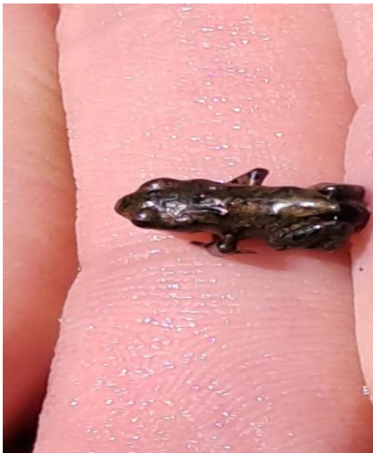
Obrázek 7: Chytání pulců