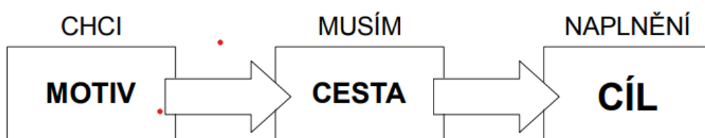
Obrázek 2: Model motivace cesta – cíl (Hanuš 2009)

Motivace má významnou a nezastupitelnou roli v pojetí přírodní výchovy. Motivace je duševní rozpoložení jedince, které vede ke zvýšení či poklesu jeho aktivity, práce. Jde o vůli jedince něčeho dosáhnout a jde o tzv. vnitřní motivaci. Na jedince mohou působit i vnější motivační činitelé a tím jedince ovlivňují, nemusí být spojena vždy s příjemným zážitkem, ale projeví se až při dosažení cíle. Proces motivace je vidět na obr. č. 2. Podněty motivace je možné chápat jako osobní důvody určitého jednání, které vycházejí z nějaké potřeby, jsou často spojeny s emočním prožitkem, který slouží jako signál této potřeby a zároveň jako prostředek hodnocení aktuálního stavu či situac (Hanuš 2009).