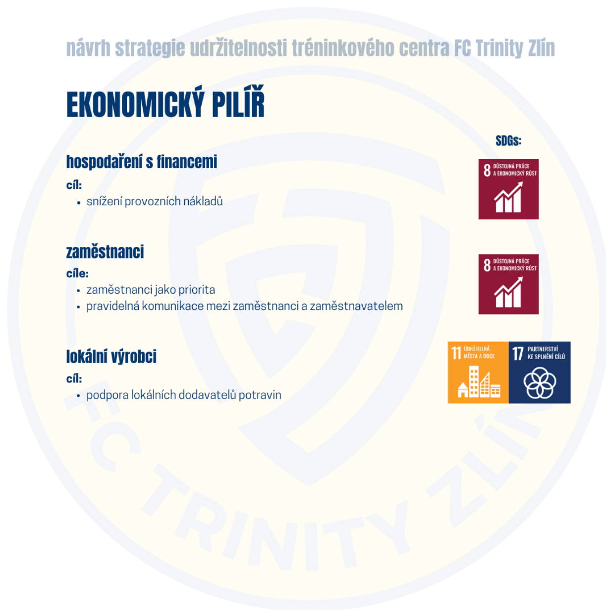
Obrázek 5: Grafický přehled návrhu strategie udržitelnosti – ekonomický pilíř