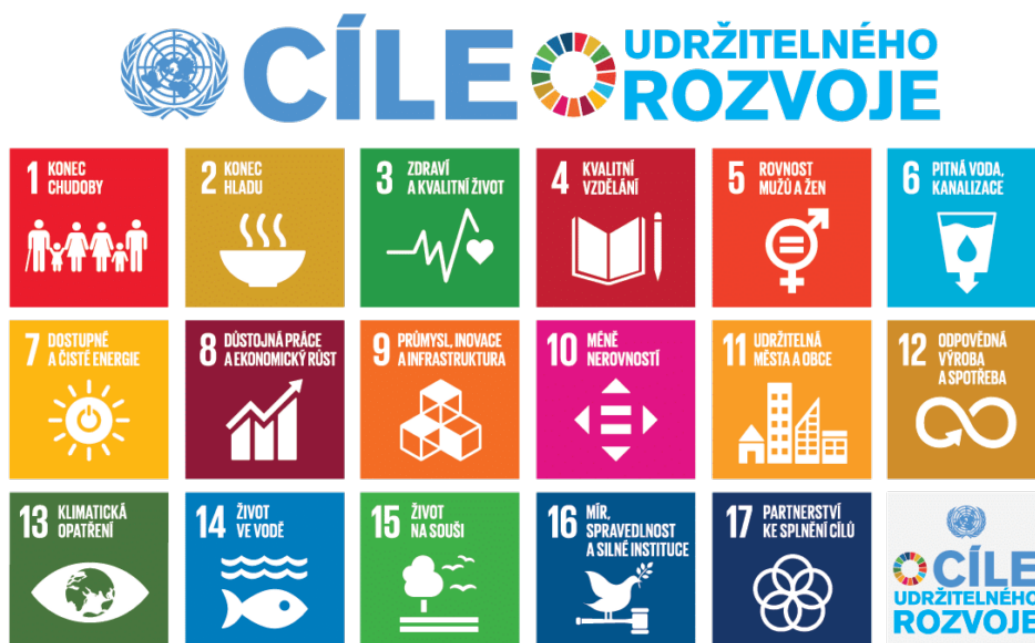
Obrázek 2: 17 cílů udržitelného rozvoje (SDGs)