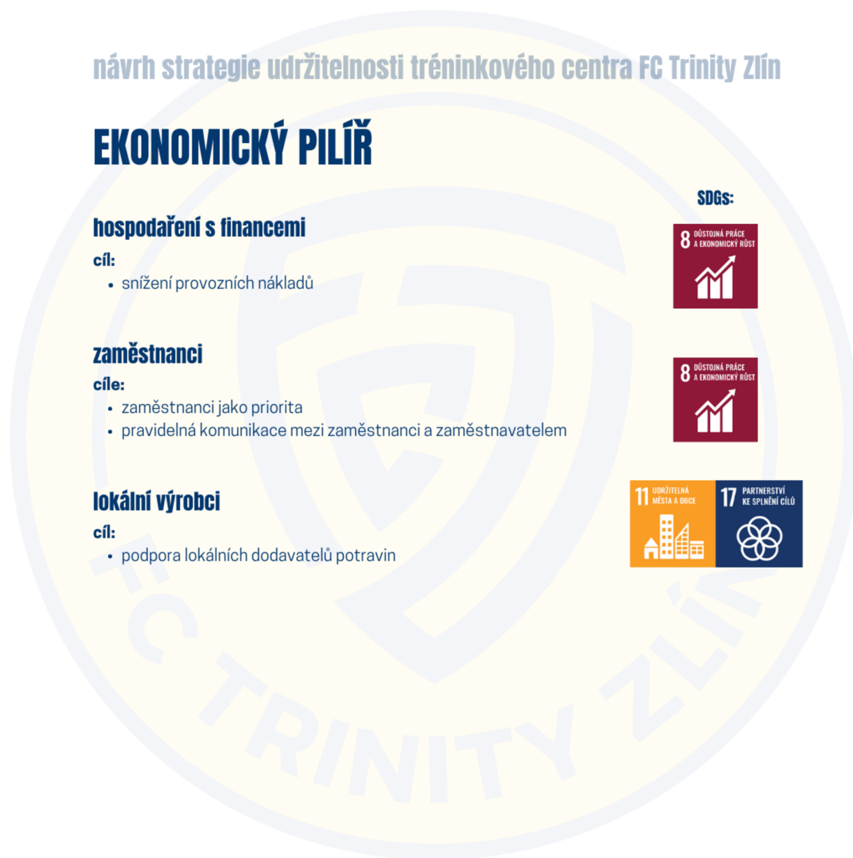
Obrázek 5: Grafický přehled návrhu strategie udržitelnosti – ekonomický pilíř