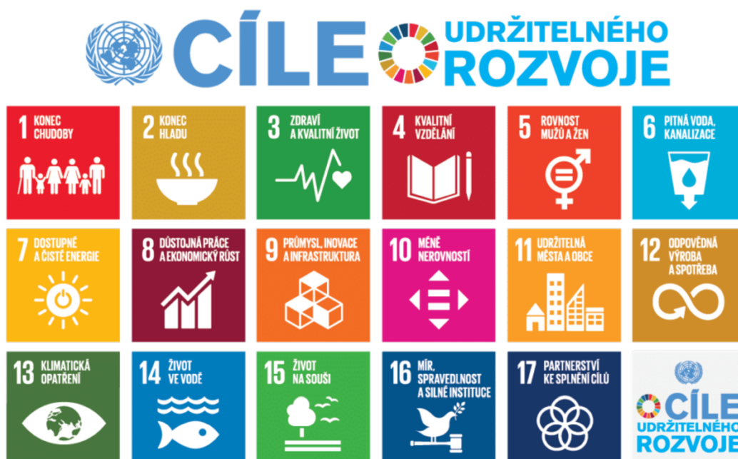
Obrázek 2: 17 cílů udržitelného rozvoje (SDGs)