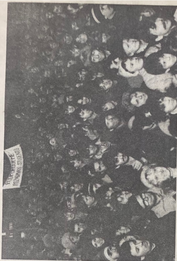
Záběr ze čtvrtečního mítinku občanů a Občanského fóra v Karvině.