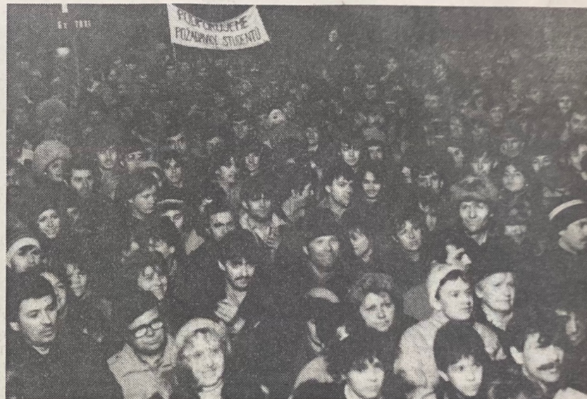
Záběr ze čtvrtletního mítinku občanů a Občanského fóra v Karvině.