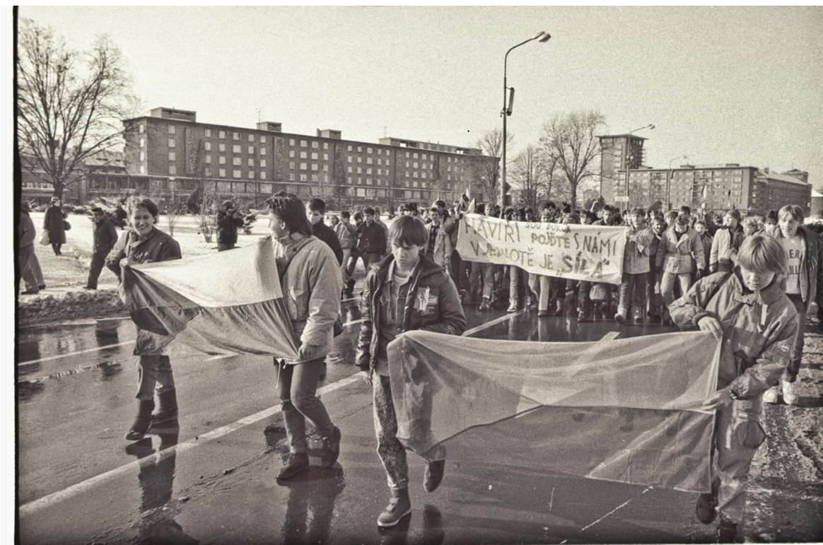
Obrázek 3: Stávka v Havířově.

kteří jsou považováni za viníky klesající popularity strany. Byly zmíněny neadekvátní postoje, výhrůžky Občanskému fóru a organizátorům generální stávky a další chyby