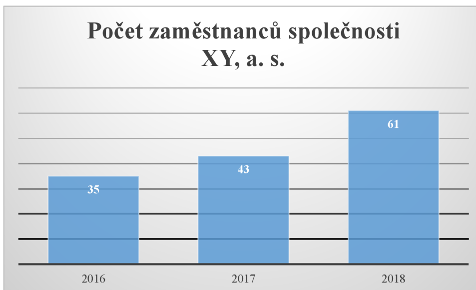
Graf 3: Počet zaměstnanců společnosti XY, a. s. v letech 2016–2018 (Vlastní zpracování na základě interních informací společnosti XY, a. s., 2020)

Graf č. 3 zobrazuje počet všech zaměstnanců společnosti XY, a. s. Ve sledovaném období je patrný vzrůstající trend, kdy se počet zaměstnanců v roce 2018 oproti roku 2016 téměř zdvojnásobil.