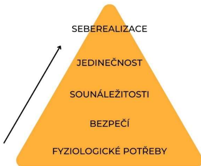
Obrázek 2: Maslowova pyramida potřeb