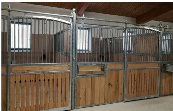
Obrázek 5 - výplň stěny boxu s průduchy

vhodného mikroklimatu v boxu (Fraser 2010). Nejčastější provedení této formy spodní výplně boxů je znázorněno na obrázku 5.