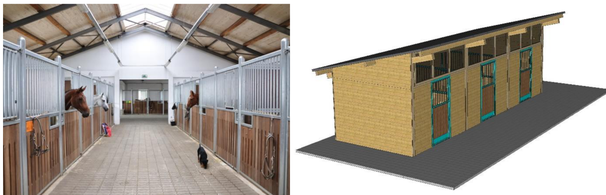
Obrázek 6 - porovnání konstrukčního řešení vnitřních a venkovních (anglických) boxů

Dalším častým řešením jsou takzvané anglické boxy. Tyto boxy jsou venkovní, nejčastěji jednořadé, těsně spolu sousedící, kdy dveře z boxu jsou púlené s východem přímo ven na dvůr, paddock či jiný volný prostor. U anglických boxu je jednodušší a individuálnější řešení mikroklimatu a jsou vhodné hlavně pro koně s respiračními potížemi. Avšak pro manipulaci a management, především při nepříznivém počasí jsou rozhodně lepší vnitřní stáje. U mnoha sportovních koní bylo pozorováno klidnější chování ve vnitřních stájích než ve venkovních anglických boxech, tento poznatek je ale ovlivněn řadou dalších faktorů (Bridová 2004). Srovnání vnitřních a venkovních typů boxového ustájení je znázorněno na obrázku 6.