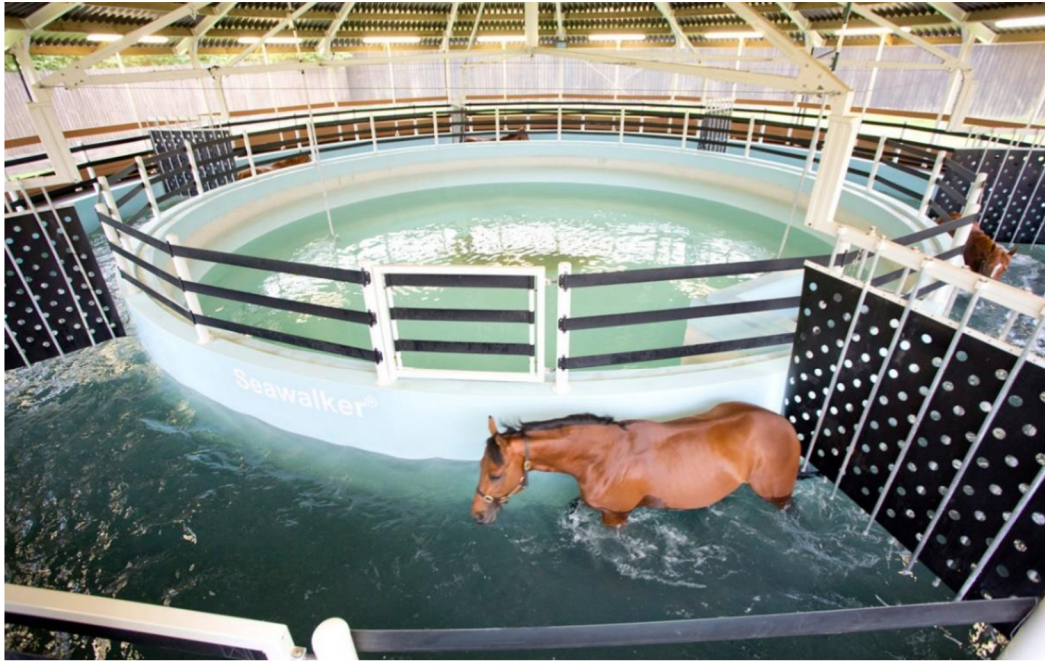
Obrázek 7 - kolotoč napuštěný vodou pro zefektivnění pohybu koně

( https://www.equinehealthcentre.com/welfare-is-paramount/ )