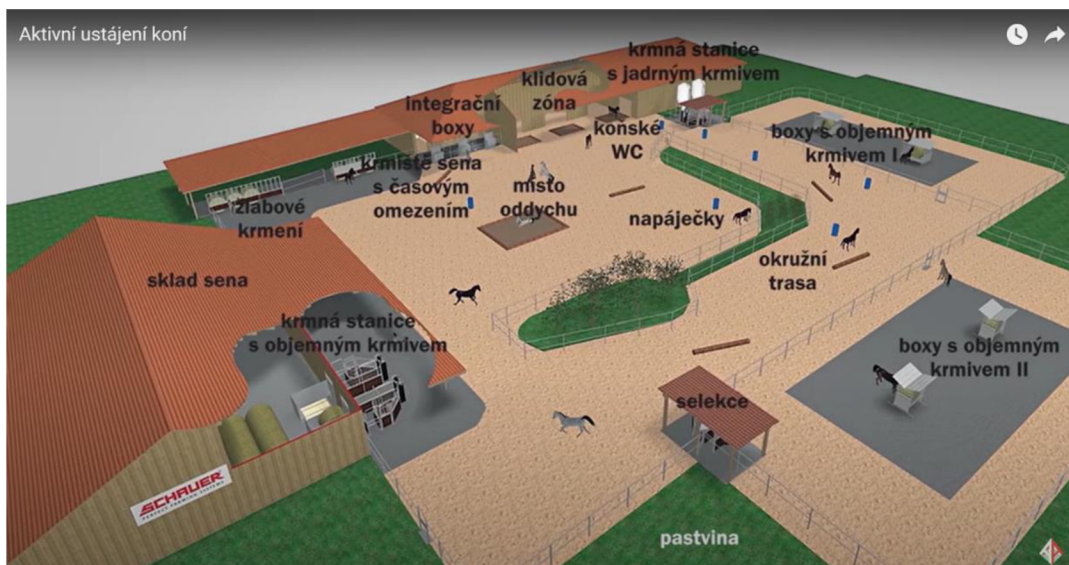
Obrázek 8 - plánek aktivního ustájení

( https://www.youtube.com/watch?v=uOwgAfD5ZW0 )