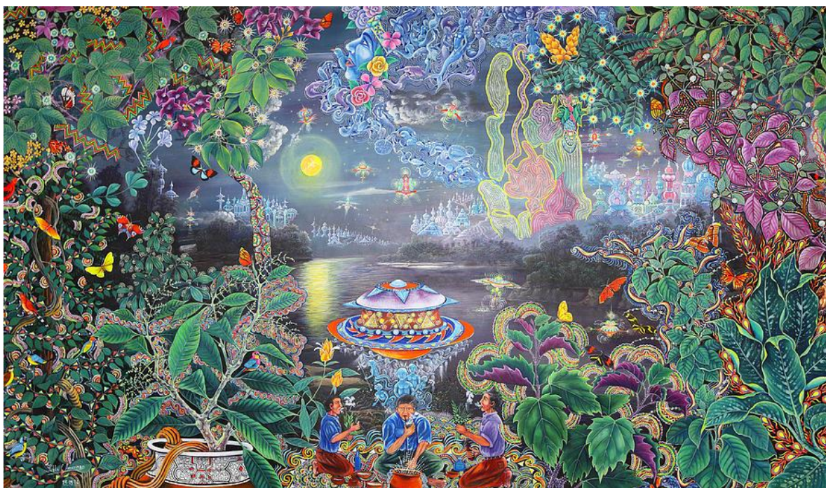
Obraz ayahuaskové vize, který namaloval ayahuasquero Pablo Amaringo 240