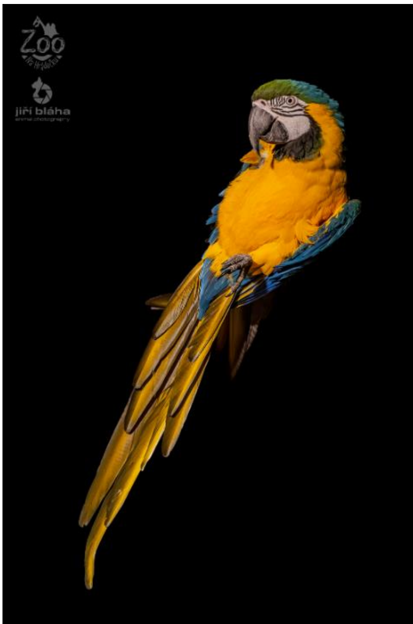
Obrázek 1.1: Ara ararauna

Všichni arové mají dlouhé ocasy a nahou lícní oblast na obličejí kolem zobáku (Silva, 2018). Modří arové byli od rodu Ara odděleni a tvoří samostatný rod ( Anodorhynchus ). Na základě hlasových a letových schopností arů červenoramenných ( Ara nobilis ) byl pro tyto malé ary vytvořen rod Diopsittaca (Lepperhoff, 2017).