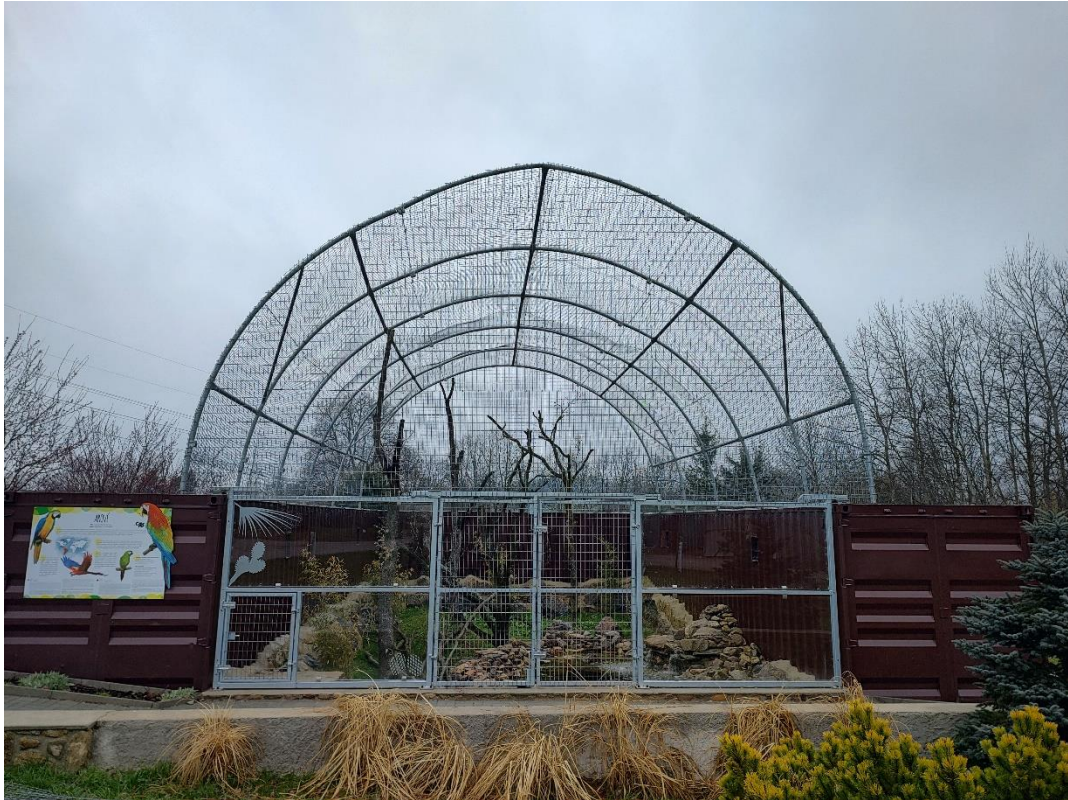
Obrázek 5.1.: Chovatelské zařízení arů v Zoo Na Hrádečku (foto Eliška Dušková)