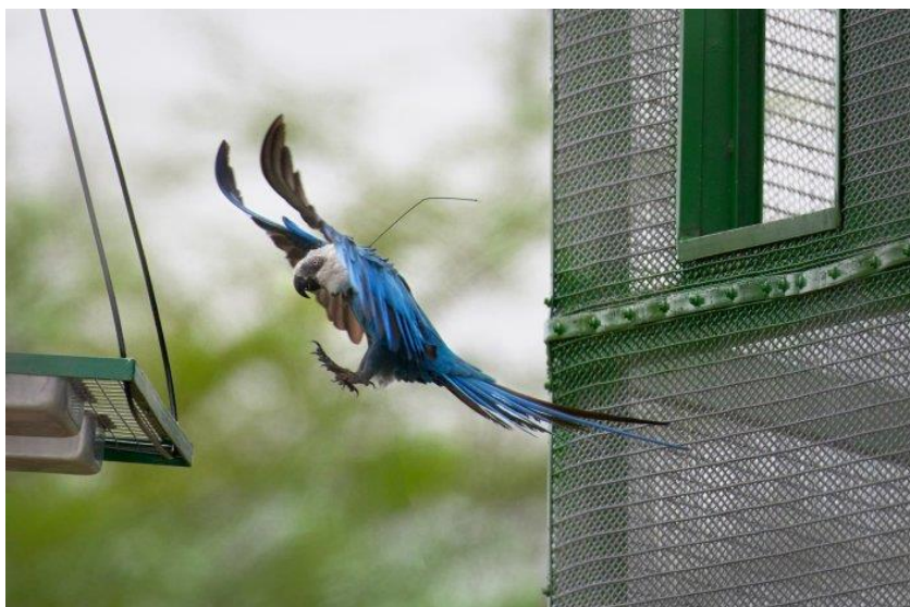
Obrázek 1.4: Vypuštění ary škraboškového v Brazílii