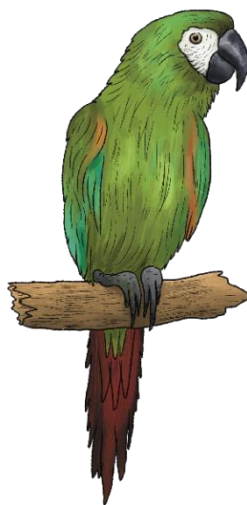
Obrázek 2.4: Ara malý (kresba Daniel Kyncl)

V mezinárodním obchodu není ara malý nikterak významným druhem, protože jeho opeření není tak atraktivní, jako opeření velkých druhů arů (Lepperhoff, 2017).