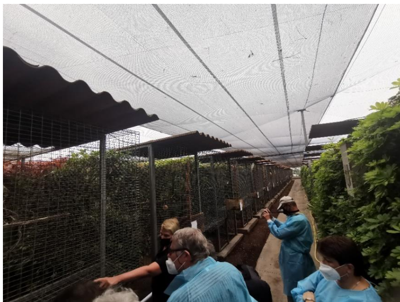
Obrázek 1.3: Centrum La Vera, Tenerife 2021