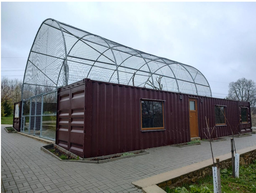
Obrázek 5.2.: Chovatelské zařízení arů v Zoo Na Hrádečku