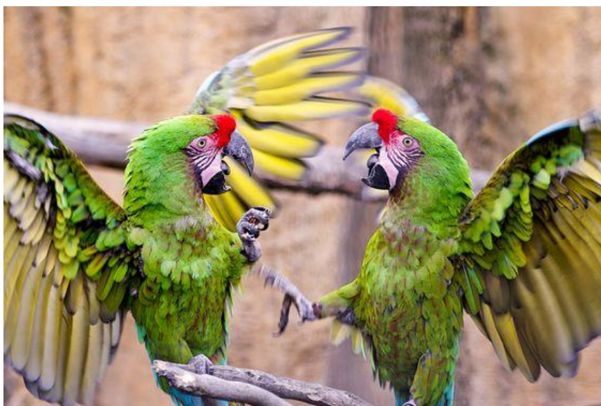
Obrázek 6.1: Rozepře arů zelených v Rotterdam zoo (Michael van Eden)

Závěrem práce bych ráda zmínila, že na základě dostupných informací z literatury se nám v Zoo Na Hrádečku prozatím podařilo sestavit harmonické hejno arů. Jeho fungování ale může být do budoucna ovlivněno hnízdní sezónou či změnou chování některých jedinců vlivem hormonálních změn v procesu dospívání. I přes tento fakt věříme, že jsme arům dopřáli dostatečně velký prostor a jednotlivé páry si v době hnízdění nebudou navzájem vadit. Pevně doufám, že se chov a odchov u námi chovaných arů bude dařit.