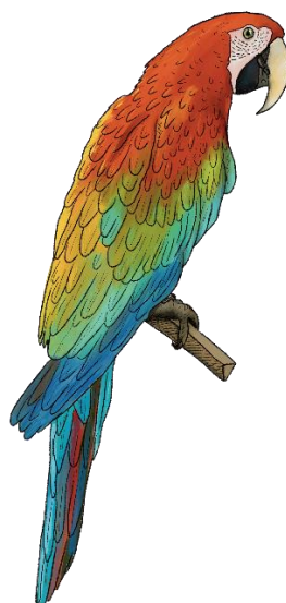
Obrázek 2.3: Ara zelenokřídlý (kresba Daniel Kyncl)

V současnosti probíhá pokus o jeho navrácení do přírodní rezervace Iberá v Corrientes (Berkunsky a di Giacomo, 2015).