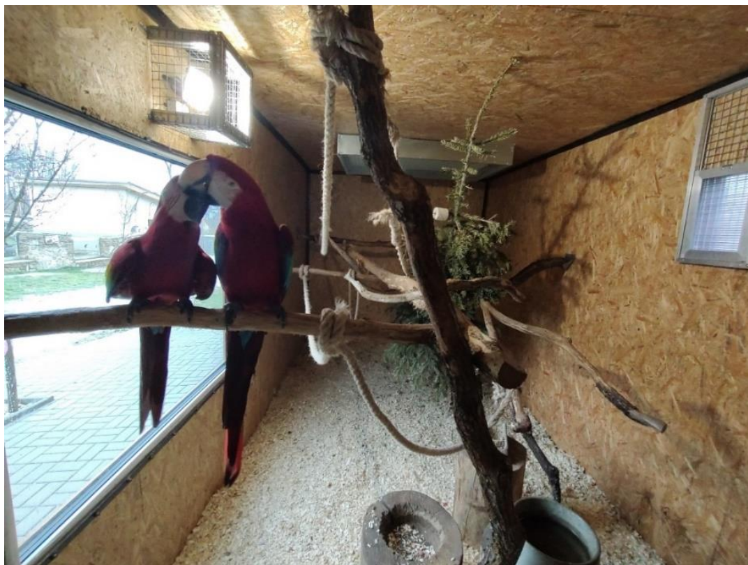
Obrázek 4.1: Harmonizující pár arů zelenokřídlných v Zoo Na Hrádečku

Dalším vhodným opatřením pro harmonické sestavení voliéry je její členitost. Ta hraje velkou roli, jelikož díky ní mají chovaní jedinci dostatek prostoru i sami pro sebe. Zajímavou voliéru popisuje ve své knize Lars Lepperhoff (2017) následovně. „Ve svém zařízení pro chov arů jsem vystavil voliéru o velikosti 6 × 6 × 4,5 m, která dále byla ohraničena bočními voliérami o velikosti 3 × 3 × 3 m. Celkově mám tedy utvořenou soustavu tří voliér, které jsou navzájem propojeny šubry ( Šubr – dvířka vyrobená z pevného materiálu jako například plech, která nejsou schopni papoušci zničit. Tato dvířka spojují jednotlivé zálety mezi sebou, ale také oddělují zálet a venkovní voliéru. Pozn. E.D. ). Papoušci si tak mohou proletovat a procházet tímto členitým labyrintem a vždy naleznou vhodný prostor pro svůj život.“