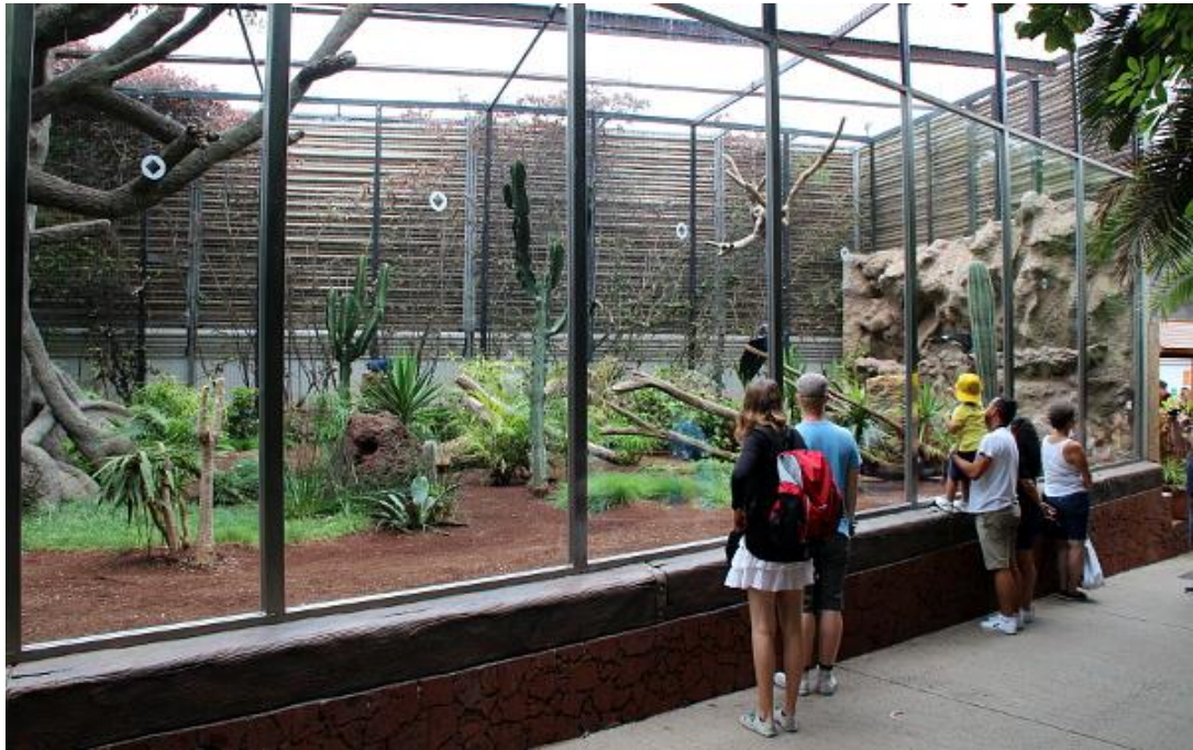
Obrázek 3.2: proletová voliéra ar Loro Parque