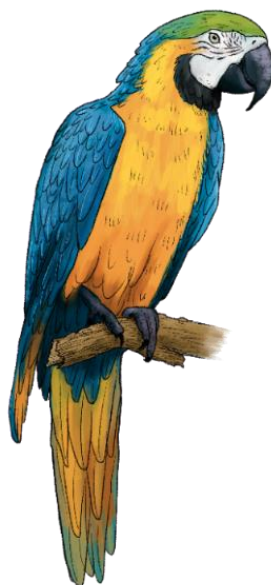
Obrázek 2.1: Ara ararauna (kresba Daniel Kyncl)

Linné (1707-1778) popsal aru araraunu v jeho „Systema naturae“ v edici 10, 1, 1758 na straně 96 a jako oblast původního rozšíření uvedl Jižní Ameriku. Pohlavní dimorfismus není u tohoto druhu vyvinut. Dospělí ptáci dorůstají délky 85 – 90 cm (Lepperhoff, 2017). Samec i samice mají celou svrchní stranu těla a spodní ocasní krovky modré, čelo a temeno hlavy olivově zelené, příušší, strany krku, hrud' a břicho žlutooranžové (Silva, 2018). Nahá lícní oblast a uzdička jsou bělavé a s několika řadami zelenočerných pírek na hrdle a horní části prsou. Ocasní pera jsou modrá, ze spodní strany olivově žlutá. Zobák je šedočerný a nohy tmavě šedé (Lepperhoff, 2017). Druh je robustnější než jeho příbuzný ara kaninda ( Ara glaucogularis ), se kterým byl ara ararauna v minulosti často zaměňován (Silva, 2018).