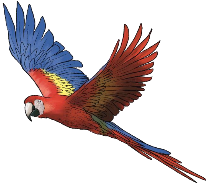
Obrázek 2.2: Ara arakanga (kresba Daniel Kyncl)

K přirozeným nepřítelům arů arakanga patří například tukani bělolící ( Ramphastos v. culminatus ), kteří byli pozorováni, jak z hnízda arů vyhodili čerstvě vylíhlá mláďata a hnízdo obsadili. Rodičovský pár arů arakang se za několik dnů vrátil, vejce tukanů vyhodil a dutinu znovu obsadil (Lepperhoff, 2017).