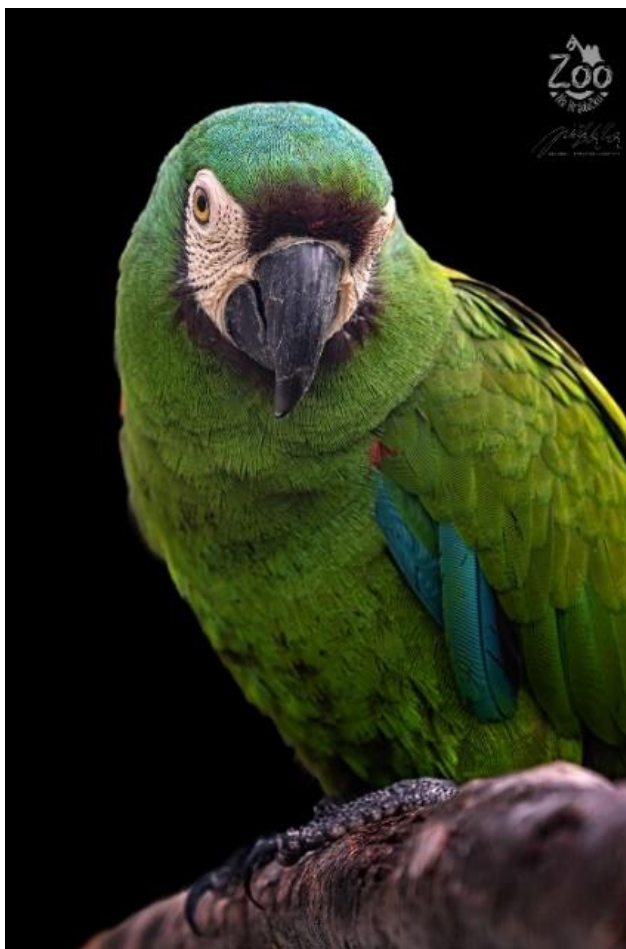
Obrázek 1.2: Ara malý