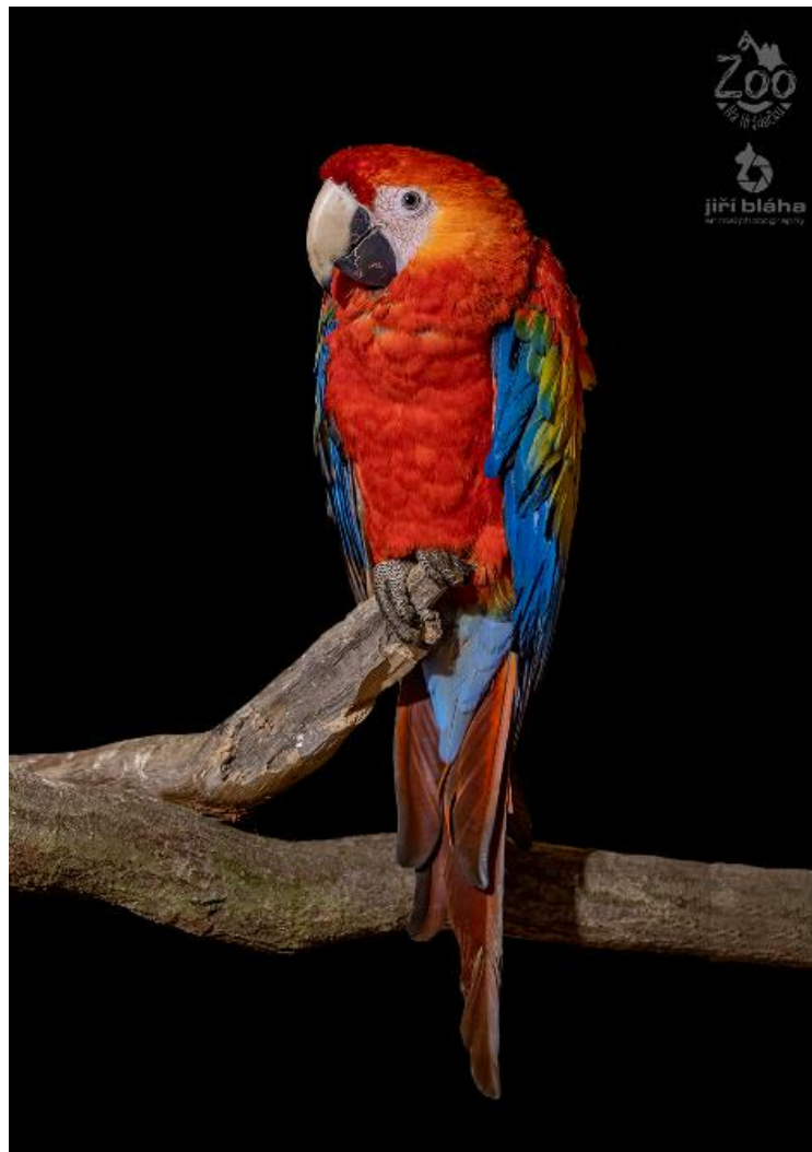
Obrázek 3.1: Ara arakanga

S přibývajícimi poznatky chovu v zajetí se postupně začaly zaplňovat i mezery ve znalostech o biologii arů. Současné znalosti jsou oproti dřívějším mnohem podrobnější, ačkoliv toho spoustu stále nevíme. Čas na prozkoumání určitých druhů se však začíná krátit. Ztráta přirozeného biotopu a další problémy způsobují rychlý pokles některých populací (Silva, 2018).