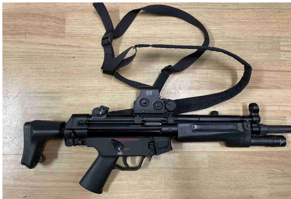
obr. č. 2 – Heckler & Koch MP5 A5 s kolimátorem EOTech, třibodovým popruhem a svítilnou, zdroj: autor práce