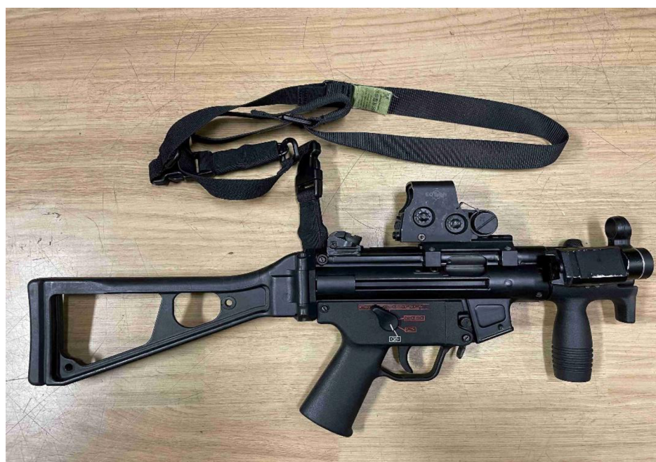
obr. č. 3 – Heckler & Koch MP5 K s kolimátorem EOTech, třibodovým popruhem a svítilnou