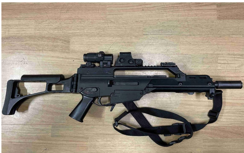
obr. č. 4 – Heckler & Koch G36 C s kolimátorem EOTech, zvětšovací předsádkou (Magnifier 3x), jednobodovým řemením popruhem, tlumičem hluku a svítilnou

5,56 x 45 mm a dosahuje rychlosti střelby 750 ran za minutu. Jedna z hlavních výhod je poměrně nízká váha, jelikož je vyrobena z odolných polymerních vláken. K policejním účelům je využívána především varianta G36 C, která je kratší, kompaktnější nežli „plná verze“ G36, má sklopnou pažbu a velice efektivně ji lze modifikovat. Na útvaru SPJ Praha je na každé zbrani kolimátor od firmy EOTech, Magnifier 3x – zvětšovací předsádka 3x (není na každé zbrani, ale do budoucna se s nimi počítá), úhlová rukojeť Magpul MAG411-BLK, svítilna TLR-1s, jednobodový řemení popruh a tlumič hluku. 66