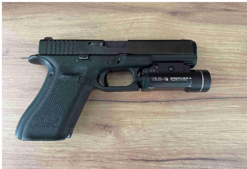
obr. č. 1 – Glock 17 se svítilnou TLR 1s

střelám, se snižuje riziko toho, že náboj prolétne skrz pachatele a zraní další osobu, která stojí v dráze letu za pachatelem. 64