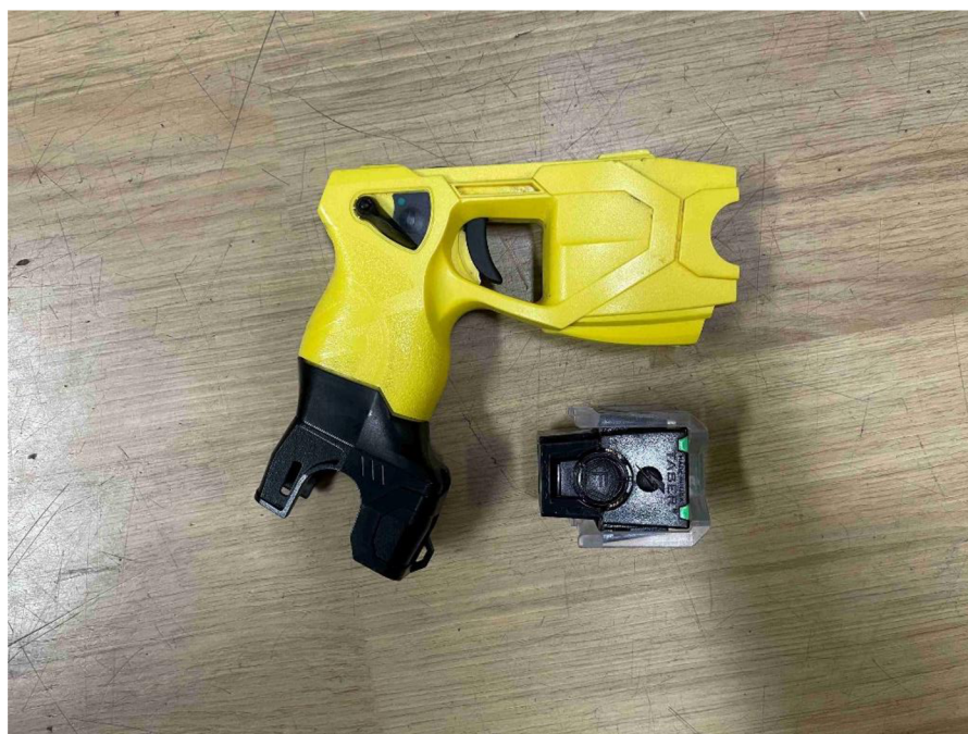
obr. č. 8 – DEP TASER X26P s hlavicí

donucovací prostředek dle ust. § 52 písm. b) a d) zák. 273/2008 Sb. Odbor SPJ Praha užívá variantu X26P v černém a žlutém provedení. Výhodou výše uvedeného Taseru je možnost mít připevněnou záložní hlavici na konci rukojeti. Funkčnost Taseru spočívá ve vystřelení hlavice s dvěma sondami, které se zachytí v cíli a jakmile se uzavře elektrický obvod, dojde k pěti sekundovému výboji a paralýze cíle (nervo-svalové zneschopnění). Při výboji jsou zasaženy pouze příčně pruhované svaly, proto Taser nemá jakýkoliv účinek na činnost orgánů a srdce. Při každém použití Taser zaznamenává některé údaje jako je datum, čas, délka a počet cyklů, venkovní teplotu). Jako další mechanismus při vystřelení hlavice je současně společné vystřelení tzv. Identifikačních štítků, které mají různé barvy a na každém z nich je zobrazeno výrobní číslo hlavice. Použití Taseru by mělo být za podmínek, že použití jiného donucovacího prostředku by bylo zřejmě nedostatečné k dosažení účelu sledovaného zákrokem. 70