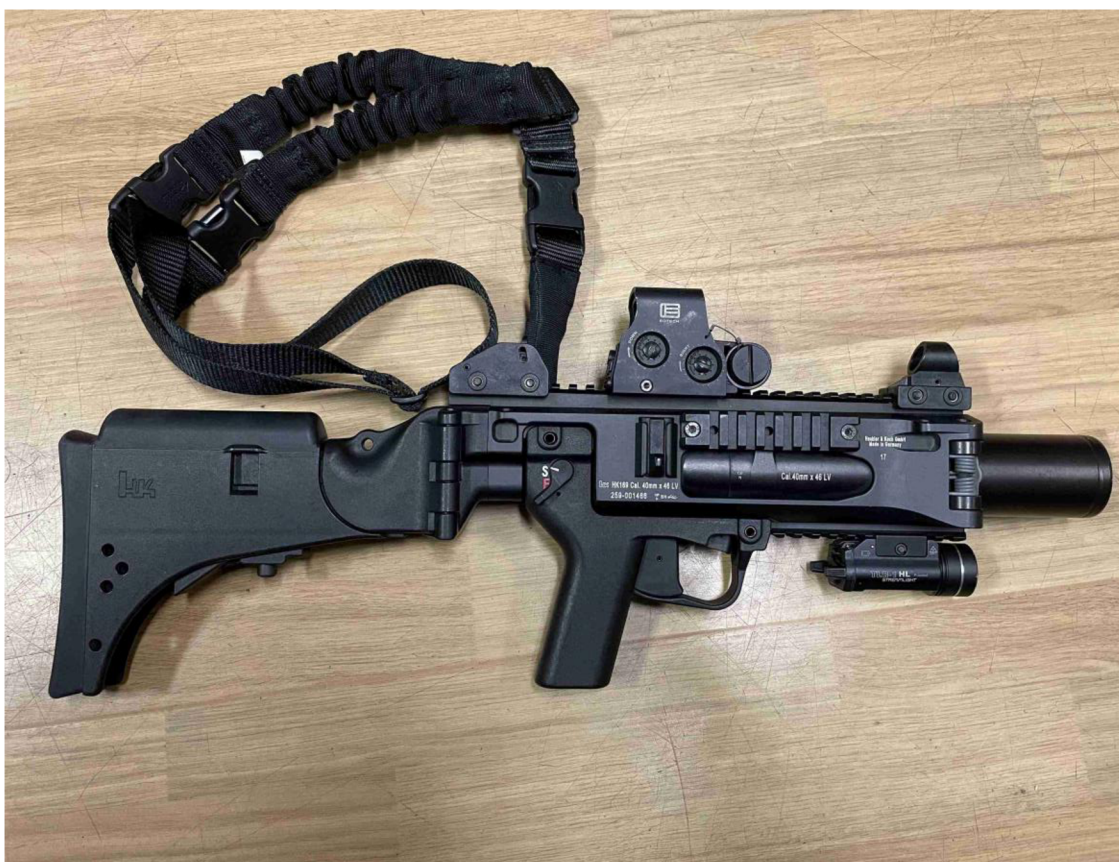
obr. č. 6 – Ruční vrhač – granátomet Heckler & Koch 169 s kolimátorem EOTech, třibodovým popruhem a svítilnou

(SIR), který lze využít od 5 metrů. Má zastavovací účinek a lze s ním aplikovat fyzickou sílu na vzdálenost do 50 metrů. Dalšími typy jsou např. SIR X, nebo IMPULSE (impulsní náboj). Využití je velmi pestré, jelikož různé druhy munice mají různý význam a charakter. Díky nárazovým nábojům lze z bezpečné vzdálenosti využít fyzickou sílu např. proti pachateli, který drží v ruce nůž a nechce spolupracovat, nebo proti jednotlivci na bezpečnostním opatření, který je agresivní a fyzicky napadá ostatní osoby, anebo proti skupině např. fanoušků, kdy se použije slzotvorný náboj s dočasně zneschopňujícími účinky. 68