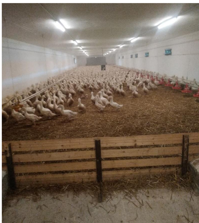
Obrázek 0.4. Studený výkrm – stáj Kouty