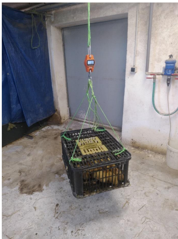
Obrázek. 0.5. Vážení kachen