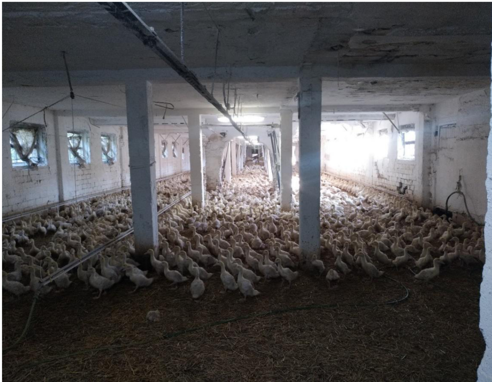
Obrázek 0.2. Studený výkrm – stáj Smilkov