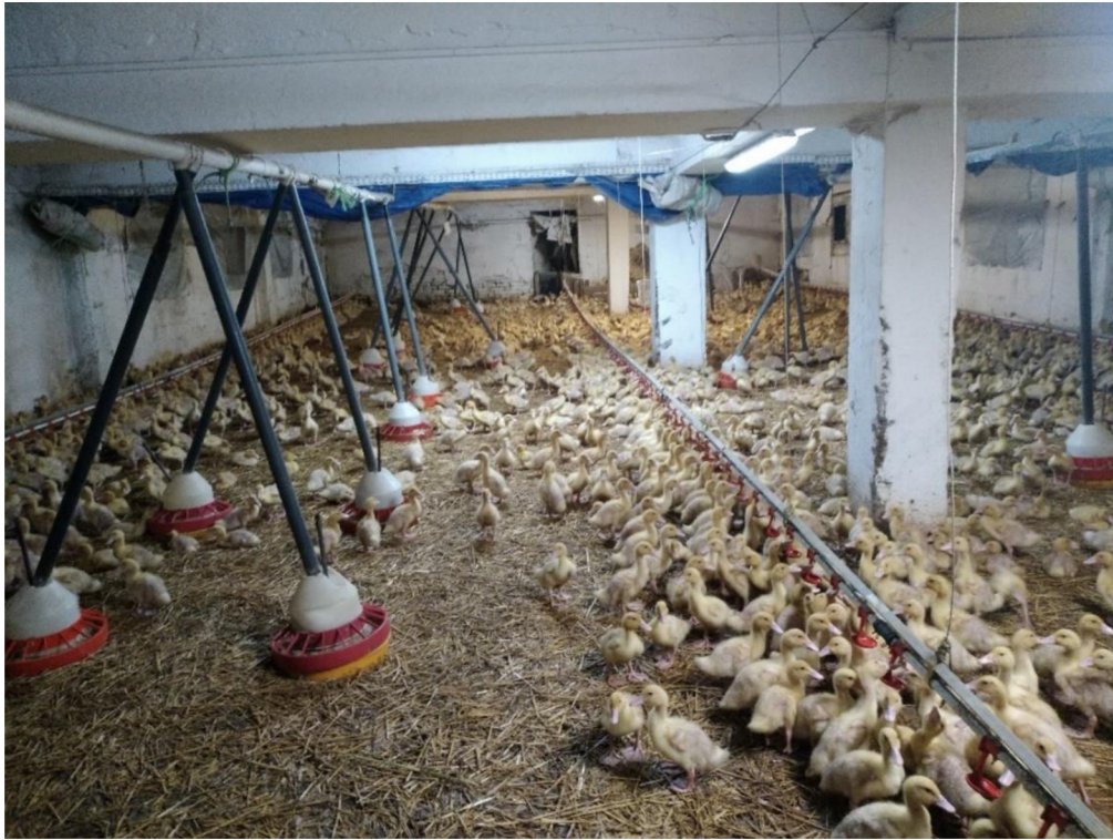
Obrázek 0.1. Teplý výkrm – stáj Smilkov