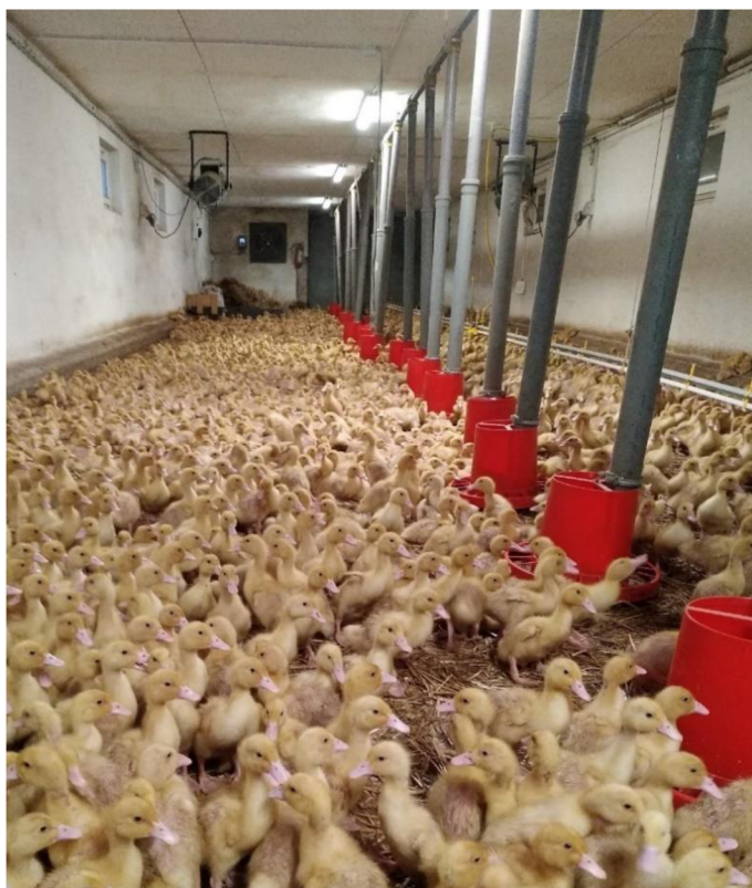
Obrázek 0.3. Teplý výkrm – stáj Kouty