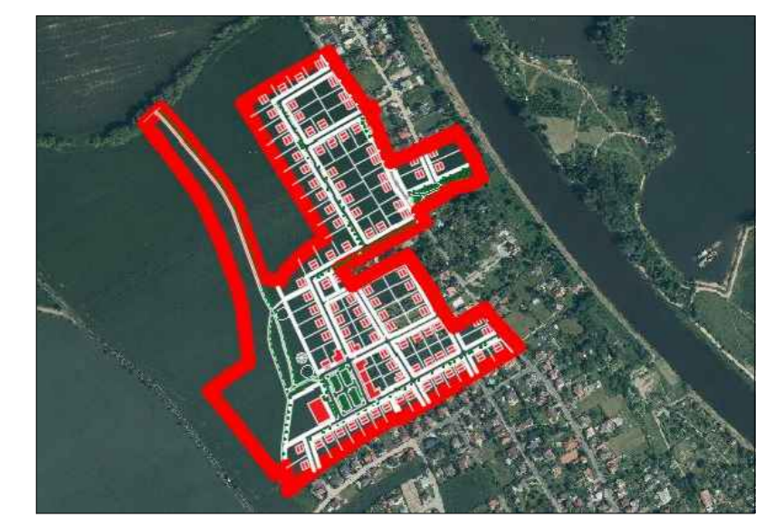
SCHÉMA ŠIRŠÍCH VZTAHŮ